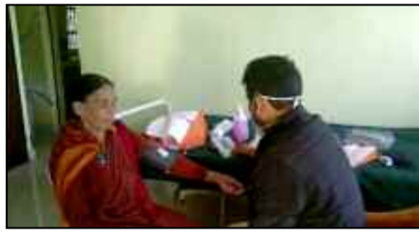
शिविर में बुजुर्गों के स्वास्थ्य की जांच करते चिकित्सक।

बुधवार को शिविर प्रातः दस बजे से शुरू होकर दोपहर तीन बजे तक चला। इस स्वास्थ्य शिविर में कुल 50 लोग पहुंचे जिसमें से 23 वरिष्ठ नागरिकों के आंखों के ऑपरेशन व स्वास्थ्य को लेकर हंस हॉस्पिटल सतपुली चमोली सैन के लिए भेजा गया। स्वास्थ्य शिविर में पहुंचे डॉक्टरों के द्वारा महिलाओं के विभिन्न रोगों व बुजुर्गों की आंखों, बीपी, शुगर, हड्डी सहित विभिन्न प्रकार की स्वास्थ्य की जांच की गई। शिविर में 50 से ज्यादा मरीजों