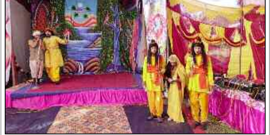
डाडामंडी में आयोजित रामलीला में मंचन करते कलाकार।