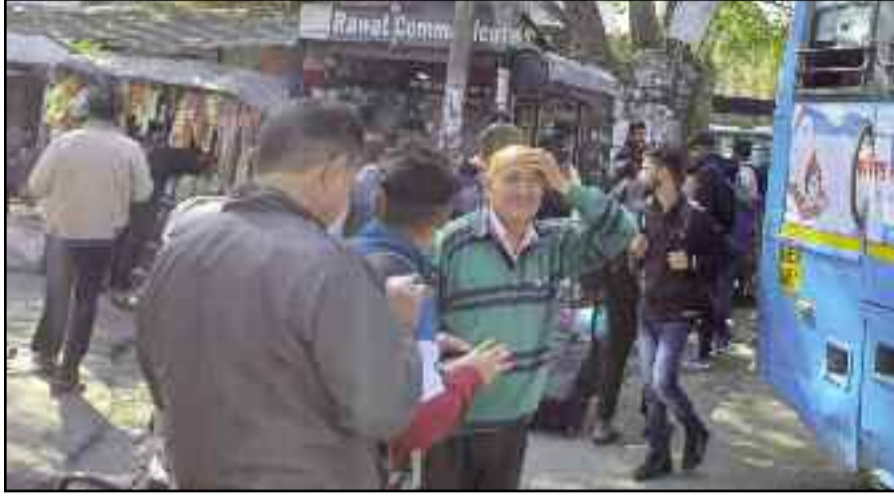
कोटद्वार बस अड्डे में मैदानी क्षेत्र के लिए बस का इंतजार करते यात्री।

मची रही। लोगों को बस अड्डे और सड़कों पर बस के लिए घंटों इंतजार करना पड़ा। यात्रियों का अधिक दबाव देखते हुए परिवहन निगम ने मैदानी क्षेत्र के