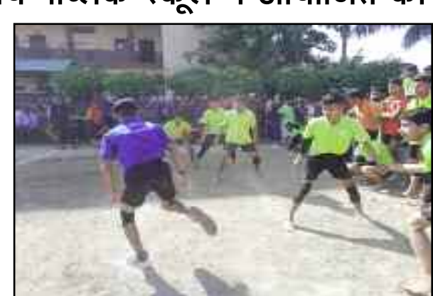
श्री गुरु राम राय पब्लिक स्कूल में आयोजित खेल प्रतियोगिता में प्रतिभाग करते विद्यार्थी।

शनिवार को सीनियर वर्ग की बैडमिंटन प्रतियोगिता में सुभाष हाउस ने अपना परचम लहराया। कैरम प्रतियोगिता छात्रा व छात्रा वर्ग में रमन हाउस विजेता व