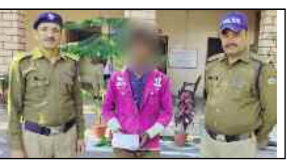
कोटद्वार कोतवाली में पुलिस हिरासत में सट्टा खिलवाने वाला आरोपी