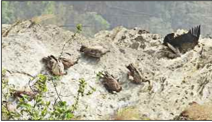
पहाड़ी पर बैठे गिद्ध।

और कुछ विलुप्त होने की कगार पर है। पौड़ी जनपद में विलुप्त होने की कगार पर पहुंचे गिद्धों के स्थायी अड्डों में भारी कमी आई है। प्रकृति के सफाई कर्मी और खाद्य शृंखला में अहम भूमिका निभाने वाले गिद्ध अब बड़ी मुश्किल से दिखाई देते हैं। कीटनाशक दवाइयों का उपयोग गिद्धों के लिए विनाश का कारण बनी हुई है। करीब 20 वर्ष पहले तक गिद्ध आसानी से