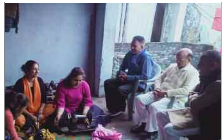
कोटद्वार में सिलाई केंद्र का भ्रमण करते सदस्य।