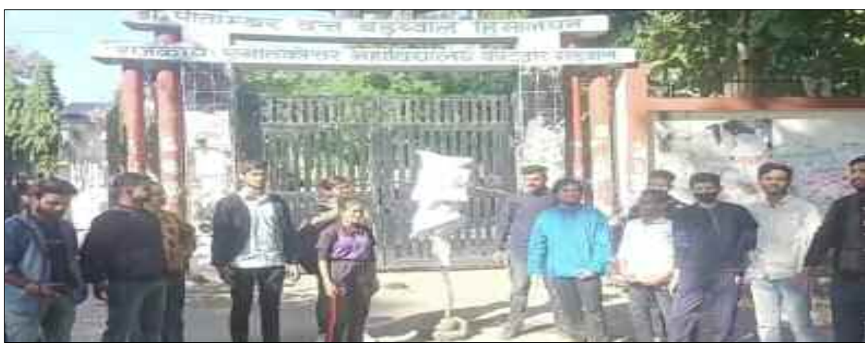
कोटद्वार महाविद्यालय में उच्च शिक्षा मंत्री का पुतला दहन करते अभाविप सदस्य

छात्र समस्याओं का निराकरण नहीं होने पर जताया रोष