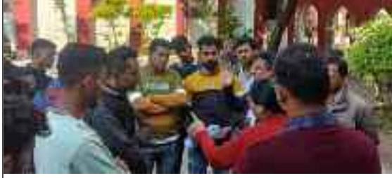
मुख्यमंत्री पुष्कर सिंह धामी जन संवाद कार्यक्रम में लोगों की समस्या सुनते हुए।

उन्होंने संबंधित अधिकारियों को समस्याओं के तत्काल निस्तारण हेतु निर्देशित किया। इस दौरान कई संगठनों व लोगों ने अपनी समस्याओं को सीएम के समक्ष प्रमुखता से रखा। उन्होंने कहा पूर्णागिरी को रोपवे से जोड़ने का कार्य जल्द ही किया जाएगा। दूरदराज सीमांत गांव के