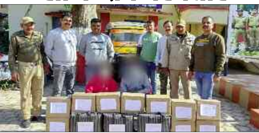
कोटद्वार कोतवाली में पुलिस हिरासत में पकड़े गए शराब तस्क़र