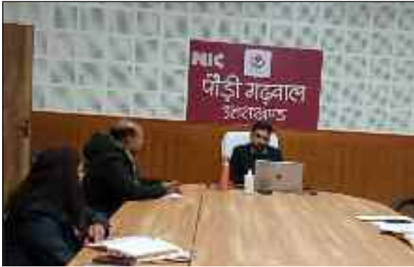
जिलाधिकारी डॉ. आशीष चौहान बैठक में निर्देश देते हुए।

जयन्त प्रतिनिधि। पौड़ी : भारत सरकार के दूरसंचार मंत्रालय के यूएसओएफ (यूनिवर्सल सर्विस ऑब्लिकेशन फंड) के अंतर्गत संपूर्ण देश को 4 जी सेवा प्रदान करने का कार्यक्रम है। जनपद पौड़ी में भी इस संबंध में तेजी से कार्य किया जायेगा। जनपद पौड़ी में अभी तक कुल 34 साइट का चयन किया गया है जहां पर 4 जी कनेक्टिविटी प्रदान की जानी है। जिलाधिकारी ने सभी उपजिलाधिकारियों व तहसीलदारों को निर्देशित किया कि जिन साइटों में सरकारी अथवा गैरसरकारी जो भी भूमि अनुमत्य होगी अगर अभी तक उपलब्ध नहीं हो पाई तो उस