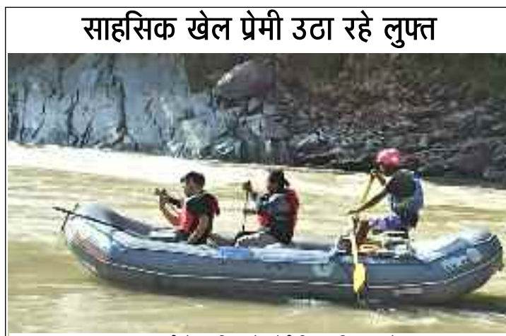
साहसिक खेल प्रेमी उठा रहे लुफ्त

मेलाथी जहां एक ओर सांस्कृतिक कार्यक्रमों का भरपूर आनंद ले रहे हैं वहीं मेले में लगे स्टलों पर भी जमकर खरीदारी हो रही है। जिला प्रशासन के प्रयासों से महिलाएं, बुजुर्ग एवं युवा सभी गौचर मेले का आनंद उठा रहे हैं, लेकिन इस बार गौचर मेला बच्चों के लिए खासा आकर्षण का केंद्र बना हुआ है। मेले में उंट की सवारी,