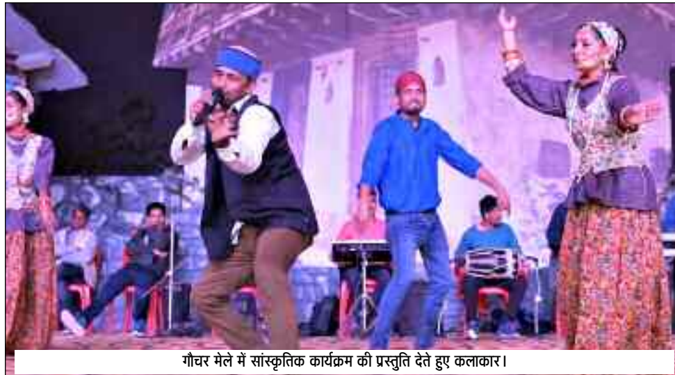
गौचर मेले में सांस्कृतिक कार्यक्रम की प्रस्तुति देते हुए कलाकार।

जयन्त प्रतिनिधि। चमोली : राज्य स्तरीय गौचर मेला इस बार अपने बहुआयामी अंदाज में छटा बिखेर रहा है। गौचर मेला इन दिनों अपने पुरे यौवन पर है। ज्यों ज्यों मेला आगे बढ़ता जा रहा है, मेलाथियों की भारी भीड़ उमड़ रही है। मेले में पारंपरिक पहाड़ी शैली में बना पांडाल व सेल्फी प्वाइंट भी लोगों के बीच आकर्षण का केंद्र बने हुए है।