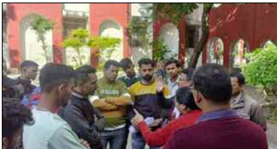
कोटद्वार के राजकीय स्नातकोत्तर महाविद्यालय में प्राचार्य का घेराव करते छात्र।

अपने हक की आवाज उठाई तो श्री देव सुमन विश्वविद्यालय उत्तर पुस्तिका जांच के नाम एक विषय के तीन सौ रुपये वसूल रहा है। यही नहीं, पुस्तिका जांच के लिए विद्यार्थियों को स्वयं ही टिहरी स्थित श्री देव सुमन