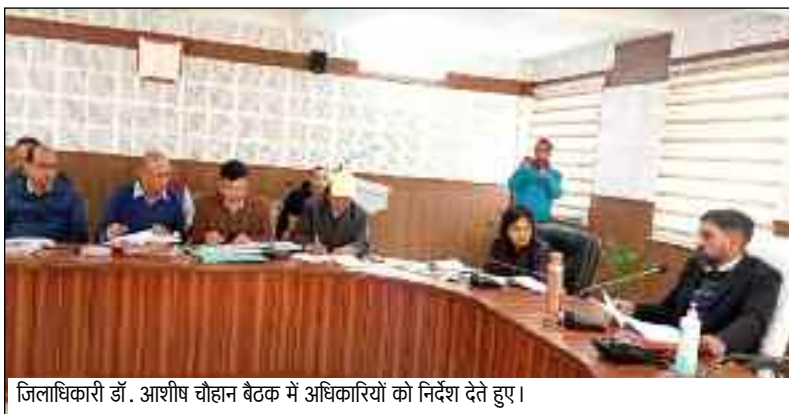
जिलाधिकारी डॉ. आशीष चौहान बैठक में अधिकारियों को निर्देश देते हुए।

जयन्त प्रतिनिधि पौड़ी : जिलाधिकारी ने मुख्यमंत्री घोषणा से संबंधित योजनाओं की प्रगति को और तीव्र गति से बढ़ाने के लिए विभिन्न विभागों को आपसी समन्वय से भूमि हस्तांतरण के साथ-साथ अन्य सभी छोटे-बड़े मुद्दों का समाधान करते हुए कार्यों में तेजी लाने को कहा। उन्होंने निर्देशित किया कि जो कार्य भूमि हस्तांतरण की वजह से लंबित है उनको प्राथमिकता में लेते हुए तत्काल भूमि हस्तांतरण से संबंधित प्रकरणों का समाधान करें। कहा कि भूमि हस्तांतरण से यदि कोई मामला ज्यादा समय से लंबित है उसका दो-तीन दिन में निस्तारित करवाएँ, जिससे विकास कार्यों को अधिक तेजी मिले। जिलाधिकारी संबंधित अधिकारी को निर्देशित किया कि थलीसैण के अंतर्गत चुतानी-इज्जर मोटर मार्ग, पैठाणी-भरीक मोटर मार्ग की वन भूमि हस्तांतरण की कार्यवाही 15 दिन के भीतर पूर्ण करें। साथ ही उन्होंने लोनिचि को निर्देशित किया कि उफरेखाल-भतपांव-गाड़-खर्क-भगड़ीधार मोटर मार्ग की डिजिटल मैपिंग करें जिलाधिकारी डॉ. आशीष चौहान की अध्यक्षता में कलेक्ट्रेट सभागार में मुख्यमंत्री की घोषणा से संबंधित विकास कार्यों की समीक्षा बैठक आयोजित की गई। बैठक में 12 वां वृत्त लोक निर्माण विभाग