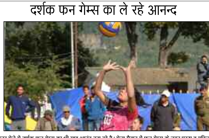
दर्शक फन गेम्स का ले रहे आनन्द

गौचर मेले में साहसिक खेल प्रेमियों के लिए इस बार रिवर राफ्टिंग, रिवर क्रॉसिंग, कार्याकिंग, प्लाईवूड फॉक्स, वर्माब्रीज, जैसे एडवेंचर गेम्स रखे गए हैं। गौचर में अलकनन्दा नदी पर रानी ब्रीज से सेरा तक लगभग तीन किलोमीटर के पैच पर रिवर राफ्टिंग प्रतियोगिता चल रही है। हवाई पट्टी के निकट बदरखंड में प्लाईवूड फॉक्स, वर्माब्रीज एडवेंचर एक्टिविटी का भी साहसिक खेल प्रेमी जमकर लुफ्त उठा रहे हैं।