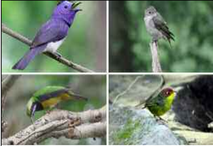
लैसडौन वन प्रभाग में पहुंचने वाले पक्षी।

प्रभाग के जंगलों में रेड बिल्ड लिओथ्रेक्स, स्लेटी ब्लू फ्लाई कैचर, ग्रे-बिल्ड टिसिया, हिमायलन रूबी थ्रो, ब्राउन डिपर, रूफस जाजेंट फ्लाईकैचर, ग्रे हेडेड केनरी फ्लाई कैचर, ब्राउन हेडेड अपनी दस्तक दे रहे हैं। ऐसे में पक्षी के दीदार के शौकीन लोगों के लिए यह एक