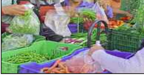
कोटद्वार के पटेल मार्ग में पालीथिन का उपयोग करते सब्जी विक्रेता

पर्यावरण संरक्षण को देखते हुए केंद्र सरकार ने एक जुलाई से पूरे भारत वर्ष में सिंगल यूज प्लास्टिक व पॉलीथिन पर प्रतिबंध लगाया था। इसके लिए बकायदा राज्य सरकारों को आदेश भी जारी किए गए। नियमों को सख्ती से लागू करने के लिए प्रदेश सरकार ने नगर निगम, नगर पंचायत व अन्य विभागों को