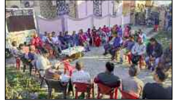
कोटद्वार में आयोजित बैठक में भाग लेते समिति के सदस्य

बैठक में पूर्व में बाईपास विरोध को लेकर समिति द्वारा किए गए कार्यों को सार्वजनिक किया गया और आगामी रणनीति पर चर्चा की गई। वक्ताओं ने कहा कि कुछ दिन पूर्व सनेहवासी अपनी समस्या से विधानसभा अधिकारी को अवगत करवाना चाहते थे। लेकिन, विधानसभा अध्यक्ष ने उनसे बात तक नहीं की। विधानसभा के इस व्यवहार से सनेहवासियों में रोष