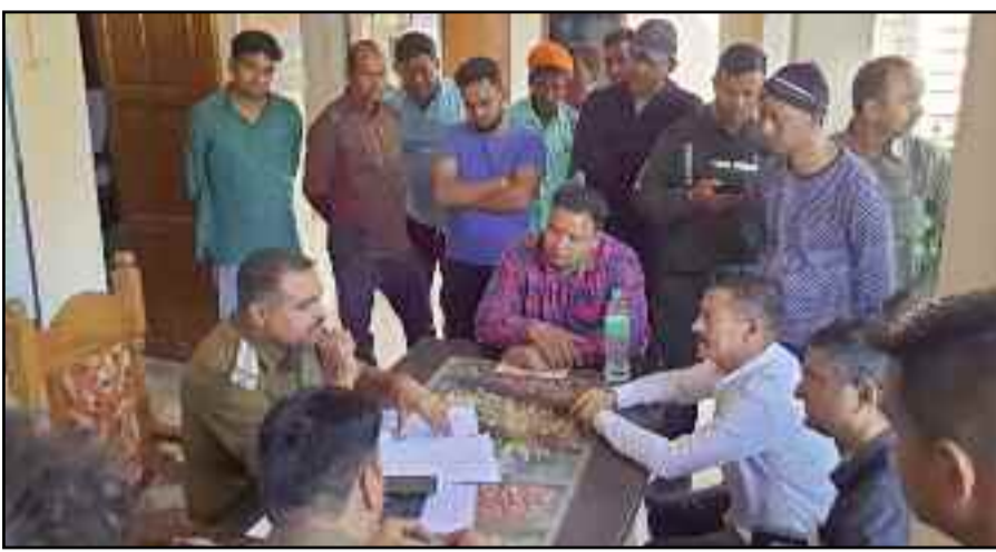
कोटद्वार कोतवाली में विवाहिता की मौत के बाद हत्या का मुकदमा दर्ज करने पर आक्रोश जताते रोष

जयन्त प्रतिनिधि। कोटद्वार: 26 अक्टूबर को जीवानंदपुर क्षेत्र में कीटनाशक खाने से हुई विवाहिता की मौत के मामले में ससुराल पक्ष ने पुलिस पर बिना जांच कि हत्या का मुकदमा दर्ज करने का आरोप लगाया है। कहा कि पुलिस ने अस्पताल में उपचार के लिए पहुंची विवाहिता के बयान भी दर्ज नहीं किए। पुलिस ने मृतिका को मां की झूठी तहरीर पर पति पर हत्या का मुकदमा दर्ज कर दिया। जबकि, विवाहिता को बचाने के लिए ससुराल पक्ष ने हर संभव प्रयास किए।