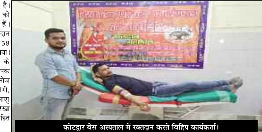
कोटद्वार बेस अस्पताल में रक्तदान करते विहिप कार्यकर्ता।