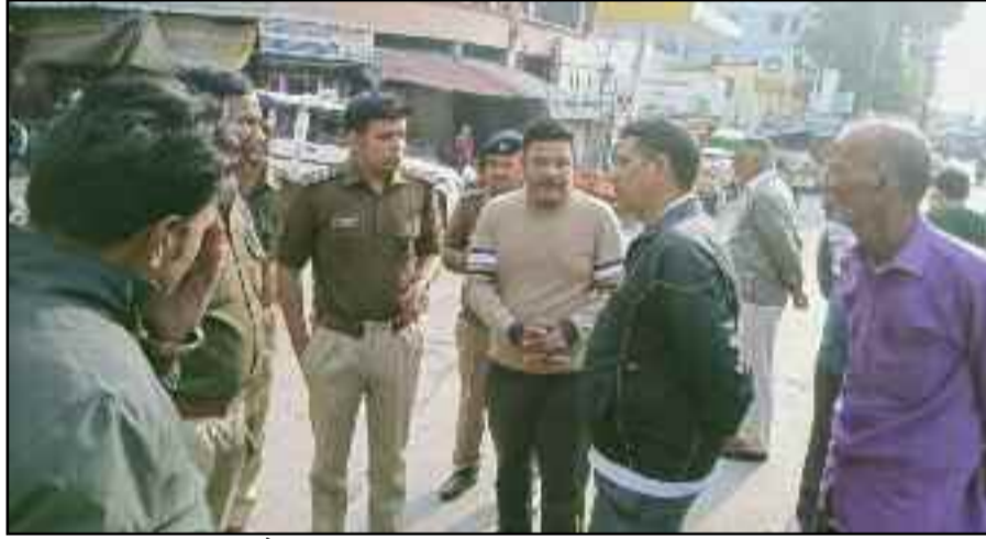
अभियान के दौरान व्यापारी व वाहन चालकों से वार्ता करते पुलिस अधिकारी।

जयन्त प्रतिनिधि। कोटद्वार: शहर में यातायात व्यवस्था को बेहतर बनाने के लिए यातायात पुलिस की ओर से बुधवार को अभियान चलाया गया। इस दौरान पुलिस ने गोखले