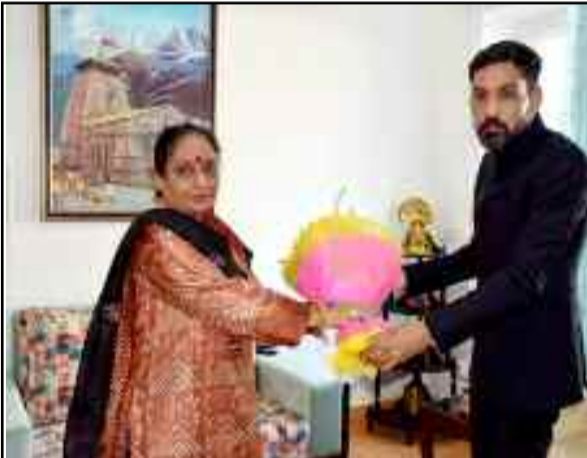
विधानसभा अध्यक्ष ऋतु खंडूड़ी भूषण से मिलते जिलाधिकारी

जयन्त प्रतिनिधि। कोटद्वार: पौड़ी के नवनियुक्त जिलाधिकारी आशीष चौहान ने कार्यभार संभालने के बाद उत्तरखंड विधानसभा अध्यक्ष व कोटद्वार विधायक ऋतु खंडूड़ी भूषण से देहरादून में उनके शासकीय आवास पर शिष्टाचार भेंट की। इस अवसर पर विधानसभा अध्यक्ष ने जिलाधिकारी को शुभकामनाएं देते हुए कोटद्वार विधानसभा क्षेत्र से संबंधित विभिन्न विषयों को लेकर चर्चा की।