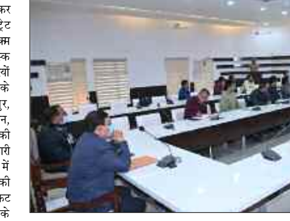
करने के निर्देश दिये। बैठक में अधिकारियों को निर्देश देते हुए प्रथम एनएम को प्राप्त-पांच हजार की