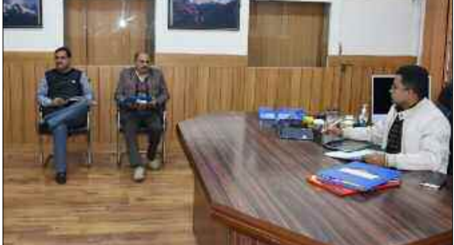
सुधारीकरण, पुलना से घांघरिया पैदल मार्ग के मध्य स्थित बोल्टों को तोड़ने एवं क्षतिग्रस्त दीवारों का पुर्ननिर्माण कार्य, यात्री शैड, घोड़ा पथक तथा पुलना में पार्किंग निर्माण के अवशेष कार्यों को जल्द से जल्द पूरा करना सुनिश्चित करें। ऊपरी क्षेत्र में बर्फचारी के कारण अवशेष निर्माण कार्यों को यात्रा सीजन से पहले पूरा करने हेतु कार्ययोजना तैयार रखें। लोनिवि के अधीक्षण अभियंता ने