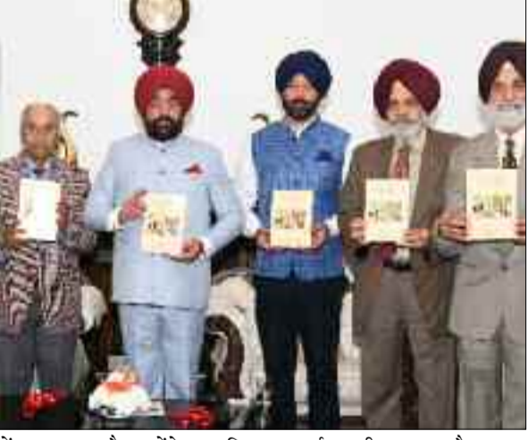
में बताया गया है। उन्होंने कहा कि गुरुओं का जीवन दर्शन, उनकी आध्यात्मिक चेतना और उच्च आदर्शमय जीवन, राष्ट्र और समाज में शांति की स्थापना के महान उद्देश्य के साथ उनके आदर्श