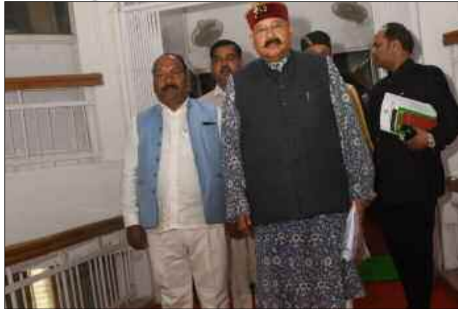
मोटर मार्ग बहने की समस्या का उत्तर देते हुए बताया कि इस प्रकार की समस्या बेहद गंभीर है। इस स्थान पर स्पान सेतु का निर्माण किया गया है जिस पर वर्तमान में आवागमन सुचारू रूप से चल रहा है। इस मार्ग पर स्पान आरसीसी पुलिया के निर्माण की स्वीकृति जिला योजना के अंतर्गत प्रदान की गई है। विधासतसभा सदस्य फुरकान अहमद द्वारा होमस्टे से संबंधित

महर ने पर्यटन मंत्री सतपाल महाराज से जानना चाहा कि पिथौरागढ़ में पर्यटकों को आकर्षित करने हेतु जिस टयूलिप गार्डन का निर्माण कराया गया था उसकी वर्तमान में क्या स्थिति है। गार्डन को बनाने में कुल कितना धन व्यय किया गया और टयूलिप पुष्प की पौध कहां से मंगाई गईं। पर्यटन मंत्री सतपाल महाराज ने सदन को अवगत कराया कि पिथौरागढ़ के मोस्टमार्नु में टयूलिप गार्डन प्रस्तावित किया गया था। मोस्टमार्नु मंदिर एवं पशुपतिनाथ मंदिर में पायलट प्रोजेक्ट के तहत 25,000 टयूलिप बल्ब रोपित किए गए थे जिनका कि वर्तमान में मंदिर समिति द्वारा उपयोग किया जा रहा है। टयूलिप बल्ब प्लांटेशन कुल 22,17,515 रुपये का व्यय किया गया। टयूलिप बीज का उत्पादन स्थानीय स्तर पर ना होने के कारण तुलिप गार्डन को तैयार किए जाने पर उसके रखरखाव आदि पर अत्याधिक व्यय होना जैसी समस्याएं सामने आने के कारण इसका क्रियान्वयन नहीं किया जा सकता है। लोक निर्माण मंत्री सतपाल महाराज ने सदस्य मयूख महर के चंद्रभागा नदी के ऊपरी भाग में विभाग द्वारा बनाए गए 18 मीटर स्पान पुल के निचले भाग में वर्षा ऋतु में अत्यधिक वर्षा के कारण