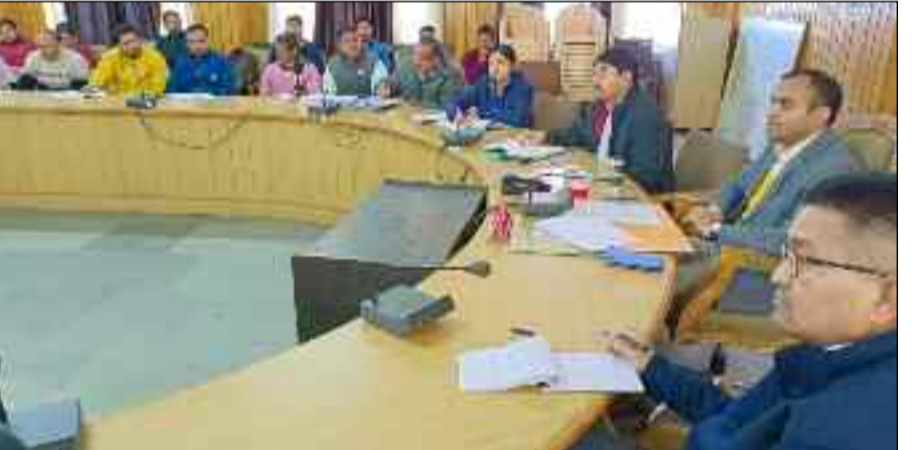
खंड विकास स्तर से संचालित हो रही विकास योजनाओं को गुणवत्ता एवं समयबद्धता के साथ पूर्ण करने एवं योजनाओं के संचालन में आ रही कठिनाई एवं स्थानीय स्तर पर आम जनमानस द्वारा दर्ज की जा रही शिकायतों का

रुद्रप्रयाग : जिलाधिकारी मयूर दीक्षित ने सभी ग्राम विकास अधिकारी एवं ग्राम पंचायत अधिकारियों से कहा कि सरकार द्वारा संचालित जन कल्याणकारी योजनाओं के सफल क्रियान्वयन एवं उनकी धरतल में उतारते हुए उस योजना का लाभ आम जन मानस तक उपलब्ध करने में उनकी महत्वपूर्ण भूमिका है। इसलिए सभी अधिकारी अपने दायित्वों एवं जिम्मेदारी का निर्वहन कुशलता के साथ करें। उन्होंने सभी अधिकारियों को निर्देश दिए हैं कि विकास कार्यों की गुणवत्ता में किसी भी प्रकार की कोई कमी पाई जाती है तो संबंधित के विरुद्ध आवश्यक कार्यवाही की जाएगी, जिसकी जिम्मेदारी संबंधित अधिकारी एवं कर्मचारियों की होगी।