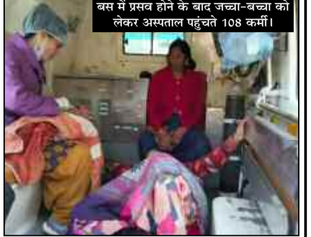
बस में प्रसव होने के बाद जच्चा-बच्चा को लेकर अस्पताल पहुंचते 108 कर्मी।

108 महिला कर्मी ने बताया कि उनके मौके पर पहुंचने से पहले ही महिला का प्रसव हो चुका था। ऐसे में उन्होंने महिला व शिशु को तुरंत ऑक्सिजन लगाई और उन्हें लेकर राजकीय बेस चिकित्सालय कोटद्वार पहुंच गए। वहीं, चिकित्सकों ने बताया कि महिला व शिशु पूरी तरह सुरक्षित हैं। दोनों को अस्पताल में भर्ती करवाया गया है।