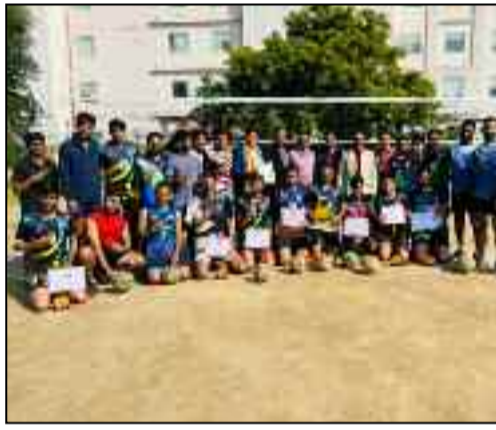
हरिद्वार। दयानंद स्टेडियम परिसर में आयोजित अन्तर संकाय वालीबॉल प्रतियोगिता के फाइनल मुकाबले में योग एवं शारीरिक शिक्षा संकाय ने विज्ञान संकाय को 2-0 से हराकर ट्राफी पर कब्जा किया। गुरुकुल कांगड़ी समावेशविद्यालय के शारीरिक शिक्षा एवं खेल विभाग द्वारा आयोजित अन्तर-संकाय वालीबॉल प्रतियोगिता के समापन तथा विश्वविद्यालय टीम चयन के