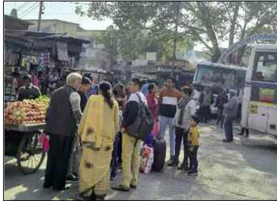
कोटद्वार में परिवहन निगम के बस अट्टे पर बस का इंतजार करते यात्री

निजी वाहनों की ओर से मंगलवार को हड़ताल का एलान किया गया था। ऐसे में इसका असर गढ़वाल के प्रवेश द्वार कोटद्वार में भी देखने को मिला। पर्वतीय क्षेत्रों के लिए तो यातायात पूरी तरह सुचारु रहा। लेकिन, जीएमओयू व मैक्स वाहनों ने देहरादून व हरिद्वार रूट पर अपने वाहनों का संचालन नहीं किया। ऐसे में पूरे दिन