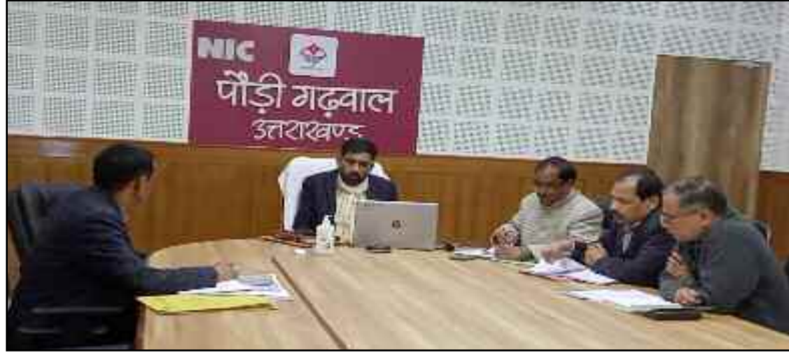
जिलाधिकारी डॉ. आशीष चौहान एनआईसी कक्ष में वन पंचायत संबंधित बैठक लेते हुए।

जयन्त प्रतिनिधि। पौड़ी : जिलाधिकारी डॉ. आशीष चौहान ने राजस्व विभाग के साथ-साथ वन विभाग के अधिकारियों को निर्देशित किया कि बच्चों व अन्य लोगों को बाघ से सुरक्षित रखने हेतु जो रास्ते वन्य जीवों की दृष्टि से संवेदनशील बने हुए हैं वहां पर झाड़ी कटान का कार्य जल्द से जल्द पूर्ण करें। जिससे बाघ का खतरा कम बना रहेगा और लोगों को परेशानियों का सामना भी नहीं करना पड़ेगा। उन्होंने कहा कि बच्चों व अन्य लोगों को बाघ से सुरक्षित रखने हेतु वन कर्मियों व पीआरडी कर्मियों के माध्यम से लोगों को जागरूक करने हेतु पोस्टर, बैनर चस्पा करें। जिलाधिकारी डॉ. आशीष चौहान की अध्यक्षता में एनआईसी कक्ष में वन पंचायत संबंधित बैठक आयोजित की गई। जिलाधिकारी ने कहा कि जिन वन पंचायतों में बस्ता हस्तांतरित की कार्यवाही अभी तक शेष है, वहां एक सप्ताह में बस्ता हस्तांतरण की कार्यवाही पूर्ण करें। जिन वन पंचायतों में चुनाव होने बाकि हैं वहां एक सप्ताह में