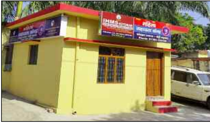
कोतवाली में बना महिला शिकायत केंद्र, जिसके विस्तार की योजना बनाई जा रही है।

शहर में बिना सत्यापन किए हुए अपराधों को रोकने के लिए पुलिस ने सख्ती दिखाना शुरू कर दिया है। इसके लिए पुलिस की विशेष टीम गठित की गई है। तीन दिन से पुलिस लगातार क्षेत्र में घूमकर भवन स्वामियों से अपने किराएदारों का सत्यापन करने की अपील कर रही है। इसके बाद पुलिस सत्यापन न करने वालों के खिलाफ कानूनी कार्रवाई करेगी।