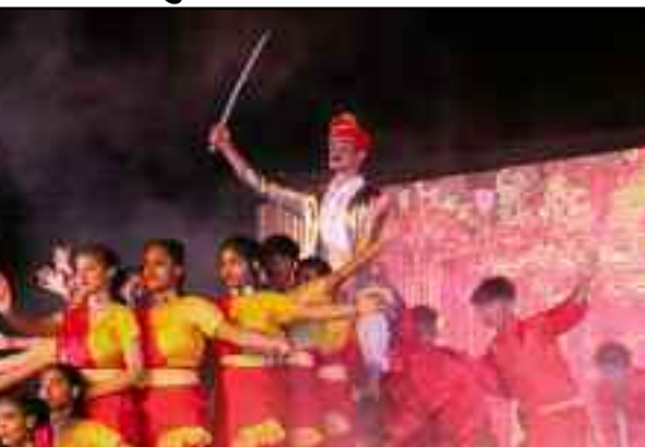
कोटद्वार के हेरिटेज एकेडमी में सांस्कृतिक प्रस्तुति देते विद्यार्थी।