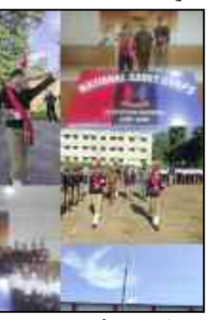
एनसीसी दिवस पर आयोजित कार्यक्रम में प्रतिभाग करते विद्यार्थी

कोटद्वार: हिंदू जागरण मंच की जिला कार्यकारीणी की मंच कार्यालय में आयोजित बैठक में कई मुद्दों पर चर्चा की गई। इस दौरान सदस्यों ने संगठन की मजबूती के लिए कार्य करने का संकल्प लिया।