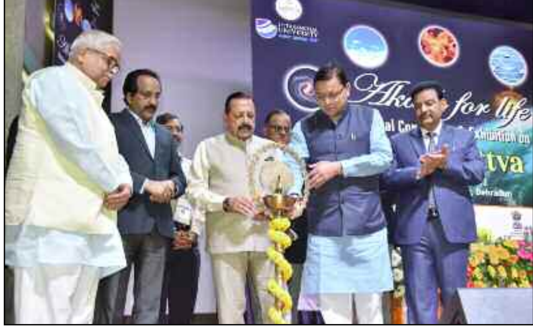
मुख्यमंत्री पुष्कर सिंह धामी दीप प्रज्वलित कर कार्यक्रम का शुभारंभ करते हुए।

के क्षेत्र में महाशक्ति के रूप में स्थापित हो रहा है। मुख्यमंत्री ने कहा कि प्रधानमंत्री मोदी ने पुरातन व आधुनिक विज्ञान दोनों की सहभागिता सुनिश्चित करते हुए सीएसआर अर्थात कॉर्पोरेट सोशल रेस्पॉसिबिलिटी की तर्ज पर एसएसआर अर्थात साइंटिफिक सोशल रेस्पॉसिबिलिटी के विचार को अपनाने की वैज्ञानिकों से अपील की है। इस प्रकार के सम्मेलन वैज्ञानिक समुदाय के क्रिएटिव माइंड्स को एक मंच पर लाकर एक भारत-श्रेष्ठ भारत की संकल्पना को सार्थक करने का मजबूत प्रयास है। उन्होंने कहा कि मानव जीवन के लिए पांच तत्वों आकाश, वायु, जल, पृथ्वी और अग्नि का होना अत्यंत महत्वपूर्ण है। इन पांच तत्वों के संरक्षण व संवर्धन की हमारी प्राचीन परंपरा को आगे बढ़ाने के लिए इस सम्मेलन में विचार-विमर्श हो रहा है, जो निश्चित रूप से सार्थक सिद्ध होगा। मुख्यमंत्री ने कहा कि हम उत्तराखण्ड वासी सौभाग्यशाली हैं कि हम हिमालय की गोद में बसे हैं और ये पंचतत्व हमें विशुद्ध रूप से शुद्ध वायु, स्वच्छ जल, उपजाऊ मृदा और स्वच्छ आकाश के रूप में प्रकृति से उपहार स्वरूप मिले हैं। राज्य सरकार की कोशिश है कि आर्थिकी और पारिस्थितिकी के बीच संतुलन बना रहे।