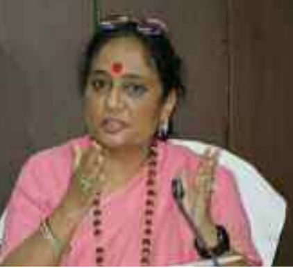
कोटद्वार में अधिकारियों की बैठक लेती विस अध्यक्ष ऋतु खंडूडी भूषण।

कोटद्वार: उत्तराखंड विधानसभा अध्यक्ष ऋतु खंडूडी भूषण ने कोटद्वार विधानसभा क्षेत्र के अंतर्गत सड़क निर्माण कार्यों को लेकर लोक निर्माण विभाग के अधिकारियों के साथ बैठक की। इस अवसर पर विधानसभा अध्यक्ष ने विभाग के अधिकारियों को सख्त हिदायत देते हुए कहा कि 30 नवंबर तक सभी लंबित सड़क निर्माण कार्यों को पूर्ण किया जाए एवं जिन निर्माण कार्यों को प्रारंभ नहीं किया गया है उन्हें शीघ्र ही शुरू किया जाए।