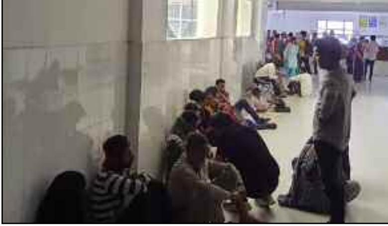
बेस चिकित्सालय में उपचार के लिए पहुंचे मरीज

♦ दोपहर की धूप व सुबह शाम की ठंड कर रही बीमार ♦ राजकीय बेस चिकित्सालय के साथ ही निजी अस्पतालों में बढ़ी भीड़