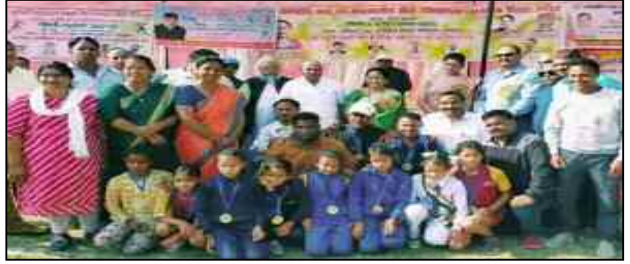
प्रतियोगिता में जीत के बाद खुशी मनाती विजेता टीम।

बेसिक विद्यालयों की शरद एवं शीतकालीन प्रतियोगिता का हुआ समापन