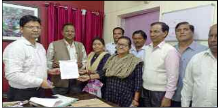
कोटद्वार में उपजिलाधिकारी के माध्यम से मुख्यमंत्री को ज्ञापन भेजते आंदोलनकारी।

आंदोलनकारियों ने उपजिलाधिकारी के माध्यम से मुख्यमंत्री को ज्ञापन प्रेषित किया है। ज्ञापन में कहा गया है कि उनकी मांगों पर शासनदेशों के बाद भी कोई कार्रवाई नहीं हुई। इसके अंतर्गत 7 सितंबर 2021 को जारी शासनदेश के अनुसार चिन्हीकरण के लिए आंदोलनकारियों के लंबित आवेदनों का निस्तारण 31