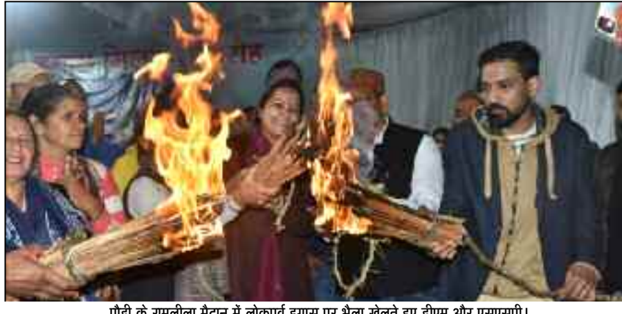
पौड़ी के रामलीला मैदान में लोकपर्व इगास पर भैला खेलते हुए डीएम और एसएसपी।

माधो सिंह भंडारी के इगास गीत गाकर लोक पर्व में चार चांद लगाए। स्थानीय लोक संस्कृति और त्यौहार को जीवंत होते देख सभी लोगों ने जिलाधिकारी और उनकी टीम की सराहना करते हुए कहा कि जिस तरह से आज जनपद पौड़ी से लोक संस्कृति को बचाने की अनुभूति मुहिम शुरू हुई है। इससे स्थानीय संस्कृति के शुभचिंतकों, स्थानीय निवासियों और पहाड़ी की संस्कृति से प्यार जताने वालों को आशा जगी है कि अब स्थानीय संस्कृति के दिन