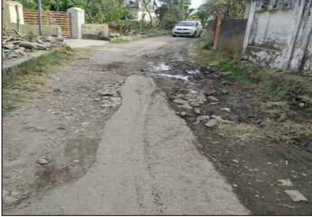
देखरेख के अभाव में कोटद्वार में बदहाल पड़ा आमपड़ाव—शिवपुर मार्ग।

स्थानीय विधायक को पत्र दे चुके हैं। लेकिन, अब तक कोई भी अधिकारी या कर्मचारी मौके पर झांकने तक नहीं पहुंचा। सबसे अधिक परेशानी बरसात के समय होती है। हल्की बारिश होने पर पूरे मार्ग में कीचड़ भर जाता है। स्थिति देखकर लगता है मनो निगम व प्रशासन ने आमन की सुध लेनी ही छोड़ दी है।