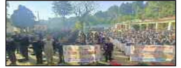
पब्लिक इंटर कालेज सुरखेत में आयोजित कार्यक्रम में संविधान की शपथ लेते विद्यार्थी