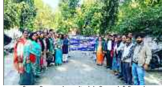
राजकीय महाविद्यालय कोटद्वार में नशे के खिलाफ रैली निकालते हुए प्राध्यापक और छात्र-छात्राएं।