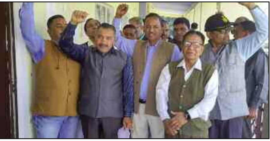
कोटद्वार तहसील में सरकार के खिलाफ प्रदर्शन करते उक्राद कार्यकर्ता।