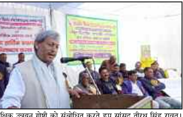
शैक्षिक उन्नयन गोष्ठी को संबोधित करते हुए सांसद तीरथ सिंह रावत।

जयन्त प्रतिनिधि। पौड़ी : राजकीय शिक्षक संघ पंचम द्विवार्षिक अधिवेशन एवं शैक्षिक उन्नयन गोष्ठी में गढ़वाल सांसद तीरथ सिंह रावत ने राजकीय आदर्श इंटर कॉलेज पौड़ी नगर में मुख्य अतिथि के रूप में प्रतिभाग किया। उन्होंने कार्यक्रम का शुभारंभ दीप प्रज्वलित कर किया। इस दौरान स्कूली छात्राओं द्वारा सांस्कृतिक कार्यक्रमों की शानदार प्रस्तुति भी दी गई। सांसद ने कहा कि बच्चों को बेहतर शिक्षा तथा उन्हें अच्छे संस्कार एक गुरु ही दे सकता है। इसलिए हर गुरु को बच्चों के बेहतर भविष्य के बारे में गंभीरता से कार्य करना चाहिए, जिससे क्षेत्र का नाम ही नहीं विद्यालय व गुरु का नाम भी रोशन होगा। गढ़वाल सांसद तीरथ सिंह रावत ने कहा कि गुरु शब्द अपने आप में बहुत ही महत्वपूर्ण है। उन्होंने कहा कि विद्यालय में आने वाले छात्र-छात्राओं को एक गुरु ही अच्छे संस्कार देता है। कहा कि जो