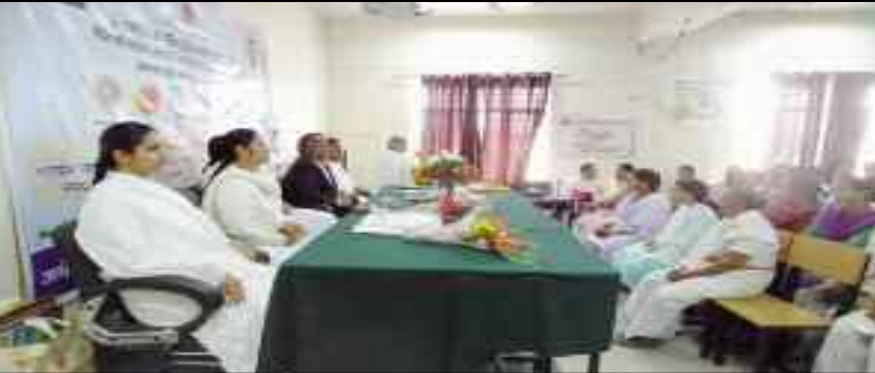
कोटद्वार में भावर स्थित राजकीय महाविद्यालय में आयोजित कार्यक्रम में विचार रखते वक्ता।