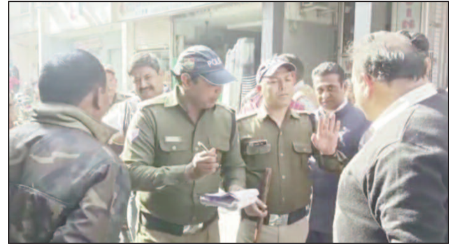
पुलिस की ओर से की जा रही चालान की कार्रवाई का विरोध करते व्यापारी

ऐसे में पुलिस लगातार मार्ग को रेहड़ी-टेली वालों से खाली करवाने के प्रयास में जुटी हुई है। इसके लिए बकायदा मार्ग पर पीएसबी भी तैनात कर गई है। शनिवार को मार्ग पर पहुंचे पुलिस ने दुकानों के बाहर वाहन खड़ा कर सामान खरीदने के लिए आए व्यापारियों के वाहनों के