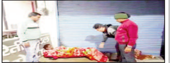
बेसहारा लोगों को कंबल वितरित करती संस्था

कोटद्वार: मौसम में बदलाव आते ही ठंड का प्रकोप बढ़ने लगा है। इसे देखते हुये सामाजिक संस्था एक नई आशा फाउंडेशन ने सड़कों पर रहने वाले बेघर श्रमिकों व अन्य लोगों को कंबल वितरित किए। संस्था की ओर से स्टेशन रोड, जीएमओयू बस अड्डा, झंडाचौक लालबती चौक सहित अन्य स्थानों पर सड़क