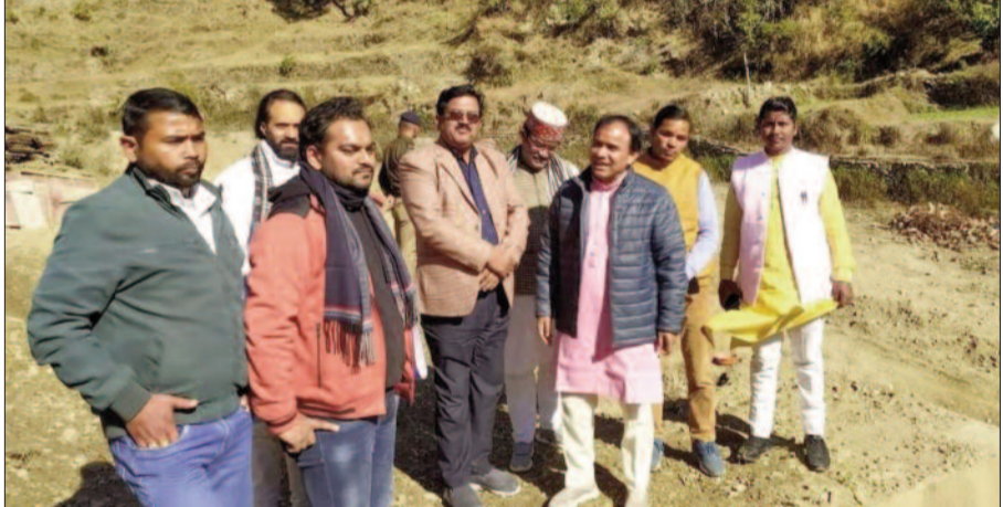
कैबिनेट मंत्री डॉ. धन सिंह रावत विकास कार्यों का निरीक्षण करते हुए।

जयन्त प्रतिनिधि। पौड़ी : उच्च शिक्षा मंत्री डॉ० धन सिंह रावत ने शनिवार को श्रीनगर विधानसभा के अंतर्गत विभिन्न योजनाओं व निर्माणधीन विकास कार्यों का निरीक्षण किया। उन्होंने पैठाणी राहू मंदिर में पूजा अर्चना कर क्षेत्र की खुशहाली के लिए प्रार्थना की। इस दौरान उन्होंने पैठाणी बाजार में आम जनमानस से मुलाकात कर उनकी समस्याएं सुनीं। उन्होंने राजकीय इंटर कॉलेज हिवालीधार में 41 लाख की