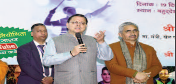
परेड ग्राउंड, देहरादून में बैडमिंटन प्रतियोगिता के शुभारंभ अवसर पर संबोधित करते हुए सीएम पुष्कर सिंह धामी।

जयन्त प्रतिनिधि देहरादून : मुख्यमंत्री पुष्कर सिंह धामी ने शनिवार को परेड ग्राउंड, देहरादून में उत्तराखंड सचिवालय बैडमिंटन क्लब द्वारा आयोजित अन्तर्विभागीय बैडमिंटन प्रतियोगिता का शुभारंभ किया। इस दौरान मुख्यमंत्री ने स्वयं भी बैडमिंटन खेल खिलाड़ियों का हौसला बढ़ाया। यह बैडमिंटन प्रतियोगिता 17 से 19 दिसम्बर