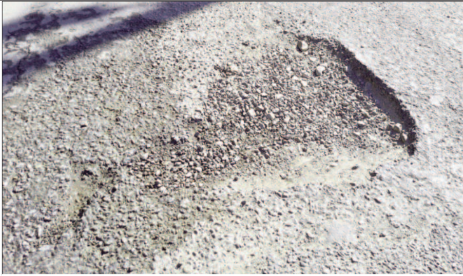
कोटद्वार में बदहाल पड़ा डिग्री कॉलेज-मवाकोट मार्ग