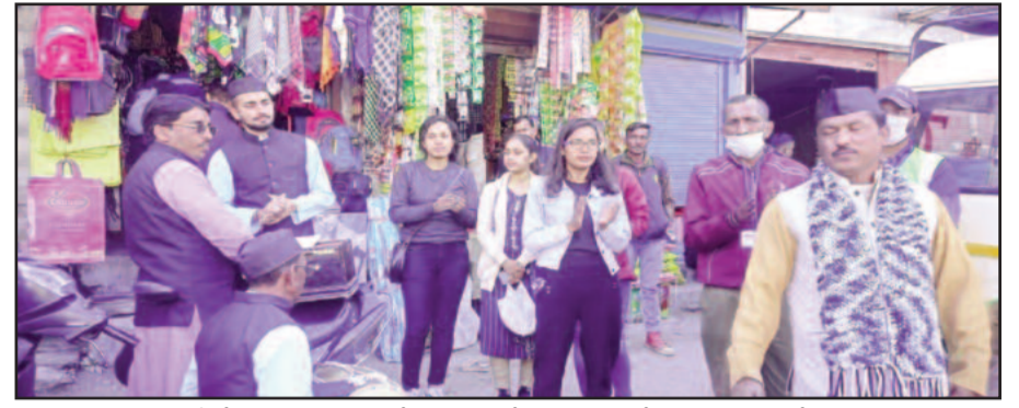
सतपुली में नुक्कड़ नाटक के माध्यम से आमजन को जागरूक करते कलाकार

पालीथिन व स्वच्छता के प्रति आमजन को किया जागरूक