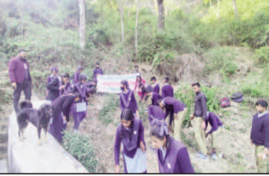
इंटरमीडिएट कालेज परसुंडाखाल में स्वच्छता अभियान चलाते स्वयंसेवी