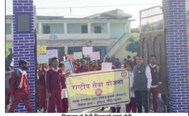
विद्यालय से रैली निकालते स्वयं सेवी

जयन्त प्रतिनिधि। कोटद्वार: स्पर्श गंगा दिवस पर राष्ट्रीय सेवा योजना इकाई राजकीय इंटर कालेज सुखरो की ओर से क्षेत्र में जागरूकता रैली निकाली गई। इस दौरान विद्यार्थियों ने खोह नदी के तट पर पहुंचकर स्वच्छता अभियान