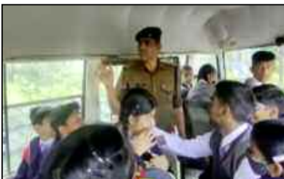
कोटद्वार में ओवरलोड वाहनों के खिलाफ अभियान चलाती यातायात पुलिस

कोटद्वार: शहर में ओवरलोड वाहनों के खिलाफ यातायात पुलिस ने सख्ती दिखाया शुरू कर दिया है। पुलिस टीम ने कौड़िया-मोटाढांक रोड में पहुंचकर ओवरलोड वाहनों के खिलाफ अभियान चलाया। अभियान के दौरान स्कूल की भी तलाशी की गई। पुलिस ने स्कूल संचालकों को बसों में क्षमता से अधिक बच्चों को नहीं बैठाने की हिदायत दी।