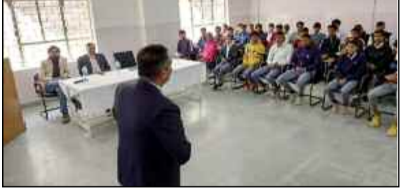
हिमालयन स्कूल आफ साइंस एंड टेक्नोलोजी में विद्यार्थियों को संबोधित करते अतिथि