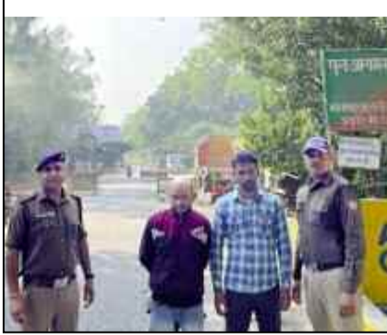
कोटद्वार में बदमाशों को जिला बंदर करती पुलिस