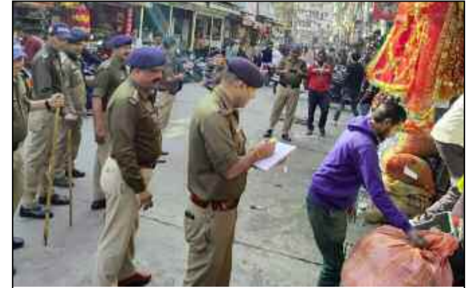
कोटद्वार के गोखले मार्ग में अतिक्रमण हटाने पहुंची पुलिस व पीएसी के जवान।

कोटद्वार: गोखले मार्ग में फैले अतिक्रमण के खिलाफ पुलिस का अभियान दूसरे दिन भी जारी रहा। शुक्रवार को पुलिस व पीएसी की टीम ने मार्ग में पहुंचकर अतिक्रमणकारियों के खिलाफ कार्रवाई की। इस दौरान मार्ग पर अफरा-तफरी का माहौल देखने को मिला। अतिक्रमणकारी अपना सामान लेकर गलियों में दौड़ने लगे। अभियान के दौरान बीस अतिक्रमणकारियों के चालान काटे गए।