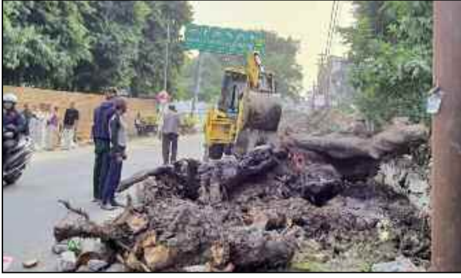
कोटद्वार के बदरीनाथ मार्ग में जिलाधिकारी कैंप कार्यालय के बाहर से पेड़ की टूट हाती जैसीबी

करीब एक वर्ष पूर्व बदरीनाथ मार्ग जिलाधिकारी कैंप आवास के सामने राष्ट्रीय राजमार्ग किनारे खड़ा एक सेमल का भारी वृक्ष जमींदोज हो गया था। एसडीआरएफ, राष्ट्रीय राजमार्ग विभाग व नगर निगम ने संयुक्त रूप से पेड़ की टहनियों को हटाकर राष्ट्रीय राजमार्ग पर यातायात को सुचारु करवाया। लेकिन, राष्ट्रीय राजमार्ग के किनारे आमजन के लिए मुसीबत बन रही पेड़ की टूट को हटाने की सुध किसी ने नहीं ली। नतीजा जिलाधिकारी के कैंप कार्यालय में आने की चर्चा ने बाद सरकारी सिस्टम ने पेड़ को टूट को भी हटा दिया है। जबकि, स्थानीय जनता लगातार टूट को उठाने की मांग करती रही।