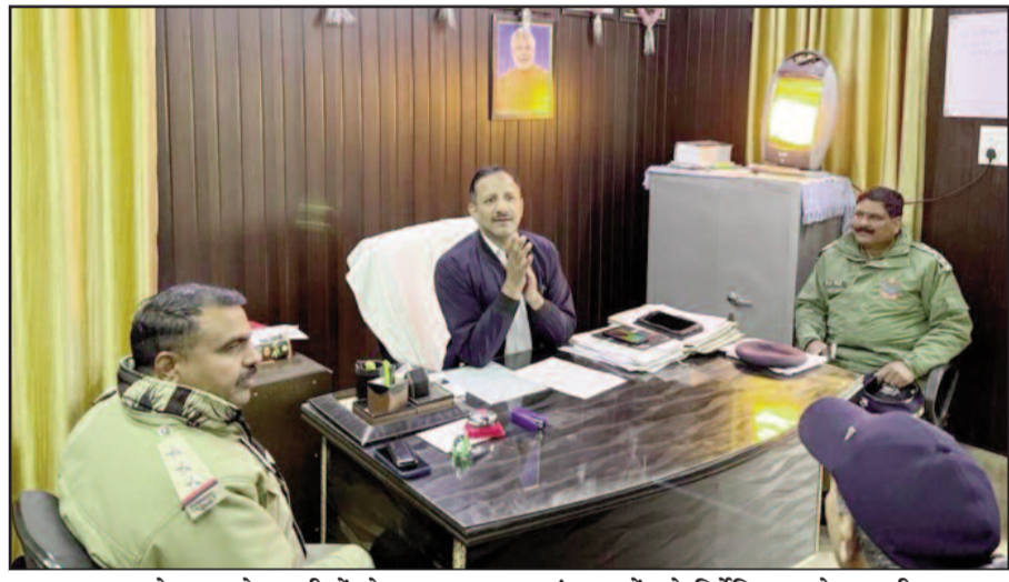
कोटद्वार कोतवाली में होटल व बारातघर संचालकों को निर्देशित करते एसपी।