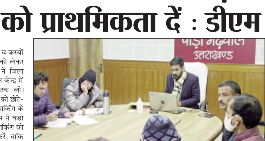
डीएम डॉ. आशीष चौहान पार्किंग परियोजनाओं की समीक्षा करते हुए।

जयन्त प्रतिनिधि। पौड़ी : जनपद के नगर निकायों व कस्बों के अन्तर्गत पार्किंग परियोजनाओं को लेकर जिलाधिकारी डॉ. आशीष चौहान ने जिला कार्यालय स्थित जिला सूचना विज्ञान केन्द्र में निकायों के अधिकारियों की बैठक ली। जिलाधिकारी ने उप जिलाधिकारियों को छोटे-छोटे पॉकेट पार्किंग की जगह बड़ी पार्किंग के प्रस्ताव तैयार करने को कहा। डीएम ने कहा कि पॉकेट पार्किंग की जगह बड़ी पार्किंग को प्राथमिकता देते हुए प्रस्ताव तैयार करें, ताकि वर्तमान व भविष्य की आवश्यकताओं के अनुसार इनका निर्माण हो सके। शुक्रवार को आयोजित जनपद में पार्किंग परियोजनाओं की समीक्षा बैठक में जिलाधिकारी ने कहा कि बड़ी पार्किंग हेतु यदि सरकारी भूमि प्रयाप्त नहीं हो पा रही है तो निजी भूमि को क्रय किये जाने पर विचार करें। उन्होंने नगर निकायों के अधिकारियों को निर्देश दिये कि बजट के अभाव में रुके निर्माण कार्यों को पूरा करने के लिए तत्काल बजट की डिमांड करें। शासन स्तर पर लम्बित पार्किंग की डीपीआर को निरंतर फॉलोअप करते रहे। बैठक में बताया गया कि मुख्यमंत्री