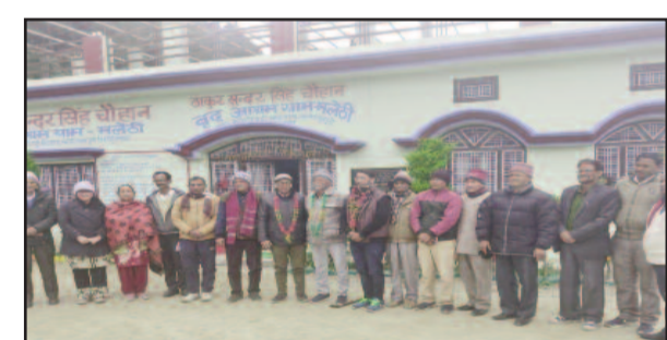
सतपुरी में आयोजित बैठक में भाग लेते सदस्य।