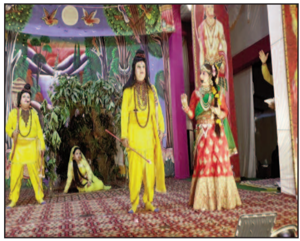
कोटद्वार में आयोजित रामलीला में मंचन करते कलाकार।