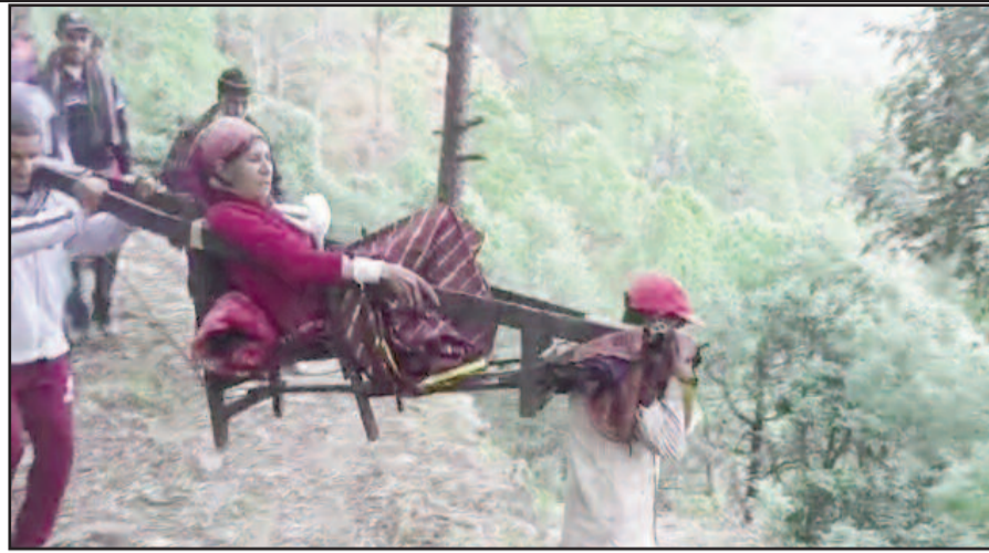
ग्राम चौरखंडा से डोली के सहारे बुजुर्गों को अस्पताल लेकर जाते ग्रामीण।

के लिए तीन किलोमीटर की खड़ी चढ़ाई चढ़नी पड़ती है। जबकि, यह गांव बीरोंखाल ब्लाक से मात्र 25 किलोमीटर की दूरी पर स्थित है। गांव में न तो शिक्षा की सुविधा है और न ही स्वास्थ्य सुविधा। नतीजा पांच वर्ष पूर्व जिस चौरखंडा मल्ला गांव में सी