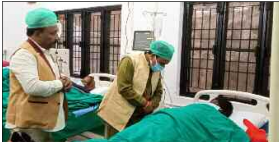
स्वास्थ्य मंत्री डॉ. धन सिंह रावत जिला चिकित्सालय में मरीज से डाइलिसिस के बारे में जानकारी लेते हुए।