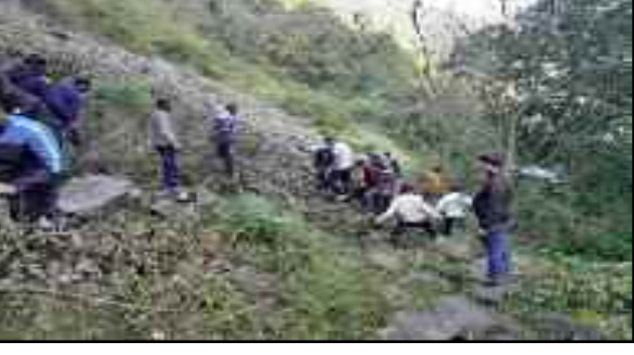
नजीबाबाद बुआखाल राष्ट्रीय राजमार्ग कुल्हाड़-बैरगांव के समीप दुर्घटना के बाद रस्क्यू चलती टीम।