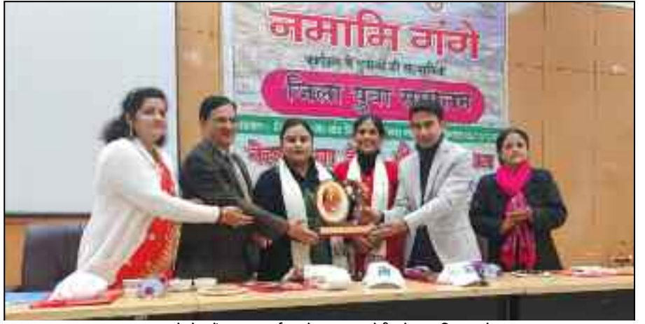
स्वच्छता के क्षेत्र में उत्कृष्ट कार्य करने पर समाजसेवी को सम्मानित करते हुए।