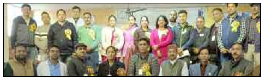
कोटद्वार में आयोजित कार्यक्रम में भाग लेते सदस्य।