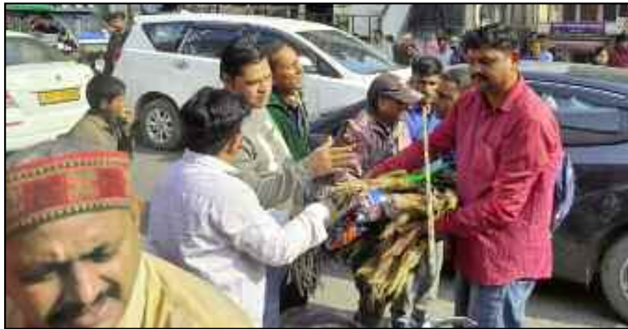
कोटद्वार के नजीबाबाद रोड में दुकान के बाहर लगे सामान को जब्त करती निगम की टीम।

कोटद्वार: अतिक्रमण के खिलाफ पुलिस की ओर से शुरू की गई जंग में नगर निगम ने भी अपना साथ देना शुरू कर दिया है। सोमवार को नगर निगम ने शहर की सड़क पर दुकान सजाने वाले व्यापारियों का सामान जब्त किया। इस दौरान व्यापारी व निगम कर्मियों के बीच छोटे-मोटी झड़प भी देखने को मिली।