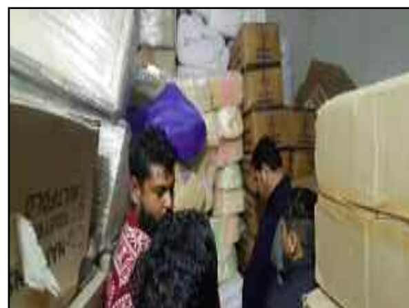
कोटद्वार के जौनपुर में गोदाम में छापेमारी करती निगम की टीम

सोमवार देर शाम पुलिस को सूचना मिली कि जौनपुर स्थित एक गोदाम में भारी मात्रा में पॉलीथिन व सिंगल यूज