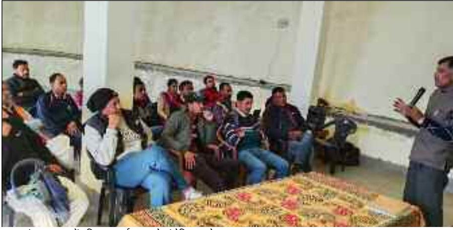
ग्राम डांडा नागराज में प्रशिक्षण कार्यशाला को संबोधित करते हुए वक्ता।