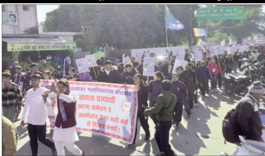
कोटद्वार में शक्ति प्रदर्शन कर जुलूस निकालते एनएसयूआई के प्रत्याशी।

जयन्त प्रतिनिधि। कोटद्वार: छात्रसंघ चुनाव में जीत के लिए छात्र संगठनों ने अपनी पूरी ताकत झोक दी है। गुरुवार को अखिल भारतीय विद्यार्थी परिषद व नेशनल स्टूडेंट यूनियन आफ इंडिया ने ढोल-नगाड़ों के साथ शहर में जुलूस निकालते हुए शक्ति प्रदर्शन किया। इसके उपरांत महाविद्यालय में पहुंचकर प्रत्याशियों ने एक दूसरे पर जमकर निशाना साधा। प्रत्याशियों ने छात्रों से अपने पक्ष में मतदान करने की अपील की। गुरुवार को अखिल भारतीय विद्यार्थी परिषद ने मालगौदाम रोड स्थित लोकनिर्माण विभाग गेस्ट हाउस से जुलूस निकाला। ढोल-नगाड़ों की धुन पर नाचते हुए छात्र अपने प्रत्याशियों के साथ जुलूस के रूप में महाविद्यालय में पहुंचे। अभावविप के जुलूस में भारतीय जनता पार्टी के पदाधिकारी भी चल रहे थे। वहीं, नेशनल स्टूडेंट यूनियन आफ इंडिया ने मालवीय उद्यान से अपने