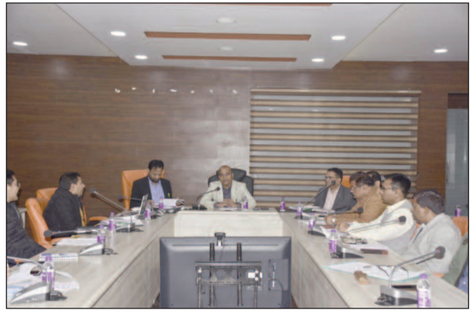
ने राज्य के समस्त जिलाधिकारियों तथा एस0डी0आर0एफ0, वन विभाग, खाद्य आपूर्ति, चिकित्सा, विभाग, पशुपालन विभाग तथा मौसम विभाग, जल संस्थान, कृषि यूपीसीएल के अधिकारियों के

देहरादून। प्रशासन द्वारा शीतलहर से आम जनमानस के बचाव के लिए हर संभव व्यवस्थाएं सुनिश्चित की जा रही है। प्रत्येक जनपद को शीतलहर से बचाव हेतु आवश्यक व्यवस्थाएं उठाने हेतु 10 लाख रुपये का अतिरिक्त बजट दिया जा रहा है।