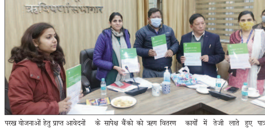
परख योजनाओं हेतु प्राप्त आवेदनों के सापेक्ष बैंकों को ऋण वितरण कार्यों में तेजी लाते हुए पात्र

मुख्यमंत्री स्वरोजगार योजना, शासकीय प्रायोजित योजनाओं, ग्राम स्वरोजगार प्रशिक्षण, राष्ट्रीय ग्रामीण आजीविका, राष्ट्रीय शहरी आजीविका, प्रधानमंत्री स्वनिधि योजना आदि योजनाओं को प्रगति की समीक्षा की गई। इस अवसर पर नाबार्ड की स्मारिका संभाव्यतायुक्त ऋण योजना 2023-24 का विमोचन किया गया। जिलाधिकारी ने बैंकों को संचालित योजनाओं की लक्ष्य के सापेक्ष प्रगति बढ़ाने तथा विभागों एवं बैंकों को आपसी समन्वय करते हुए विभिन्न रोजगार