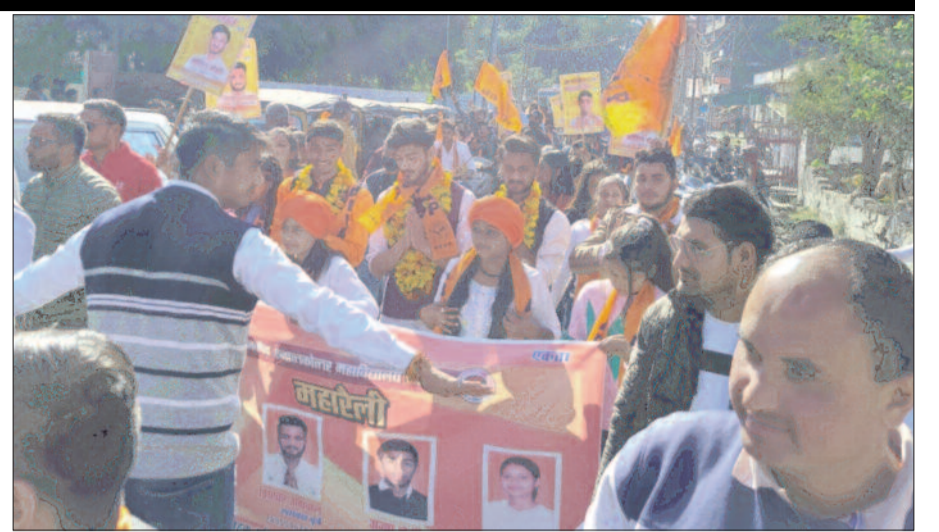
कोटद्वार में शक्ति प्रदर्शन कर जुलूस निकालते अभावविप प्रत्याशी