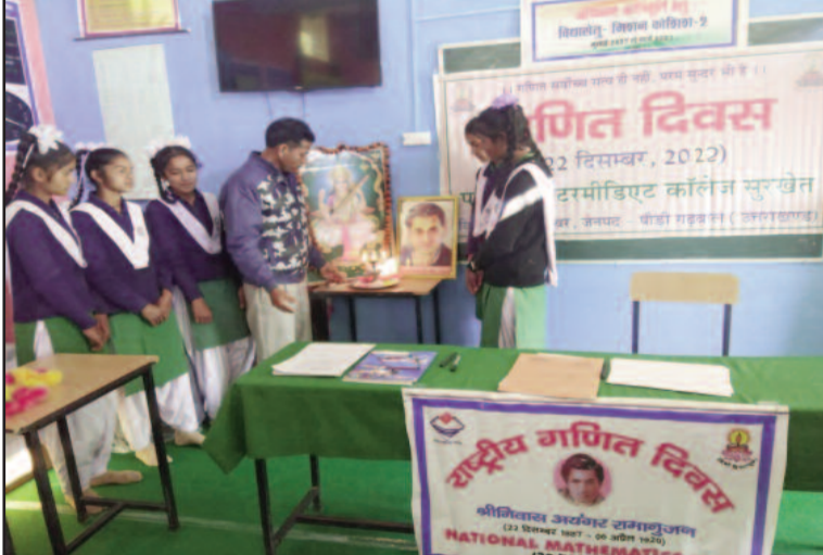
पब्लिक इंटर कालेज सुरखेत में प्रशस्ति पत्र देकर सम्मानित होने वाले विद्यार्थी