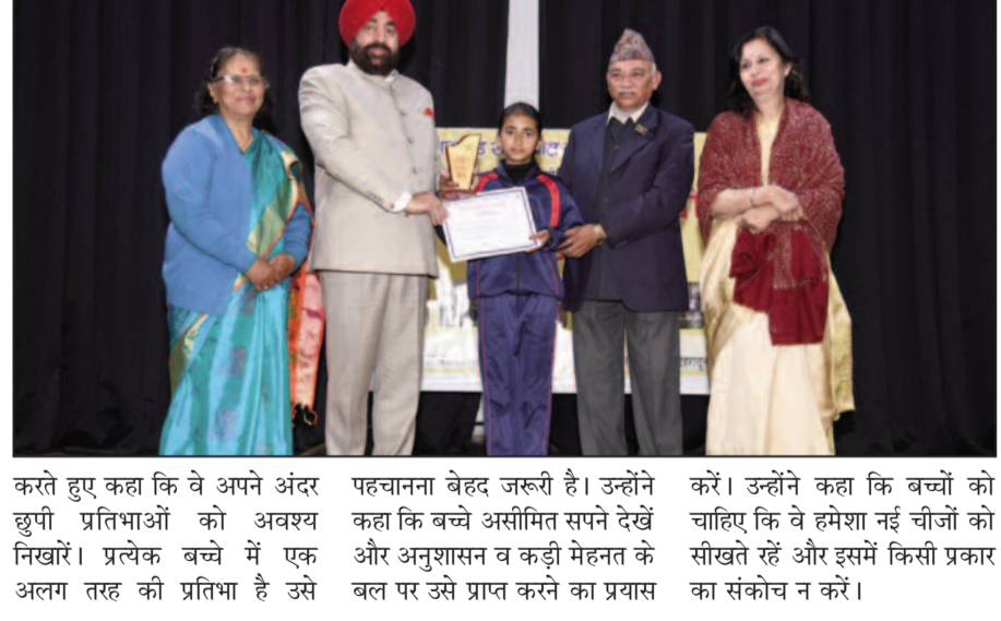
करते हुए कहा कि वे अपने अंदर छुपी प्रतिभाओं को अवश्य निखारें। प्रत्येक बच्चे में एक अलग तरह की प्रतिभा है उसे पहचानना बेहद जरूरी है। उन्होंने कहा कि बच्चे असौमिगत सपने देखें और अनुशासन व कड़ी मेहनत के बल पर उसे प्राप्त करने का प्रयास करें। उन्होंने कहा कि बच्चों को चाहिए कि वे हमेशा नई चीजों को सीखते रहें और इसमें किसी प्रकार का संकोच न करें।

देहरादून। राज्यपाल लेफ्टिनेंट जनरल गुरमीत सिंह (से नि) ने वीरवार को राजभवन ऑडिटोरियम में उत्तराखण्ड बाल कल्याण परिषद् द्वारा आयोजित कार्यक्रम "मिलकर रहना सीखो" में प्रतिभाग किया। इस अवसर पर उन्होंने विभिन्न संघर्षों के विजेता बच्चों को पुरस्कृत किया।