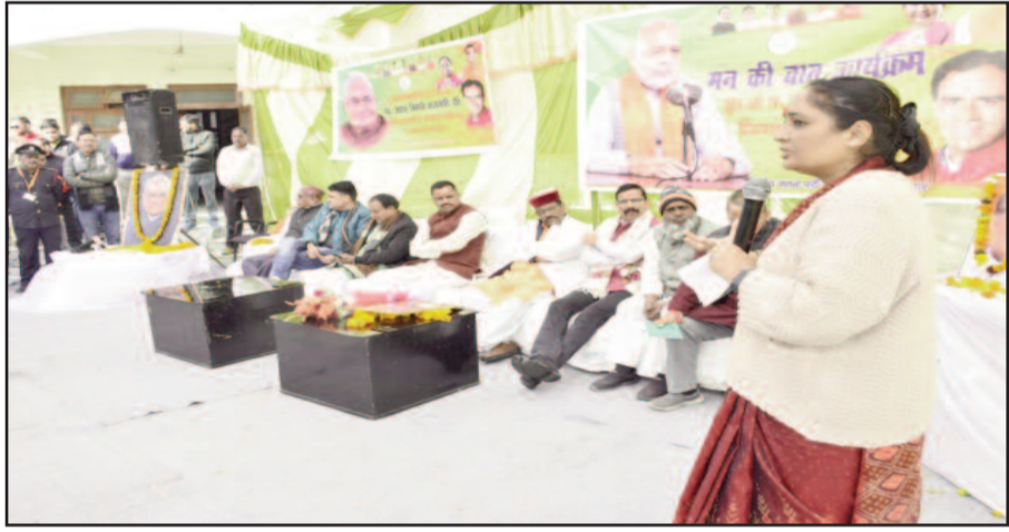
कोटद्वार में स्व.अटल बिहारी वाजपेयी की जयन्ती पर आयोजित कार्यक्रम को संबोधित करती विस अध्यक्ष

विस अध्यक्ष व काबीना मंत्री ने अटल बिहारी वाजपेयी को दी श्रद्धांजलि