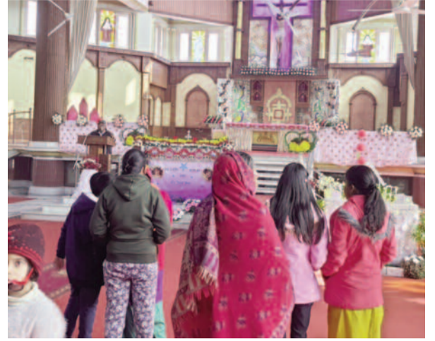
कोटद्वार के महागिरजाघर में प्रार्थना को पहुंचे लोग।