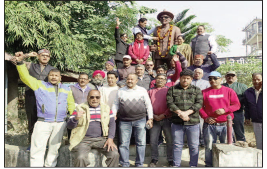
कोटद्वार तहसील में वीर चंद्र सिंह गढ़वाली को श्रद्धांजलि देते कांग्रेसी।