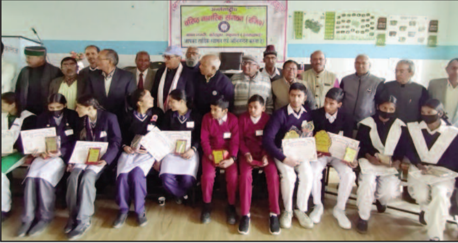
कोटद्वार में प्रतियोगिता के अव्वल विद्यार्थियों को पुरस्कृत करते संगठन के सदस्य।