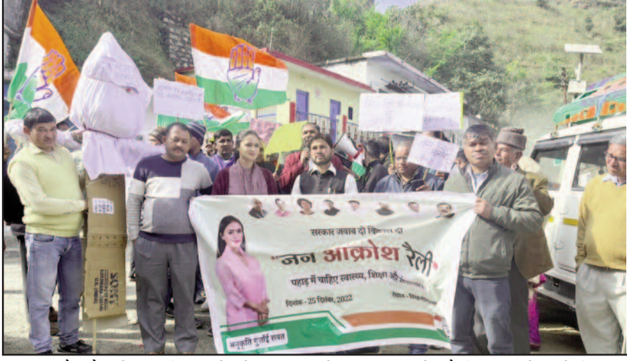
लैसडाउन के रिखणीखाल में प्रदेश सरकार के खिलाफ आक्रोश रैली निकालते कांग्रेसी।