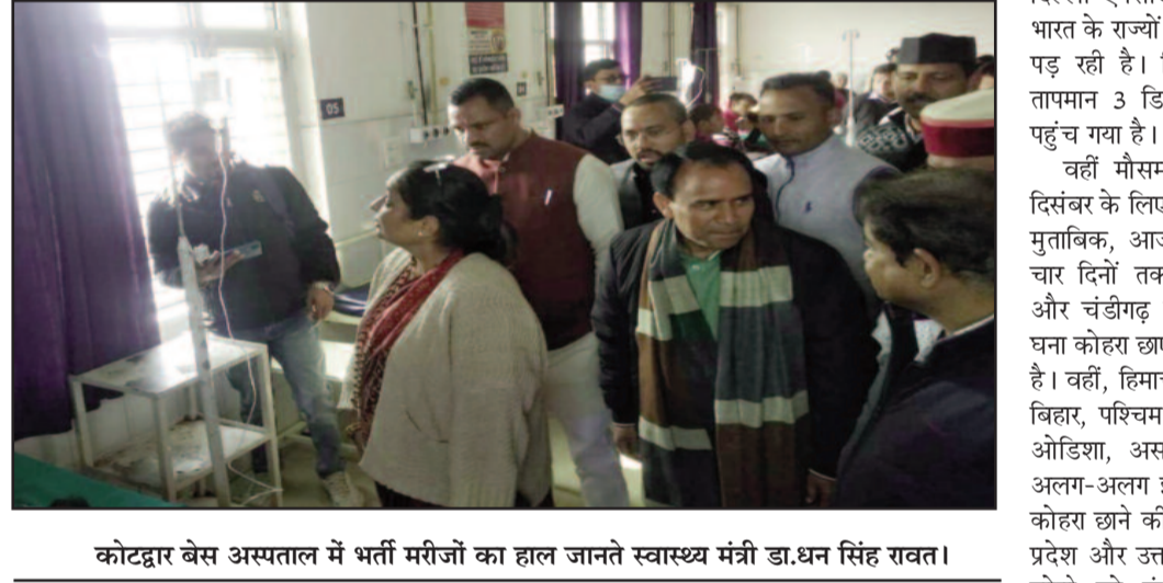
कोटद्वार बेस अस्पताल में भर्ती मरीजों का हाल जानते स्वास्थ्य मंत्री डा. धन सिंह रावत।

जयन्त प्रतिनिधि। कोटद्वार: स्वास्थ्य मंत्री डॉ. धन सिंह रावत ने राजकीय बेस चिकित्सालय कोटद्वार का निरीक्षण करते हुए चिकित्सकों से व्यवस्थाओं के बारे में जानकारी ली। कहा कि सरकार अस्पतालों में बेहतर स्वास्थ्य सेवाएं उपलब्ध करवाने के हर संभव प्रयास कर रही है। सुविधाओं के आगे धन की कमी को आड़े नहीं आने दिया जाएगा। कहा कि किसी भी मरीज को हायर सेंटर रेफर करने से पूर्व चिकित्सकों को उसका कारण बताया होगा।