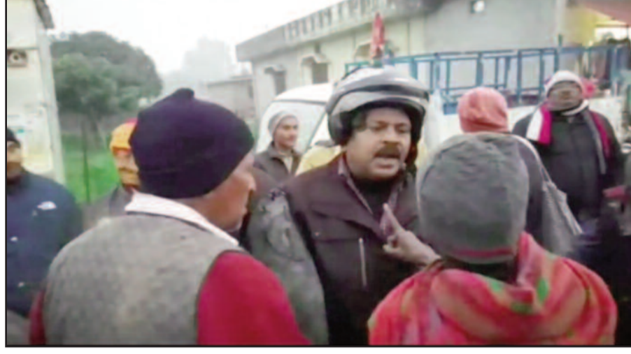
झंडीचौड़ में तहबाजारी क रसीद के लिए निगम कर्मियों का विरोध करते दुकानदार

नियमानुसार, नगर निगम बाजार में लगने वाली रेहड़ी-