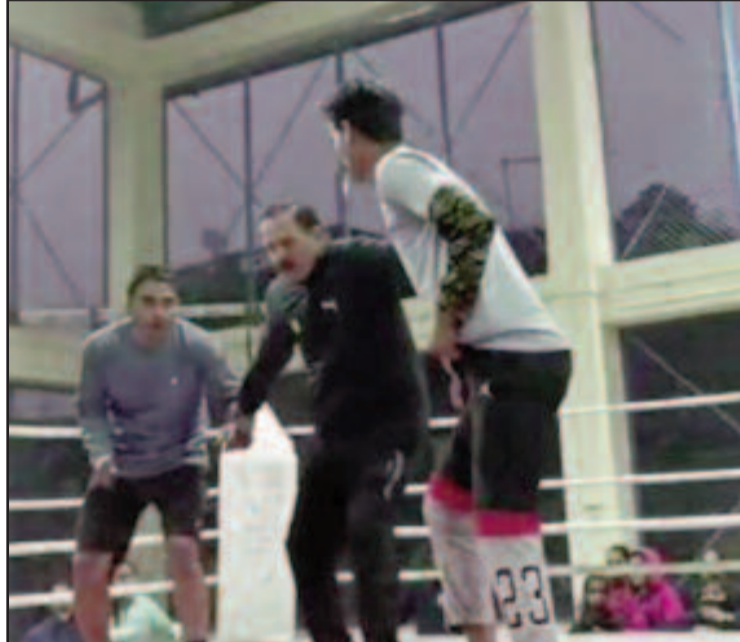
कोटद्वार स्टेडियम में ताइक्वांडो प्रतियोगिता में प्रतिभाग करते खिलाड़ी