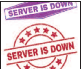
इंटरनेट से ली गई सर्वर डाउन की तस्वीर

कोटद्वार के बदरीनाथ मार्ग स्थित मुख्य डाघर घर में भारत संचार निगम लिमिटेड का सर्वर लगाया गया है। लेकिन, आए दिन बीएसएलएल का यह सर्वर उपभोक्ताओं के साथ ही डाक घर कर्मियों को धोखा दे रहा है। ऐसे में डाकघर में आने वाले उपभोक्ताओं को समस्याओं का सामना करना पड़ रहा है। कई