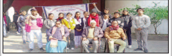
महाविद्यालय में आयोजित नुक्कड़ नाटक में भाग लेते शिक्षक व अन्य।