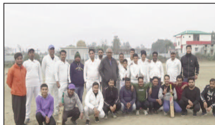
आयोजित क्रिकेट प्रतियोगिता में प्रतिभाग करते हुए खिलाड़ी।