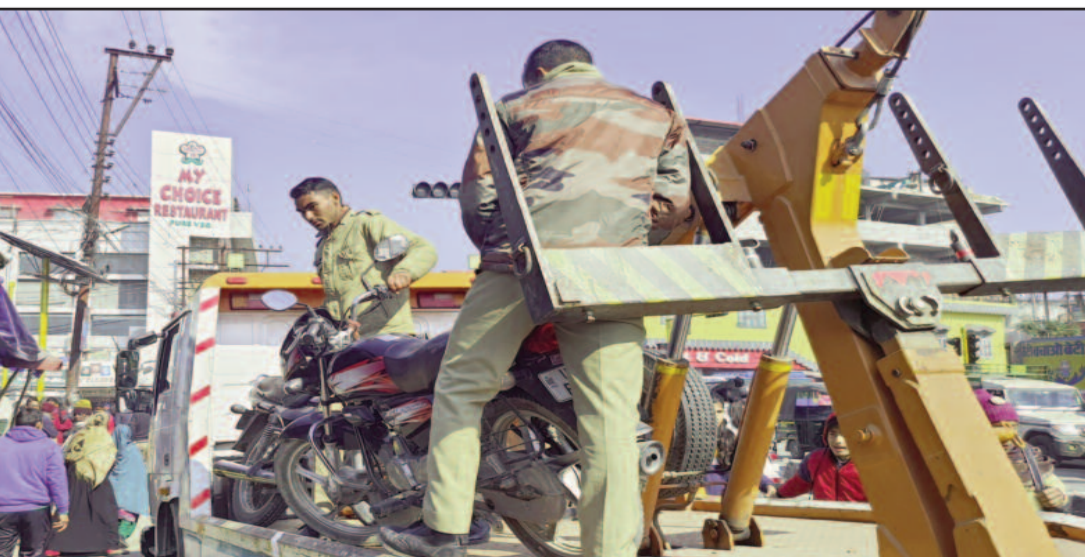
कोटद्वार के नजीबाबाद रोड में सड़क किनारे बेतरतीब खड़े वाहनों को सीज करती यातायात पुलिस

शहर में यातायात व्यवस्था लगातार बेपटरी होती जा रही है। कुछ सप्ताह से शहर में लगातार जाम की स्थिति बन रही थी। सड़क किनारे बेतरतीब तरीके से खड़े वाहन जाम का मुख्य कारण बन रहे थे। ऐसे में सोमवार को यातायात पुलिस ने सड़क पर उतरकर बेतरतीब तरीके से खड़े वाहनों के खिलाफ कार्रवाई शुरू कर दी है। सड़क किनारे सफेद पट्टी के बाहर खड़े दस से अधिक वाहनों को कोतवाली में लाकर सीज किया गया। हालांकि वाहन चालकों ने पुलिस को इस कार्रवाई का विरोध भी किया।