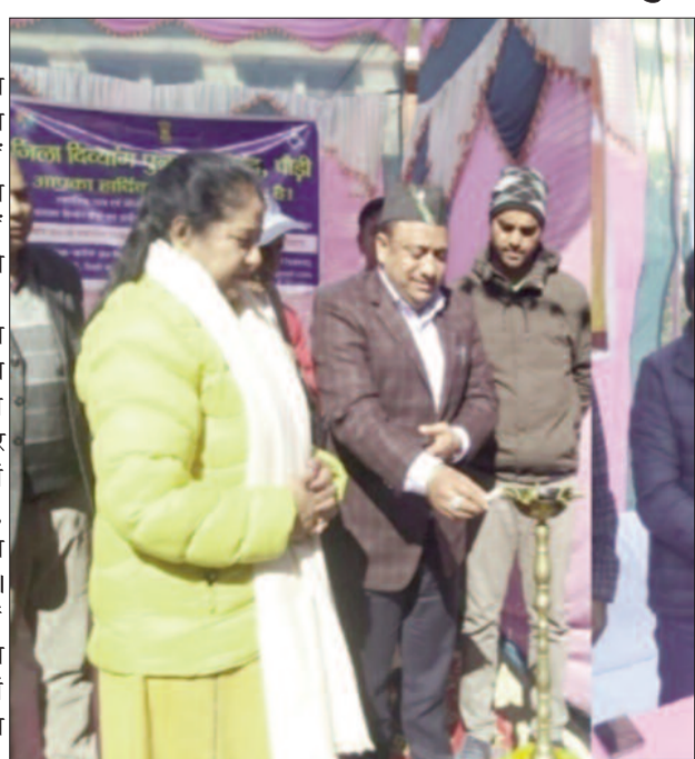
दीप प्रज्वलित कर शिविर का शुभारंभ करती विधायक व ब्लाक प्रमुख मौजूद रहे।

जयन्त प्रतिनिधि। कोटद्वार : द्वारीखाल विकास खंड मुख्यालय में आयोजित शिविर में दर्ज 52 शिकायतों में से 18 का मौके पर ही निस्तारण किया गया। इस दौरान शिविर में चिकित्सकों ने दिव्यांगों को प्रमाण पत्र भी जारी किए।