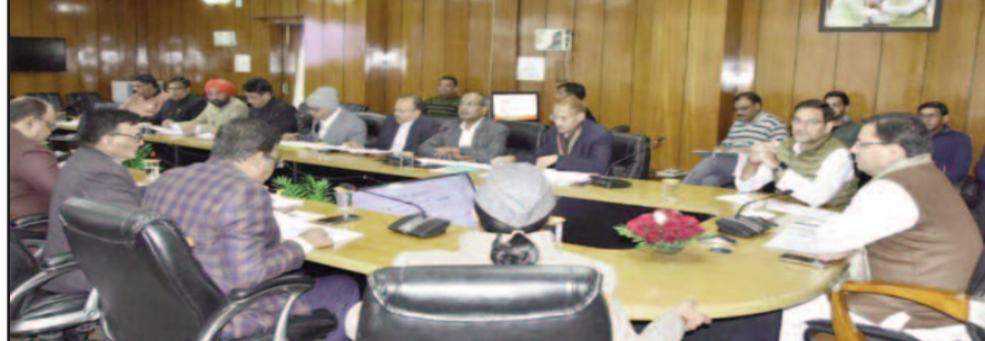
मुख्यमंत्री पुष्कर सिंह धामी सचिवालय में गन्ना विभाग की समीक्षा करते हुए।

गन्ने की हाई वैरायटी के उत्पादन पर अधिक फोकस किया जाए। चीनी मिलों अपनी आय के संसाधन बढ़ाने एवं आत्मनिर्भरता की ओर बढ़ने का प्रयास करें। मुख्यमंत्री पुष्कर सिंह धामी ने कहा कि चीनी मिलों के आधुनिकीकरण की दिशा में ध्यान दिये जाने की आवश्यकता है। प्राथमिकता के आधार पर बाँयलर एवं टरबाइन परिवर्तन के