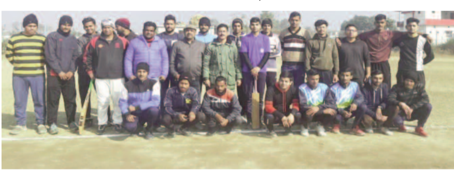
क्रिकेट टूर्नामेंट में प्रतिभाग करने पहुंची टीम।

ऑल राउंडर की टीम ने निर्धारित दस ओवरों में 35 रन पर ऑल आउट करने के बाद तीसरे ओवर में ही लक्ष्य प्राप्त कर ली। दूसरे मुकाबले में एमसीसी मोटाढाक पहले