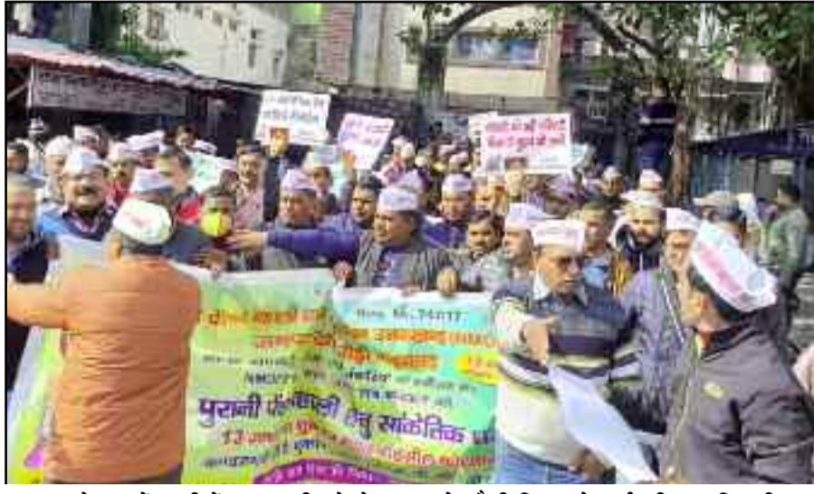
कोटद्वार में पुरानी पेंशन बहाली को लेकर आक्रोश रैली निकालते कर्मचारी व अधिकारी।

माध्यम से मुख्यमंत्री को ज्ञापन भेजा। कर्मचारियों ने कहा कि नई पेंशन योजना में जो कर्मचारी सेवानिवृत्त हो रहे हैं उनकी पेंशन तीन से चार हजार के करीब बन रही है। नई पेंशन योजना किसी भी तरह से कर्मचारियों के हित में नहीं है। इतनी कम पेंशन में सेवानिवृत्ति के बाद कर्मचारियों को आर्थिक परेशानी का सामना करना पड़ेगा। कहा कि वर्तमान