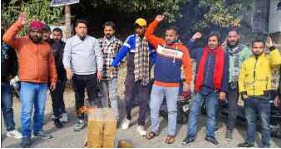
कोटद्वार में प्रदेश सरकार का पुतला दहन करते यूथ कांग्रेस कार्यकर्ता।

कोटद्वार : यूथ कांग्रेस कार्यकर्ताओं ने पटवारी लेखपाल भर्ती परीक्षा का पेपर लीक होने पर प्रदेश सरकार का पुतला दहन किया। कहा कि जब से प्रदेश में भाजपा सरकार बनी है तब से पेपर लीक होना आम बात हो गई है। यूथ कांग्रेस ने सभी भर्ती चोटलों की सीबीआई जांच करवाने की मांग की है। कहा कि प्रदेश के युवाओं का शोषण किसी भी हाल में बर्दाश नहीं की जाएगी।