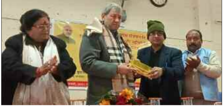
सांसद गढ़वाल तीरथ सिंह रावत पुस्तक वितरित करते हुए।

पौड़ी : राजकीय इंटर कॉलेज पौड़ी में शुक्रवार को सांसद स्थानीय क्षेत्र विकास योजना के अंतर्गत राष्ट्रभाषा हिन्दी के विकास और बढ़ावा देने हेतु पुस्तक वितरण सम्मान समारोह का आयोजन किया गया। सांसद ने कहा कि विद्यालय में आने वाले छात्र-छात्राओं को एक गुरू ही अच्छे संस्कार देता है। वर्तमान में सरकार द्वारा सरकारी स्कूलों में हर तरह की सुविधा दी जा रही है। उन्होंने यहां उपस्थित सभी अध्यापकों को कहा कि विद्यालय में पठन-पाठन को लेकर कैसे माहौल बनाना है उसके लिए विशेष तैयारी करें, जिससे बच्चों को भविष्य के लिए तैयार किया जा सकेगा।