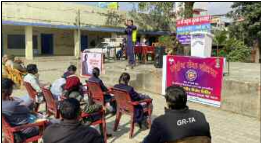
राजकीय इंटर कॉलेज कोटद्वार में स्वयं सेवियों को यातायात के प्रति जागरूक करती यातायात पुलिस

रैली मालवीय उद्यान से बदरीनाथ मार्ग, झंडाचौक, नजीबाबाद रोड, बालासौड़, देवी रोड होते हुए गढ़वाल टंकी के