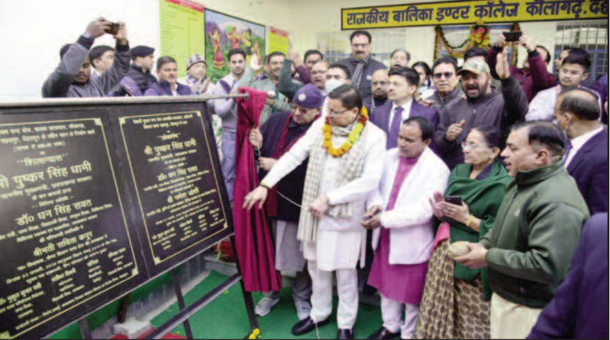
मुख्यमंत्री पुष्कर सिंह धामी जीजीआईसी कौलागढ़ के नव निर्मित भवन का किया लोकार्पण करते हुए।

आवासीय छात्रावास बनाने की आवश्यकता होगी, इस दिशा में तेजी से प्रयास किये जायेंगे। उन्होंने कहा कि देश आजादी के अमृत महोत्सव में प्रवेश कर गया है। आने वाले 25 साल भारत के लिए बहुत महत्वपूर्ण हैं। हमारे नैनबाल भारत का भविष्य हैं। इनको अच्छी शिक्षा और संस्कार मिले यह हम सबकी सामूहिक जिम्मेदारी है। उन्होंने कहा कि भारत 2023 में जी 20 शिखर सम्मेलन की अध्यक्षता कर रहा है। यह देश के लिए 'लोकल फॉर ग्लोबल' को बढ़ावा देने का अच्छा अवसर है। भारत के प्रस्ताव पर संयुक्त राष्ट्र महासभा ने वर्ष 2023 को अन्तरराष्ट्रीय मिलेट वर्ष भी