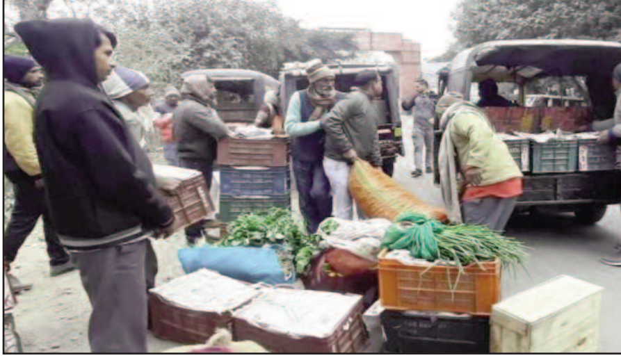
कोटद्वार के कौड़िया चैक पोस्ट पर नजीबाबाद मंडी से सब्जी लेकर पहुंचे विक्रेता।

सरकारी की ओर से कोटद्वार के खुनीबड़ में कृषि मंडी का निर्माण करवाया गया है। बावजूद इसके सब्जी विक्रेता कोटद्वार मंडी से सब्जी खरीदने के बजाय नजीबाबाद मंडी से सब्जी लेकर आते हैं। ऐसे में कोटद्वार कृषि मंडी को आर्थिक नुकसान झेलना पड़ रहा है। सोमवार सुबह कौड़िया चैक पोस्ट पर पहुंचे कृषि मंडी के कर्मचारी व अधिकारियों ने नजीबाबाद से सब्जी लेकर आ रहे वाहनों को रूकवाते हुए सब्जी