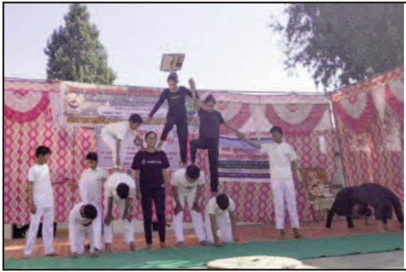
इंटर कालेज बल्ली में योग की प्रस्तुति देते विद्यार्थी।