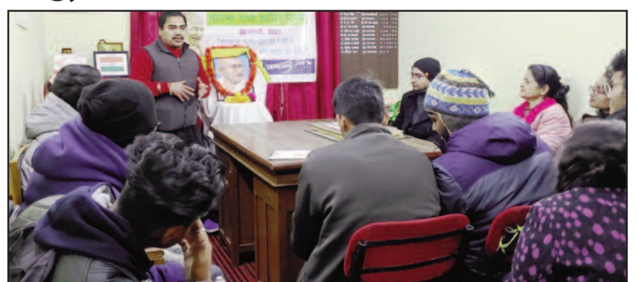
पौड़ी में आयोजित गोष्ठी में अपने विचार रखते वक्ता।