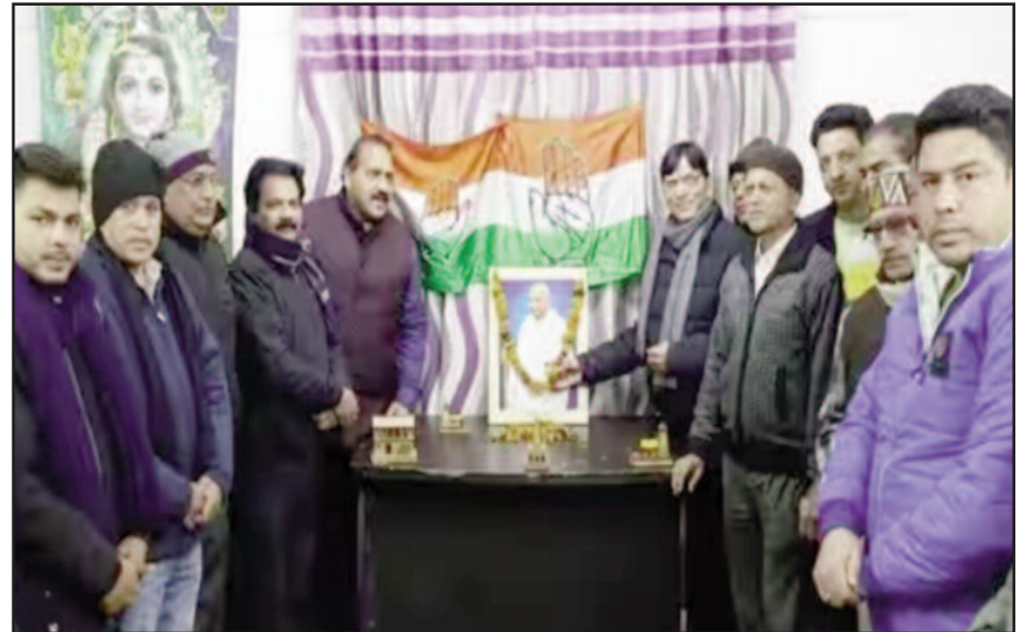
पुण्यतिथि पर महात्मा गांधी को श्रद्धांजलि देते कांग्रेसी