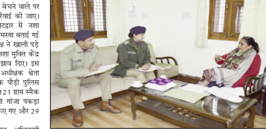
कोटद्वार में पुलिस अधिकारियों की बैठक लेते विस अध्यक्ष।