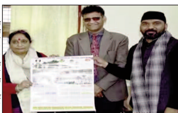
कोटद्वार में कॉलेज के वार्षिक कैलेंडर का शुभारंभ करती विस अध्यक्ष