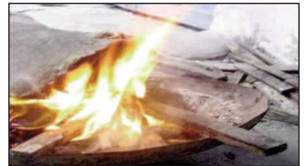
कोटद्वार में ठंड से बचाव के लिए जलाया गया अलाव