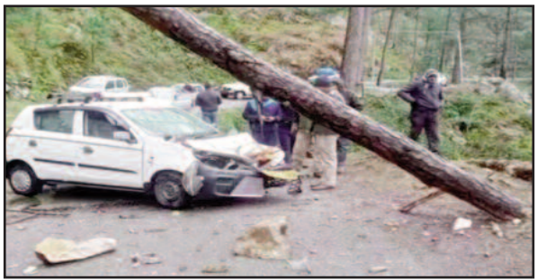
पेड़ गिरने के बाद क्षतिग्रस्त स्थिति में खड़ी कार

पौड़ी : पौड़ी-बुआखाल-रामनगर राष्ट्रीय राजमार्ग पर चोपडियू के समीप एक कार पर पेड़ गिर गया। कार पौड़ी से एसबीआई का कैश लेकर चाकोसैण जा रही थी। हादसे में तीन लोग घायल हुए हैं।