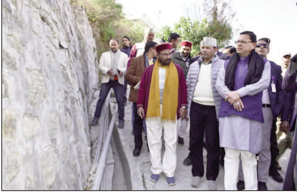
मुख्यमंत्री पुष्कर सिंह धामी जोशीमठ में भू-धसाव को लेकर अधिकारियों से जानकारी लेते हुए।

मुख्यमंत्री ने कहा कि संकट की इस स्थिति में जानमाल की सुरक्षा हमारी सबसे पहली प्राथमिकता है। भू-धसाव से प्रभावित संकटग्रस्त परिवारों के पुनर्वास की वैकल्पिक व्यवस्था की जा रही है। भू-धसाव रोकने के लिये तात्कालिक तथा दीर्घकालिक कार्य योजना पर गंभीरता से कार्य किया जा रहा है। खतरे की जद में आए पूरे शहर में सुरक्षात्मक कार्य कराए जाएंगे। जिसके लिए विस्तृत प्लान तैयार किया जा रहा है। शहर की सुरक्षा के लिए सीवर एवं ड्रेनेज जैसे कार्य को जल्द से जल्द ही कराया जाएगा। आईटीवीपी अतिथि गृह में जनप्रतिनिधियों,