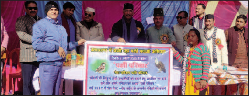
पक्षियों के संरक्षण के लिए शुरू की गई पहल का शुभारंभ करते अतिथि।

पक्षियों के संरक्षण के लिए शिक्षक ने शुरू की पहल