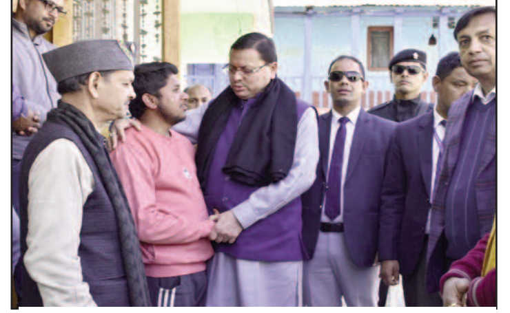
मुख्यमंत्री पुष्कर सिंह धामी जोशीमठ में प्रभावित से वार्ता करते हुए।

को निर्देश दिये कि जोशीमठ में सेक्टर जगह तलाशी जाए। सहायता शिविरों में सभी जरूरी सुविधाएं हों। सभी विभाग टीम भावना से काम करे तभी हम लोगों की बेहतर ढंग से मदद करने में सफल