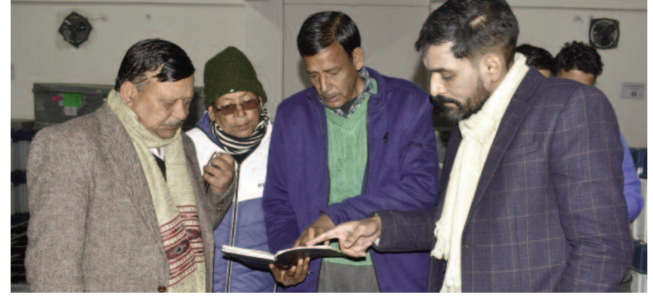
वेयर हाउस के बारे में जानकारी लेते हुए जिलाधिकारी डॉ. आशीष चौहान।

पौड़ी : जिला निर्वाचन अधिकारी/मजिस्ट्रेट डॉ. आशीष चौहान ने राजनैतिक दलों के प्रतिनिधियों की उपस्थिति में ईवीएम बेयर हाउस का त्रैमासिक निरीक्षण किया। जिलाधिकारी ने सुरक्षा को देखते हुए डबल लॉक सिस्टम, सीसीटीवी कैमरे, सशस्त्र बल की तैनाती, अनिशमन उपकरणों को परखा। उन्होंने सम्बंधित अधिकारी को निर्देशित किया कि वेयर हाउस में फिनिशिंग कार्य को पूर्ण करते हुए निर्वाचन कार्यालय को भवन हस्तांतरण करना सुनिश्चित करें। उन्होंने वहां तैनात फोर्स को समय-समय पर अनिशमन उपकरणों का निरीक्षण करने के निर्देश भी दिए। शुक्रवार देर सांय को जिलाधिकारी ने इलेक्ट्रॉनिक्स