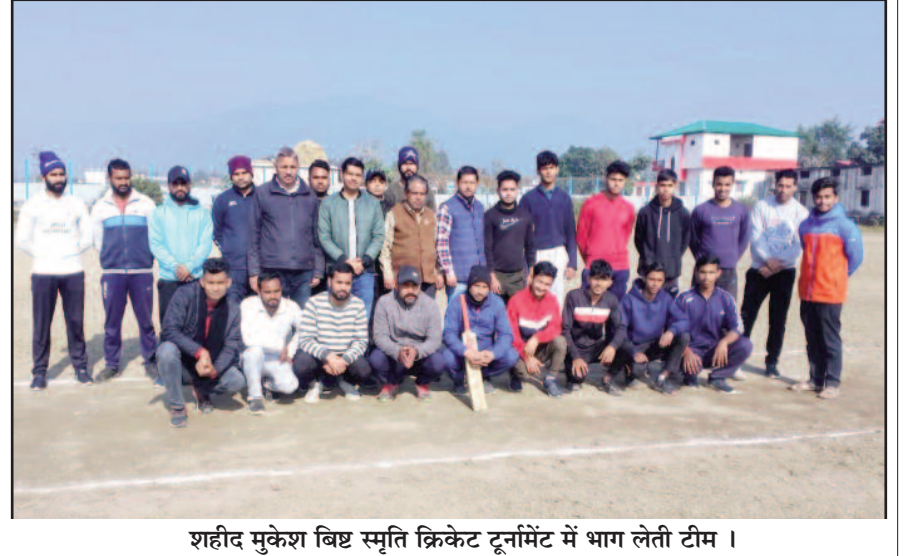
शहीद मुकेश बिष्ट स्मृति क्रिकेट टूर्नामेंट में भाग लेती टीम।