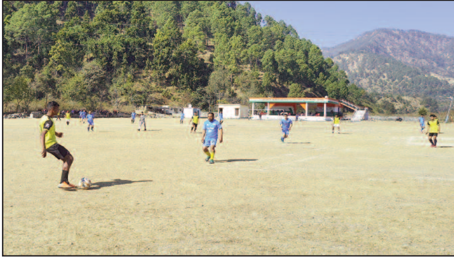
डाडामंडी में आयोजित प्रतियोगिता में गोल के लिए जूझते खिलाड़ी।

डाडामंडी गेंद मेला समिति की ओर से आयोजित की गई फुटबाल प्रतियोगिता