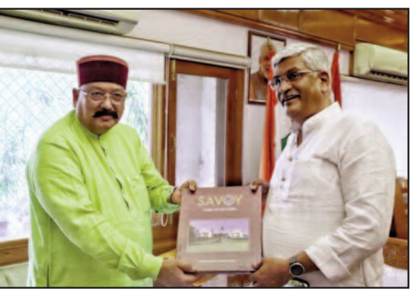
केंद्रीय जल शक्ति मंत्री गजेंद्र सिंह शेखावत को पुस्तक सौंपते हुए कैबिनेट मंत्री सतपाल महाराज।

प्रदेश के कैबिनेट मंत्री सतपाल महाराज ने जोशीमठ शहर में मकानों और होटलों में आ रही दरारों व भू-धसाव की चिन्ताजनक स्थिति को लेकर शनिवार को केंद्रीय जल शक्ति मंत्री गजेंद्र सिंह शेखावत से बातचीत कर मौके पर एक जांच दल भेजने का अनुरोध किया जिसे उन्होंने सहर्ष स्वीकार कर तुरंत जोशीमठ के लिए जांच दल को रवाना भी कर दिया है। इसके लिए महाराज ने केंद्रीय मंत्री का आभार व्यक्त किया है। बातचीत के दौरान केंद्रीय जल