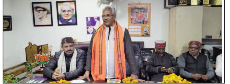
कोटद्वार में कार्यकर्ताओं को संबोधित करते पूर्व मुख्यमंत्री त्रिवेन्द्र सिंह रावत

हैं, तो लाठीचार्ज तो होगा ही। लाठी चार्ज के आरोप तो लगते रहते हैं, लेकिन छात्र इस तरह का विरोध करते रहे तो परीक्षाएं रद्द कर दी जानी चाहिए। बीएसएससी द्वारा आयोजित क्लर्क ग्रेड की लिखित परीक्षा का पेपर लीक हुआ था, जिसे लेकर पटना में बीएसएससी की तीनों पालियों की परीक्षा रद्द करने की मांग को लेकर अभ्यर्थी राज्य सरकार के खिलाफ प्रदर्शन कर रहे थे। इस दौरान अभ्यर्थियों पर बिहार पुलिस ने बुधवार को लाठी चार्ज किया था। पेपर लीक होने के बाद से ही छात्र परीक्षा रद्द करने की मांग कर रहे थे।