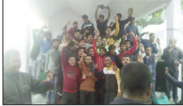
जीत के बाद गिंदी दिखाते मनियारस्यू की टीम।