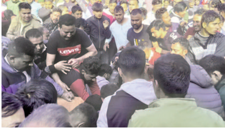
डाडामंडी गेंद मेले में जीत के लिए जूझते ग्रामीण।

जयन्त प्रतिनिधि कोटद्वार: मकर संक्रांति के अवसर पर डाडामंडी में आयोजित गेंद मेला धूमधाम से मनाया गया। गिंदी के खेल में लंगूर पट्टी तथा भटपुड़ी के बीच हुई जोर आजमाइश में लंगूर पट्टी के खिलाड़ी करीब चार घंटे की मशक्कत के बाद गेंद को अपनी सीमा में ले जाने में कामयाब रहे। मेले में लोगों की खूब भीड़ उमड़ी। रविवार को विकासखंड द्वारिखाल के डाडामंडी में आयोजित गेंद मेले के अवसर पर सुबह गेंद की पूजा अर्चना की गई। इसके बाद ध्वज के साथ भटपुड़ी व लंगूरी की टीमों के खिलाड़ी गेंद को अपने जीत स्थल तक पहुंचाने के लिए