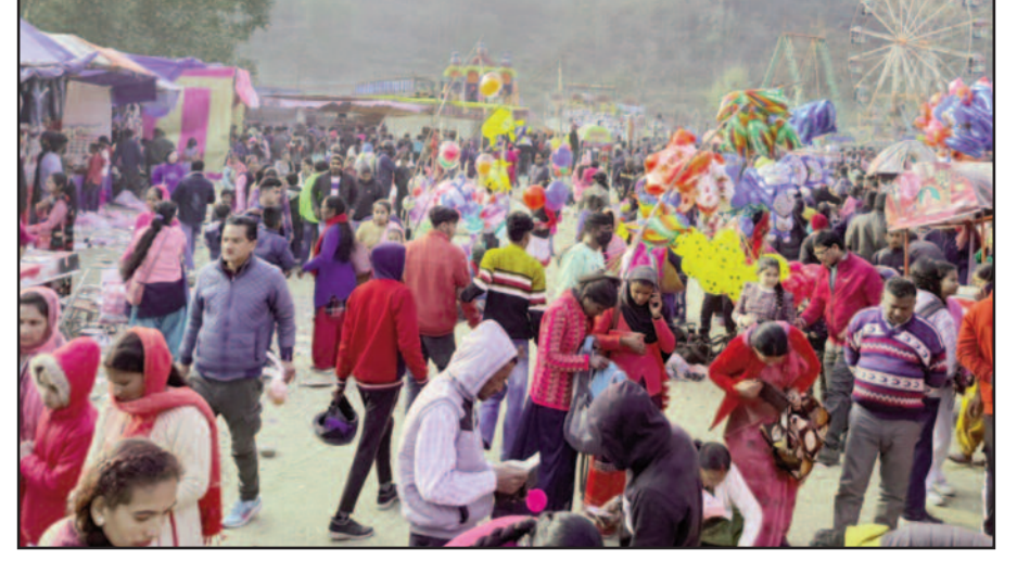
डाडामंडी गेंद मेले में सजी दुकानें।

जूझते रहे। इस बीच लंगूरी के खिलाड़ियों ने गेंद को कब्जे में