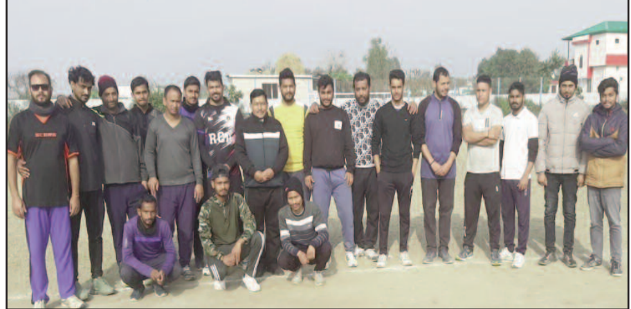
क्रिकेटी मैच में प्रतिभाग करने पहुंची टीम

जयन्त प्रतिनिधि। कोटद्वार: शहीद मुकेश बिष्ट मेमोरियल क्रिकेट टूर्नामेंट सीजन -6 के अंतिम क्वाटर फाइनल मुकाबला सिगडूी सुपर किंग्स बनाम मोटाढांक क्रिकेट क्लब खेला गया। जिसमें सिगडूी की टीम ने पहले बल्ले बाजी करते हुए दस ओवरों में 75 रनों का लक्ष्य दिया। लक्ष्य पीछा करते हुए मोटाढांक ने पांच विकेट शेष रहते सेमीफाइनल में अपनी जगह सुनिश्चित करी। पहला सेमीफाइनल मुकाबला शिव आर्ट्स बनाम ऑलराउंडर 7 खेला गया जिसमें टॉस जीत ऑलराउंडर 7 ने पहले गेंदबाजी करने का फैसला करते हुए शिव आर्ट्स को निर्धारित 10 ओवरों में 65 रनों पर रोका। लक्ष्य का पीछा करते ऑलराउंडर सेवन की टीम ने 7 विकेट शेष रहते सातवें ओवर में लक्ष्य प्राप्त कर ली।