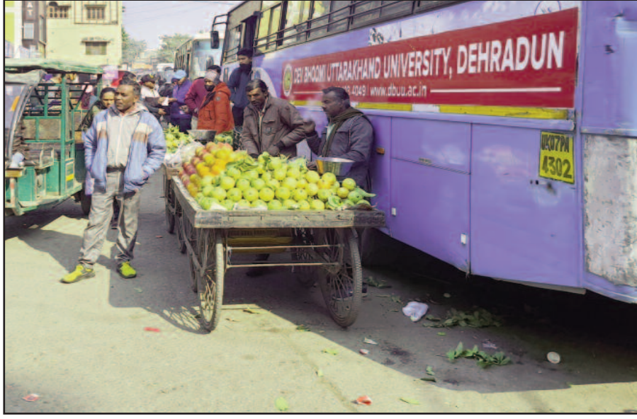
कोटद्वार के स्टेशन रोड में बेतरतीब तरीके से सड़क पर लगी रेहड़ी-ठेली

शुरू कर दिया। चौकाने वाली बात तो यह है कि पुलिस का पूरा ध्यान केवल गोखले मार्ग को रेहड़ी-ठेली व फड़ वालों से मुक्त करना है। जबकि, राष्ट्रीय राजमार्ग व अन्य मुख्य सड़कों पर हलात लगातार बिगड़ते जा