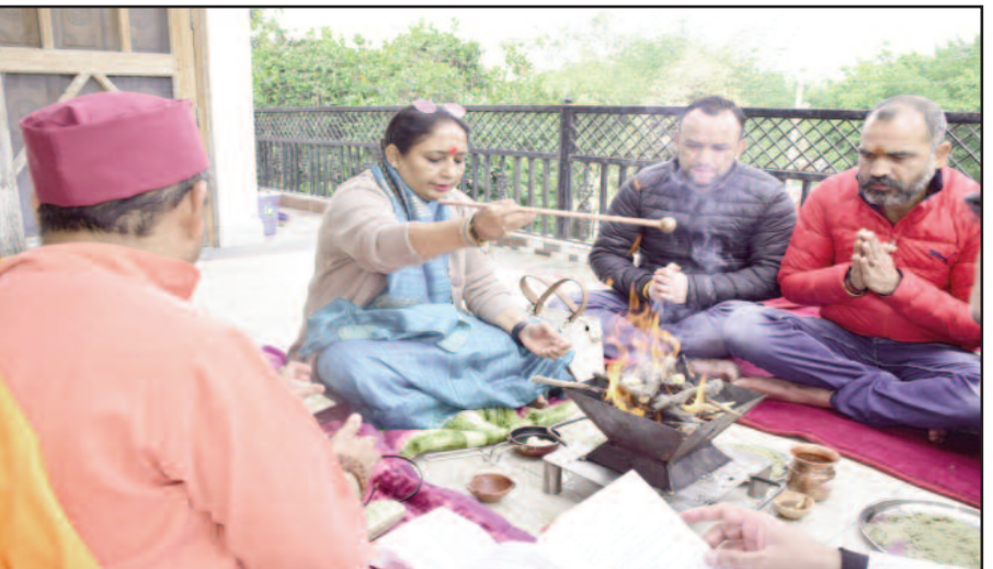
जन्म दिवस पर हवन करती विस अध्यक्ष।

कोटद्वार: भाजपा पदाधिकारियों और कार्यकर्ताओं की ओर से कोटद्वार विधान सभा विधायक और उत्तराखंड विधान सभा की प्रथम महिला अध्यक्ष ऋतु खंडूड़ी भूषण का जन्मदिवस धूमधाम से मनाया गया। इस दौरान कार्यकर्ताओं ने उनकी लंबी उम्र की कामना की। सर्वप्रथम विधान सभा अध्यक्ष ने नैबूचौड़ स्थित अपने निजी आवास पर जन्मदिन पूजन किया। तत्पश्चात उन्होंने सिद्ध पीठ बाबा सिद्धबली मंदिर में पूजा अर्चना कर प्रदेशवासियों के सुख समृद्धि की कामना की। झण्डाचौक स्थित अपने कैंप कार्यालय में विधानसभा अध्यक्ष ने अपने समर्थकों और कार्यकर्ताओं के साथ प्रधानमंत्री नरेंद्र मोदी के मन की बात कार्यक्रम के 97 वे संस्करण को सुना। मन की बात कार्यक्रम के पश्चात कैंप कार्यालय में ही उनका जन्मदिवस केक काट कर धूमधाम से मनाया