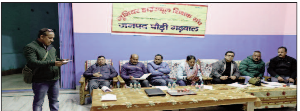
सतपुली में आयोजित बैठक में भाग लेते शिक्षक।