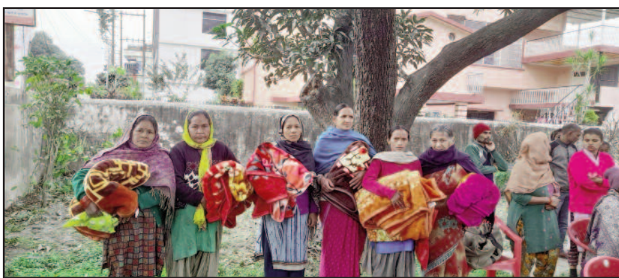
महिलाओं को कंबल देते संगठन के सदस्य