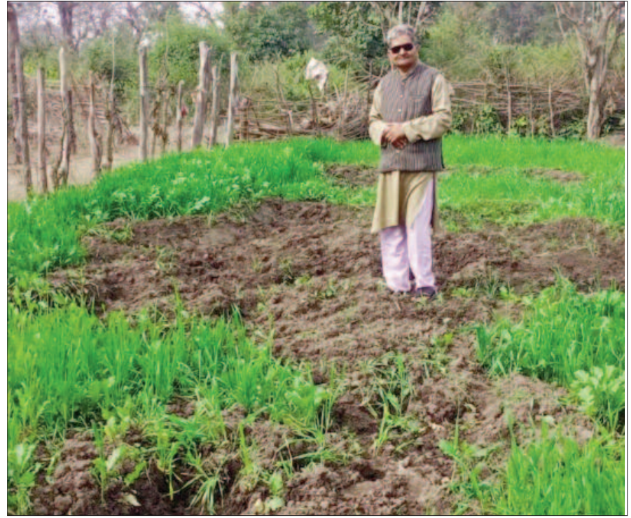
कोटद्वार नगर निगम के अंतर्गत पश्चिमी झंडीचौड़ में हाथियों द्वारा रौंदी गई काश्तकारों की फसल

कहा कि आए दिन फसल बर्बाद होने से काश्तकारों को आर्थिक नुकसान झेलना पड़ रहा है। वहीं, शिकायत के बाद पहुंचे वन विभाग के रेंजर अजय ध्यानी ने काश्तकारों को क्षेत्र में रात्रि गश्त बढ़ाने का आश्वासन दिया है। कहा कि काश्तकारों को फसल के नुकसान का भी मुआवजा दिया जाएगा।