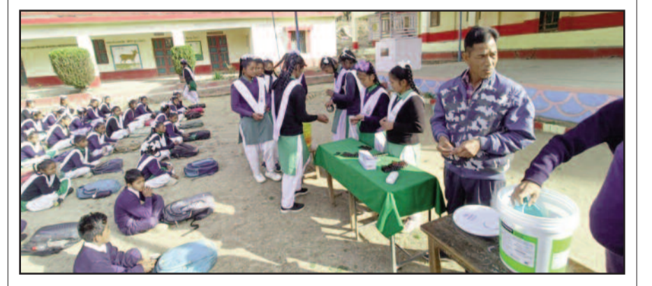
विद्यालय में विद्यार्थियों को एनीमिया की दवा देते शिक्षक

जयन्त प्रतिनिधि। कोटद्वार : एनीमिया मुक्त भारत अभियान के तहत राजकीय इंटर कालेज सुरखेत के 218 छात्र-छात्राओं को आयरन फेलिक एसिड दवा खिलाई गई। इस दौरान शिक्षकों ने विद्यार्थियों को बेहतर स्वास्थ्य के प्रति भी जागरूक किया। विद्यालय परिसर में