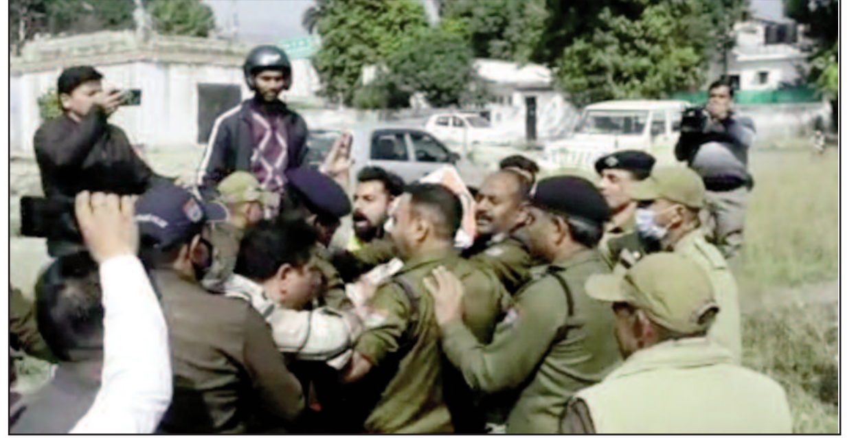
कोटद्वार तहसील में पुतले की छीनाझपटी करते पुलिस व कांग्रेस कार्यकर्ता