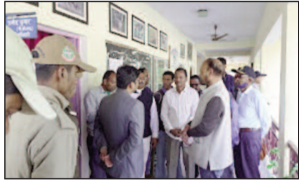
कोटद्वार में उपजिलाधिकारी को ज्ञापन देने पहुंचे उक्रांड कार्यकर्ता

शुक्रवार को ज्ञापन प्रेषित करते हुए दल के सदस्यों ने कहा कि प्रदेश में भ्रष्टाचार चरम सीमा पर पहुंच गया है। कानून व्यवस्थाव राजकाज में वर्तमान राज्य सरकार फेल हो चुकी है। इस बात का सबूत देहरादून में अपनी मांगों को लेकर आंदोलन कर रहे युवाओं पर हुए लाठी चार्ज से पता चल जाता है। सरकार ने उनकी बात मानने के