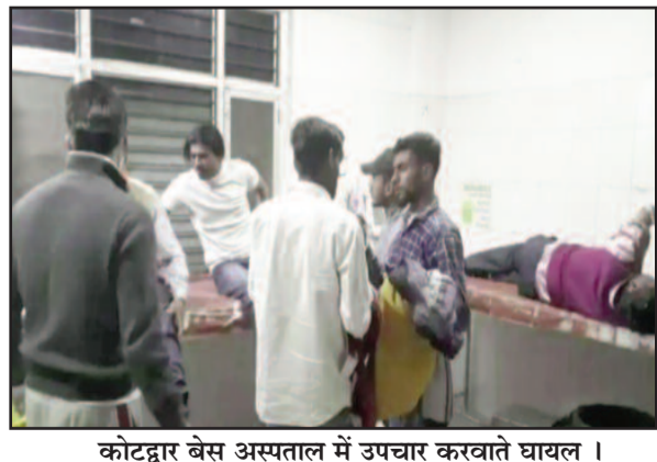
कोटद्वार बेस अस्पताल में उपचार करवाते घायल।

घटना गुरुवार देर शाम की है। कौडिया से एक युवक के विवाह की तिथि तय करने स्वजन व अन्य रिश्तेदार उत्तरप्रदेश के ग्राम मंडावर गए हुए थे। देर रात वापस लौटने के दौरान जाफरा के समीप अचानक