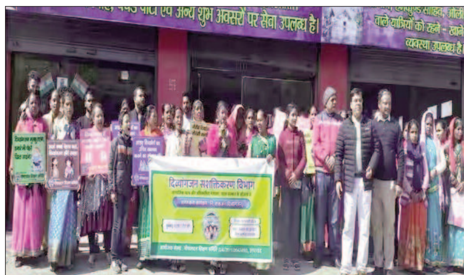
अल्मोड़ा। दिव्यांगजन द्वाराहट नगर में रैली का आयोजन दिव्यांगजन सशक्तिकरण, जागरूकता कार्यक्रम के तहत हुआ। समाजिक न्याय एवं अधिकारिता