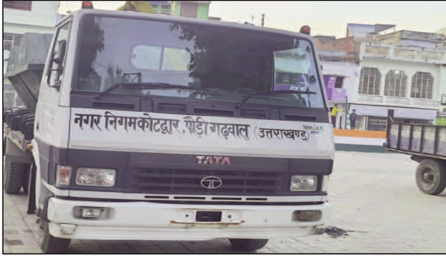
कोटद्वार में बिना नंबर प्लेट खड़ा निगम का वाहन

नंबर प्लेट की जगह वाहनों का लाल स्याही से नगर निगम लिखा गया है। चौकाने वाली बात तो यह है कि आमजन को नियमों का पालन करवाने