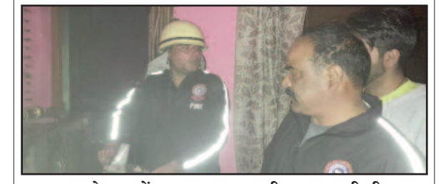
कोटद्वार में आग पर काबू पाती दमकल की टीम