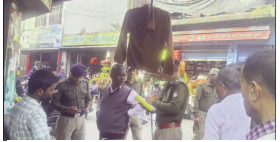
कोटद्वार के गोखले मार्ग में अतिक्रमण हटाने के लिए पहुंची पुलिस