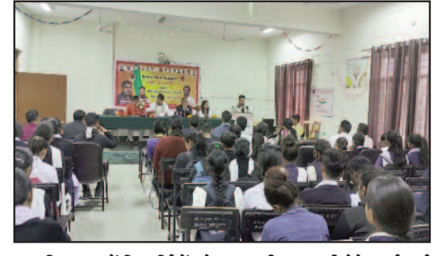
महाविद्यालय में विद्यार्थियों को बजट की जानकारी देते कार्यकर्ता