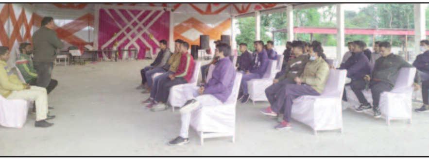
कोटद्वार के दुर्गापुरी में आयोजित बैठक में भाग लेते युवा