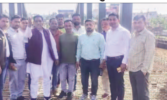
पुल का निर्माण कार्य चल रहा है। पुल लागू बनकर तैयार हो चुका है। जिसके एप्रोच का कार्य किया जा रहा है। स्थानीय लोगों ने उन्हें जानकारी दी थी कि निर्माण एजेंसी कांवेइ पटरी वाली एप्रोच के

रुड़की। कलियर विधायक हाजी फुरकान अहमद ने नई गंगनहर पर बन रहे निर्माणाधीन स्टील गार्डर पुल का निरीक्षण कर अधिकारियों को जल्द से जल्द निर्माण कार्य पूर्ण करने के निर्देश दिए। पिरान कलियर विधायक हाजी फुरकान अहमद कलियर पहुंचे। जहां उन्होंने नई गंगनहर पर बन रहे स्टील गार्डर पुल का निरीक्षण कर अधिकारियों से वार्ता की और निर्माण कार्य जल्द से जल्द पूरा करने के निर्देश दिए। विधायक हाजी फुरकान अहमद ने बताया कि नई गंगनहर पर स्टील गार्डर