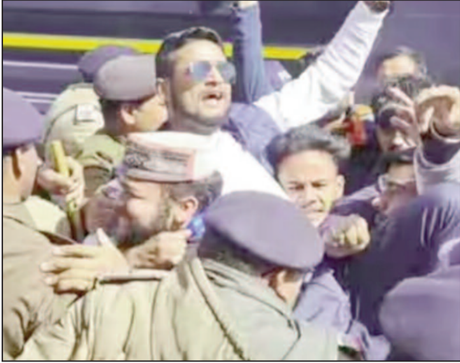
पौड़ी में कांग्रेसियों को हिरासत में लेती पुलिस

रविवार को पौड़ी पहुंचे सीएम पुष्कर सिंह धामी को सीएम पुष्कर सिंह धामी के काले झंडे दिखाने जा रहे कांग्रेसियों को पुलिस ने थाने के पास ही रोक लिया। इस दौरान कांग्रेसियों और पुलिस के बीच तीखी नोकझोंक भी हुई। इस दौरान युवा कांग्रेसियों ने कहा कि सीएम पुष्कर सिंह