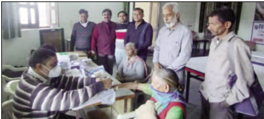
कोटद्वार में आयोजित नेत्र शिविर का लाभ उठाते लोग

जयन्त प्रतिनिधि। कोटद्वार: रोटी बलब कोटद्वार के तत्वावधान में हिमालय अस्पताल जौलीग्रान्त के सहयोग से निःशुल्क नेत्र जांच शिविर का आयोजन किया गया। जिसमें 82 मरीजों का परीक्षण किया गया तथा 6 मरीजों को ऑपरेशन के लिये जौलीग्रान्त भेजा गया।