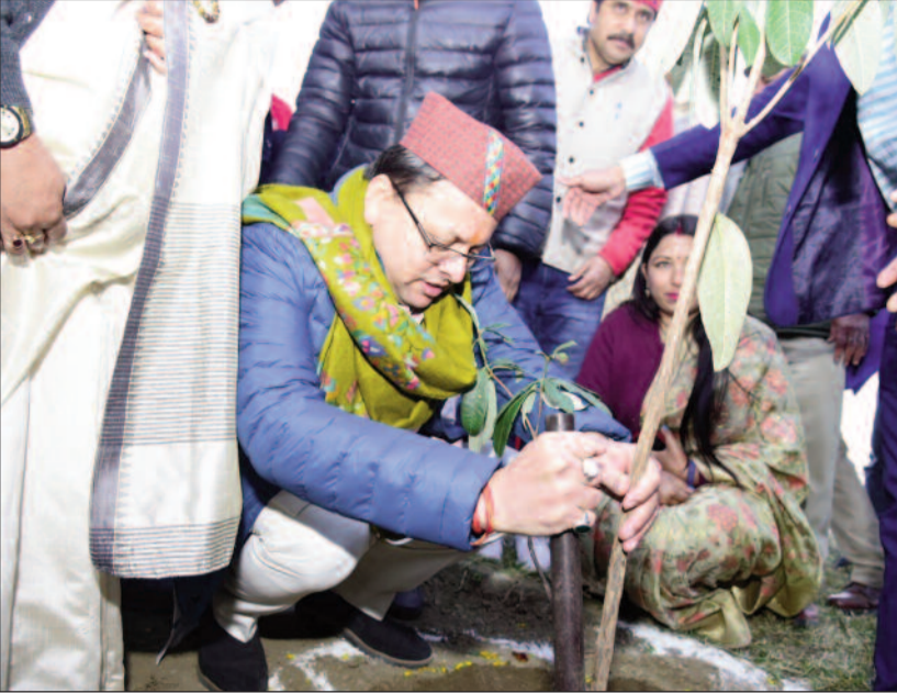
हाउस प्रांगण में पौधारोपण भी किया। विभिन्न संगठनों के साथ संवाद कार्यक्रम में मुख्यमंत्री पुष्कर सिंह धामी ने कहा कि केंद्र व प्रदेश सरकार एकरूपता से उत्तराखंड की जनता के