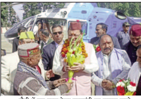
पौड़ी में पुष्प गुच्छ देकर मुख्यमंत्री का स्वागत करते विधायक व अन्य।

रविवार को पौड़ी में मुख्यमंत्री अंत्योदय निःशुल्क गैस रिफिल योजना कार्यक्रम में मुख्यमंत्री पुष्कर सिंह धामी ने यह बात कही। उन्होंने कहा कि प्रधानमंत्री नरेंद्र मोदी के नेतृत्व में भारत पुनः विश्वगुरु बनने के मार्ग पर अग्रसर है। प्रधानमंत्री के दिशा निर्देश में हमारी सरकार उत्तराखंड को सर्वश्रेष्ठ प्रदेश बनाने के लिए कार्य कर रही है। कहा कि केंद्र व प्रदेश सरकार