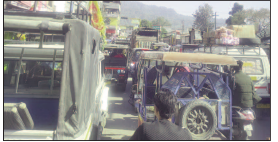
कोटद्वार के देवी रोड में लगा वाहनों का लंबा जाम।

अव्यवस्थाओं के कारण बेपटरी हो रहा शहर का यातायात