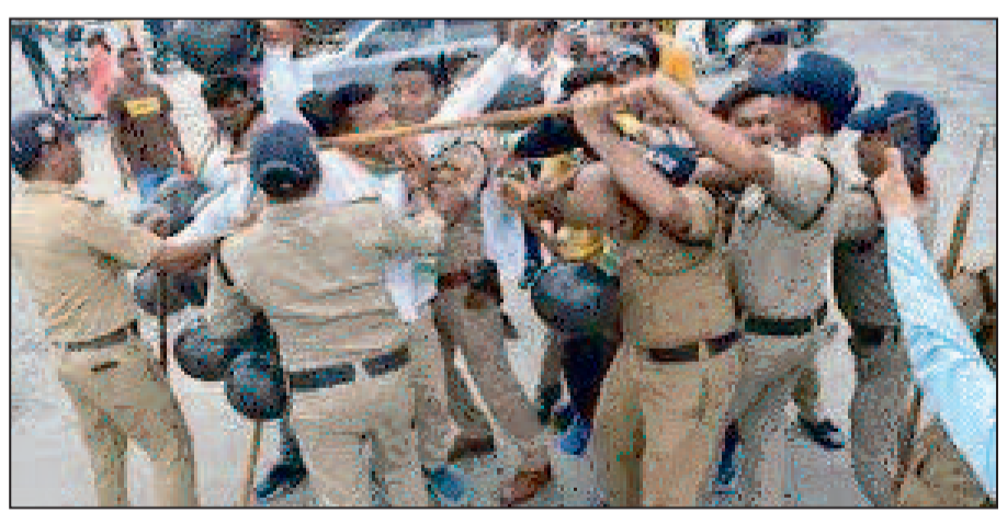
करीब एक दर्जन कार्यकर्ताओं को रविवार सुबह ही गिरफ्तार कर लिया था, जिन्हें मुख्यमंत्री का कार्यक्रम