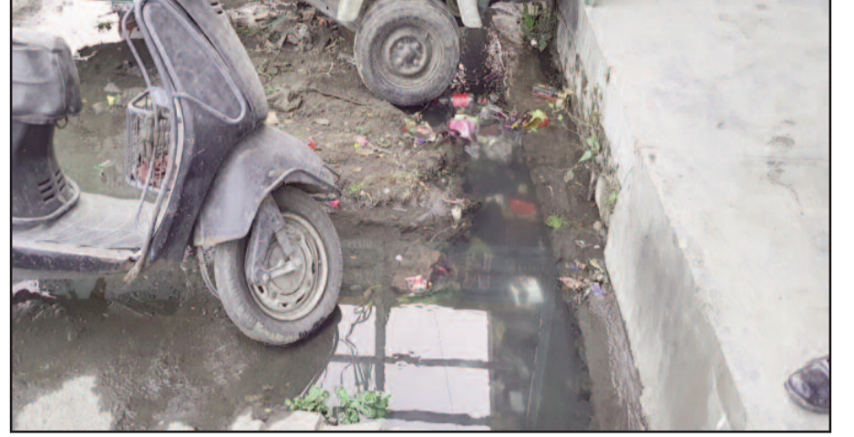
कोटद्वार के बदरीनाथ मार्ग में नाली चोक होने से सड़क किनारे जमा गंदगी।

जयन्त प्रतिनिधि कोटद्वार: नगर निगम बनने के बाद उम्मीद थी कि बेहतर सुविधाओं का लाभ मिलेगा। लेकिन, नगर निगम पांच साल में भी जनता की उम्मीदों पर खड़ा उतरता हुआ नहीं दिखाई दे रहा है। हालात यह है कि शहर में जगह-जगह नालियां चोक पड़ी हुई हैं। नतीजा, सड़कों पर बह रही गंदगी से आमजन को संक्रमक बीमारियों का खतरा सताने लगा है। बावजूद नगर निगम गंदगी नौद से जागने को तैयार नहीं है।