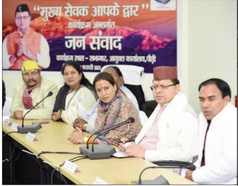
देहरादून। मुख्यमंत्री पुष्कर सिंह धामी ने रविवार को जनपद पौड़ी मुख्यालय स्थित सर्किट हाउस में पूर्व सैनिक संगठन एवं शहीदों के परिजनों, प्रबुद्ध नागरिकों, महिला