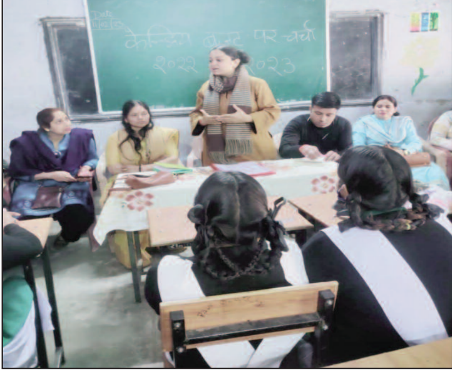
कोटद्वार में बजट की जानकारी देते भाजपा महिला मोर्चा की पदाधिकारी।