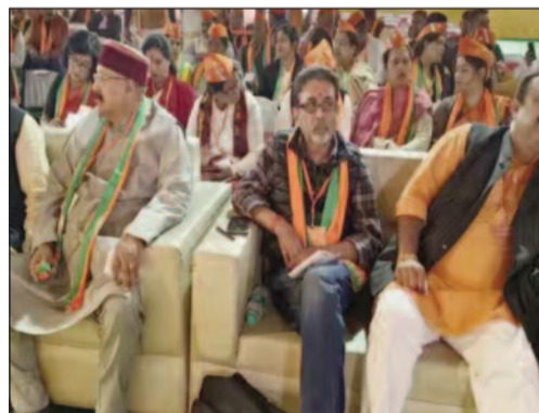
रुड़की। भाजपा की जिला कार्यसमिति की बैठक में पार्टी नेताओं ने सरकार के कामकाज के साथ ही उपलब्धियों को पदाधिकारियों और कार्यकर्ताओं के सामने रखा। दो दिवसीय कार्यसमिति में जिला और मंडल इकाई के पदाधिकारियों, कार्यकर्ताओं और तीन चरणों में प्रशिक्षण भी दिया गया। लक्सर में शनिवार

को भाजपा जिला कार्यसमिति की बैठक शुरू हुई थी। कार्यसमिति में कार्यकर्ताओं और पदाधिकारियों को तीन चरणों में प्रशिक्षण दिया गया। पहले चरण में कैबिनेट मंत्री सतपाल महाराज ने प्रदेश सरकार के काम गिनाए। कहा प्रदेश में 100 नए आंचल कैफे खोले जा रहे हैं। प्रसव के लिए मैदानी क्षेत्र के अस्पतालों में आने वाली पर्वतीय क्षेत्र की गर्भवतियों के लिए बर्थ वेटिंग हेम बनाए जा रहे हैं। आपदा या महामारी से अनाथ बच्चों की शिक्षा के लिए मुख्यमंत्री बालश्रम योजना शुरू की गई है। दूसरे चरण में प्रदेश अध्यक्ष महेंद्र भट्ट ने प्रधानमंत्री जनधन योजना, प्रधानमंत्री जीवन ज्योति योजना, अटल पेंशन योजना, प्रधानमंत्री सुरक्षा योजना, अटल आयुष्मान योजना के बारे में जानकारी दी। तीसरे चरण में हरिद्वार सांसद डॉ. रमेश पोखरियाल निशंक ने केंद्र सरकार की योजनाएं बताईं।