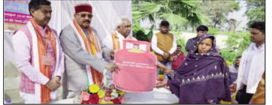
हरिद्वार में मुख्यमंत्री अंत्योदय निःशुल्क गैस रिफिल योजना का शुभारंभ करते काबिना मंत्री सतपाल महाराज

योजना के तहत राज्य में अंत्योदय कार्ड धारकों के 1.84 लाख परिवारों को सालाना 3 निशुल्क गैस रिफिल का लाभ मिलेगा। कहा कि मुख्यमंत्री द्वारा प्रदेश में प्रचलित अंत्योदय राशन कार्डधारकों को वित्तीय वर्ष-2022-23 "मुख्यमंत्री अंत्योदय निःशुल्क गैस रिफिल योजना" की घोषणा की गयी थी जिसमें जनपद में प्रचलित अंत्योदय राशन कार्डधारकों को वित्तीय वर्ष 2022-23 में 3 गैस रिफिल निःशुल्क उपलब्ध कराये जाने के निर्देश दिये गये। इसके पश्चात जनपद में प्रचलित अंत्योदय राशन कार्डधारकों के डाटा को गैस एजेन्सियों के माध्यम से एनपीजी आईडी से मैपिंग की गयी एवं राशनकार्ड धारकों का जारी एलपीजी कनेक्शन एवं कनेक्शनधारियों के खातों में सब्सिडी का अन्तर्ण करना। शासनादेशानुसार जिसके प्रथम चरण में अप्रैल से जुलाई, 2022 तक एक निःशुल्क गैस रिफिल का अंत्योदय को खाते में अंतरित किया जाना, एवं दूसरे चरण में अगस्त से नवंबर 2022 के मध्य द्वितीय निःशुल्क गैस रिफिल की सब्सिडी को खाते में अंतरण करना एवं योजना के