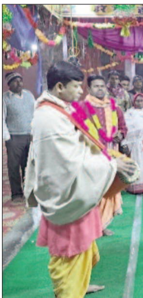
सितारगंज, देवभूमि बैकुंठपुर शक्तिफार्म नंबर 1 में अखण्ड महानाम संकीर्तन प्रातः 6 बजे से प्रारंभ हुई। जीव मात्र के उद्धार

संप्रदाय, हरिनाम संकीर्तन के लिए बैकुंठपुर पहुंच चुके हैं। आजादी के बाद बसाए गए शक्तिफार्म के ग्राम बैकुंठपुर में विगत 50 वर्षों से प्रतिवर्ष अखण्ड हरिनाम संकीर्तन होते हुए आ रहे हैं।