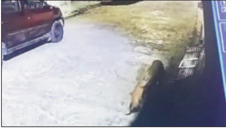
सीसीटीवी कैमरे में कैद हुआ हरेंद्र नगर में घूमता गुलदार

गुलदार घूमता हुआ नजर आ रहा है। गुलदार की दहशत से मोहल्लेवासी डर कर घर से बाहर निकल रहे हैं। बच्चों ने घरों के बाहर खेलना भी बंद कर दिया है। दो दिन पूर्व गुलदार का एक