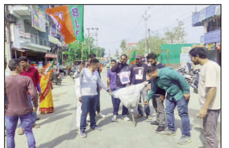
कोटद्वार के दुर्गापुरी में कांग्रेस विधायकों का पुतला दहन करते भाजपा कार्यकर्ता