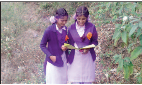
एकेश्वर ब्लाक के अंतर्गत ढौंडखाल में परीक्षा देने के बाद प्रश्न पत्र पर चर्चा करती छात्राएं

गुरुवार को सुबह दस बजे से दोपहर एक बजे तक परीक्षा का समय निर्धारित किया गया था। परीक्षा को नकल मुक्त बनाने के लिए शिक्षा विभाग की ओर से परीक्षा केंद्रों में पुख्ता इंतजाम किए गए थे। प्रवेश द्वार पर ही विद्यार्थियों की तलाशी ली जा रही थी। इसके उपरांत अधिकारी भी समय-समय पर सभी सेंट्रों का निरीक्षण करते रहे। परीक्षा संपन्न होने के बाद ही विद्यार्थियों