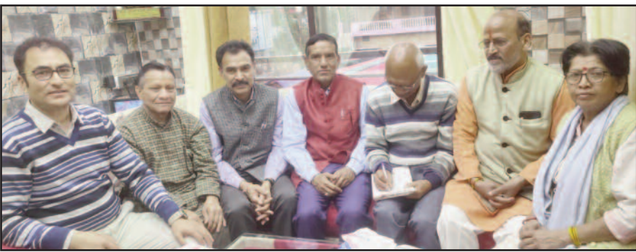
आयोजित बैठक में भाग लेते समिति के सदस्य।

आज नव संवत्सर समारोह समिति की जीएमओयू सभागार में आयोजित बैठक में नव संवत्सर स्वागत समारोह के कार्यक्रमों को अंतिम रूप दिया गया। बैठक की जानकारी दी गई कि आगामी 22 मार्च से पिंगल नामक विक्रम संवत् 2080 युगान्द 5125 शुरू हो रहा है। इसकी पूर्व संध्या पर