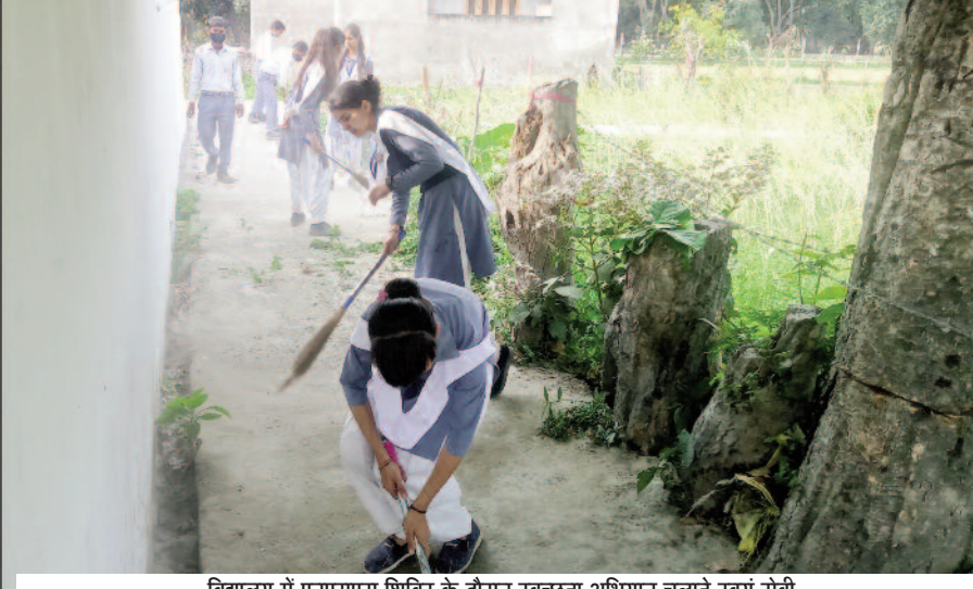
विद्यालय में एनएसएस शिविर के दौरान स्वच्छता अभियान चलते स्वयं सेवी