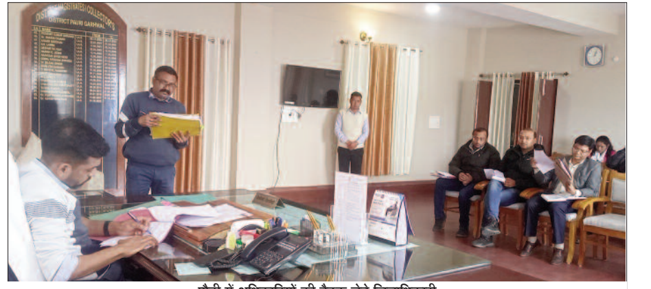
पौड़ी में अधिकारियों की बैठक लेते जिलाधिकारी

जिलाधिकारी ने विभिन्न मामलों में तहसिलों, नगर निगम कोटद्वार और नगर पालिकालिकाओं के स्तर पर लंबित प्रकरणों को शीघ्र निस्तारित करने के सक्ती से निर्देश दिये। उन्होंने नजूल भूमि से संबंधित लंबित मामलों में 15 दिन, मोबाइल टॉवर लगाने से संबंधित भूमि प्रकरणों में 7 दिन तथा धारा 154 के अंतर्गत प्राप्त निवेश के आवेदनों के संबंध में स्पष्ट और विस्तृत स्टेटस रिपोर्ट प्रस्तुत करने के अधिकारियों को निर्देश दिये। उन्होंने धारा 154 से संबंधित प्रकरणों में तहसील