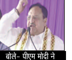
बोले- पीएम मोदी ने स्थापित किया नया आयाम

चामराजनगर, एजेंसी। भाजपा के राष्ट्रीय अध्यक्ष जेपी नड्डा ने बुधवार को चामराजनगर में विजय संकल्प यात्रा को हरी झंडी दिखाकर खाना किया। जेपी नड्डा ने कहा कि विजय संकल्प यात्रा कर्नाटक में चार स्थानों से शुरू होगी। भाजपा अध्यक्ष ने कहा कि 20 दिनों के अंदर इस यात्रा के माध्यम से हम 8 हजार किमी की यात्रा करेंगे।