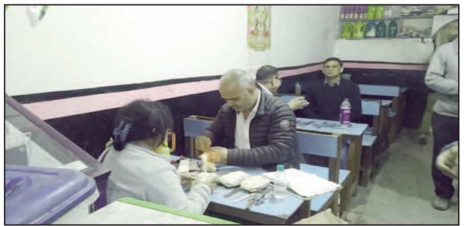
खाद्य पदार्थ के सैंपल को सील करते हुए खाद्य सुरक्षा विभाग के कर्मचारी।