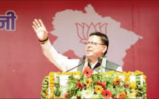
मुख्यमंत्री पुष्कर सिंह धामी रामलीला मैदान, हल्द्वानी में जनसभा को संबोधित करते हुए।

लाने का प्रयास करेंगे जो प्रदेश के युवाओं की आशाओं और आकांक्षाओं के अनुरूप होगा। हम आने वाला बजट में प्रदेश की माताओं और बहनों को आत्मनिर्भर बनाने का कार्य करेंगे और प्रदेश के किसानों को खुशहाली प्रदान करने का भी प्रयास करेंगे। मुख्यमंत्री ने कहा कि राज्य सरकार द्वारा राज्य में लागू किए गए नकल विरोधी कानून का कठोर निर्णय नकल माफियाओं को नैस्तनाबूद करने का काम करेगा। पहली बार नकल करने वालों, कराने वालों और प्रक्रियाओं को सही प्रकार से लागू न करने वालों को जेल की काल कोठी में डालने का काम किया है। उन्होंने कहा वर्तमान में भर्ती चोटले को जो भी जाँच हमारी सरकार करवा रही है वह जाँच