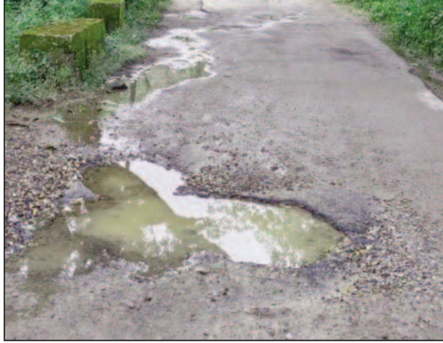
रिखणीखाल प्रखंड में बदहाल स्थिति में पड़ा बंजादेवी-पाणीसैण-मैदणीसारी मोटर मार्ग