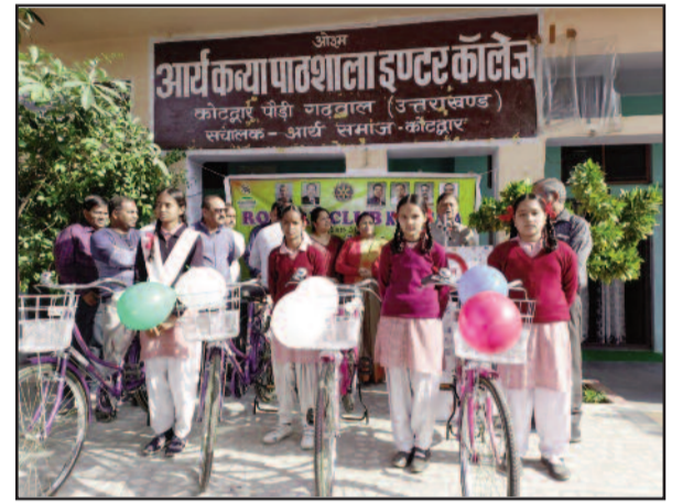
विद्यार्थियों को साइकिल देते क्लब के सदस्य