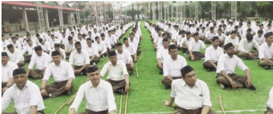
कोटद्वार में पथ संचलन के लिए एकत्रित हुए स्वयं सेवक

रविवार को पथ संचलन एक देवी रोड स्थित एक वेडिंग प्लांट से प्रारंभ होकर कोटद्वार के मुख्य मार्गों से होता हुआ पुनः वेडिंग प्लांट में संपन्न हुआ। नगर के लगभग सात सौ स्वयंसेवकों ने पूर्ण गणवेश में भाग लेकर एकता और अनुशासन का प्रदर्शन किया। पथ संचलन से पहले स्वयं सेवकों के द्वारा आठ सर संघ चालक प्रणाम किया गया। इस अवसर पर मुख्य वक्ता जिला