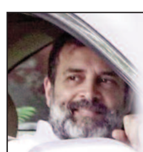
अचानक कार्रवाई पर उठाए सवाल

नई दिल्ली, एजेंसी। भारत जोड़ो यात्रा के दौरान दिए भाषण को लेकर दिल्ली पुलिस ने जो नोटिस जारी किया था, राहुल गांधी ने उसका प्रारंभिक जवाब दिया है। रिपोर्ट्स के अनुसार, राहुल गांधी ने चार पेज, 10 पॉइंट में दिल्ली पुलिस को अपना जवाब दिया है। अपने जवाब में राहुल गांधी ने पुलिस की कार्रवाई पर सवाल उठाए हैं। राहुल गांधी ने पुलिस की कार्रवाई को अभूतपूर्व बताया है और आरोप लगाया कि अदाणी मामले को उठाने के चलते उनके खिलाफ यह कार्रवाई हुई है। अपने प्रारंभिक जवाब में राहुल गांधी ने उनके भाषण के 45 दिन बाद पुलिस कार्रवाई और उसकी प्रतिक्रिया पर भी सवाल उठाए हैं। राहुल गांधी ने दिल्ली