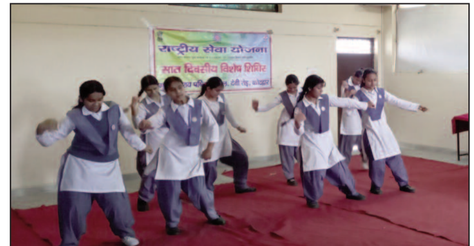
कोटद्वार के गुरु रामराय पब्लिक स्कूल में आयोजित एनएसएस शिविर के दौरान सांस्कृतिक प्रस्तुति देती छात्राएं