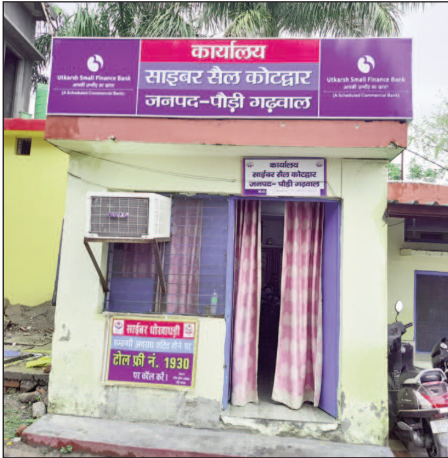
कोटद्वार कोतवाली में स्थित साइबर सेल

जयन्त प्रतिनिधि। कोटद्वार : डिजिटल तकनीक में विस्तार के साथ ही साइबर अपराध भी तेजी से बढ़ते जा रहे हैं। हर रोज साइबर ठगों के रुपये उड़ाने के नए तरीकों से साइबर पुलिस भी हैरान है। अब तक साइबर ठग बैंक अधिकारी बन खाता नंबर व एटीएम कार्ड का पिन कोड पूछकर आनलाइन ठगी करते थे। लेकिन, अब मोबाइल पर लिंक भेजने के साथ ही आनलाइन सामान की खरीद पर लालच देकर खाते में जमा रकम को टगा जा रहा है। पिछले एक वर्ष में कोटद्वार की साइबर पुलिस पचास से अधिक साइबर ठगी के मामले दर्ज कर चुकी है। यही नहीं, यह आंकड़े लगातार बढ़ते जा रहे हैं। जबकि, पुलिस भी समय-समय पर आमजन को साइबर अपराधों के प्रति जागरूक करती रहती है। आंकड़े बताते हैं कि साइबर ठगी के शिकार होने वालों में सबसे अधिक पढ़े-लिखे व्यक्ति ही हैं।