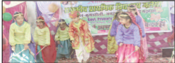
राजकीय प्राथमिक विद्यालय जलेथा में सांस्कृतिक प्रस्तुति देते विद्यार्थी

जयन्त प्रतिनिधि। कोटद्वार : विकासखंड जयहरीखाल के अंतर्गत राजकीय प्राथमिक विद्यालय जलेथा का वार्षिकोत्सव धूमधाम के साथ मनाया गया। इस दौरान नन्हें विद्यार्थियों की सांस्कृतिक प्रस्तुति ने दर्शकों को मंत्रमुग्ध कर दिया।