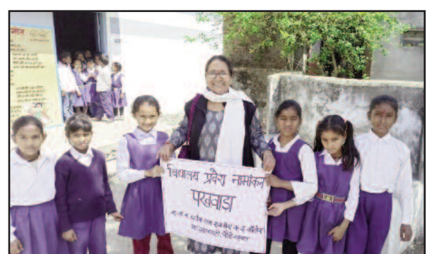
कोटद्वार के भाबर क्षेत्र में जागरूकता रैली निकालती छात्राएं

जयन्त प्रतिनिधि। कोटद्वार : सरकारी विद्यालयों में छात्र संख्या बढ़ाने के लिए राजकीय बालिका इंटर कालेज कलालघाटी के विद्यार्थियों ने जागरूकता रैली निकाली। इस दौरान छात्र व शिक्षकों ने क्षेत्रवासियों से अपने बच्चों का प्रवेश सरकारी विद्यालय में करवानी की अपील की।