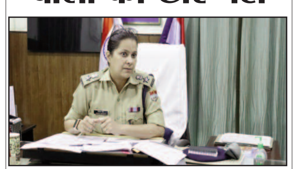
एसएसपी श्वेता चौबे बैठक को संबोधित करते हुए।

जयन्त प्रतिनिधि। पौड़ी : ओवर स्पीड से वाहन चलाने वाले चालकों की अब खैर नहीं। पर्वतीय क्षेत्रों में हदसों पर अंकुश लगाने को लेकर वरिष्ठ पुलिस अधीक्षक पौड़ी गढ़वाल श्वेता चौबे ने वाहनों की गति निर्धारण को लेकर गठित समिति के सदस्यों के साथ बैठक की। बैठक में निर्णय लिया गया कि पर्वतीय क्षेत्रों में वाहनों की ओवर स्पीड पर अंकुश लगाने के लिए एमवी एक्ट में कार्रवाई की जाएगी। एसएसपी ने कहा कि महत्वपूर्ण स्थानों पर यातायात नियमों को लेकर साइन बोर्ड भी लगाए जाएं। एसएसपी श्वेता चौबे ने कहा कि आप दिन सड़क हादसे हो रहे हैं। आमजन की सुरक्षा और यातायात को सुव्यवस्थित करने के साथ ही सड़क हादसों पर