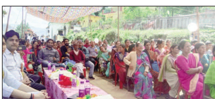
सतपुली में आयोजित कार्यक्रम में मौजूद दर्शक

जयन्त प्रतिनिधि। कोटद्वार/सतपुली : सरस्वती शिशु मंदिर शीला बांघाट का वार्षिकोत्सव धूमधाम के साथ मनाया गया। इस दौरान विद्यार्थियों ने रंगारंग प्रस्तुति ने दर्शकों को मंत्रमुग्ध कर दिया।