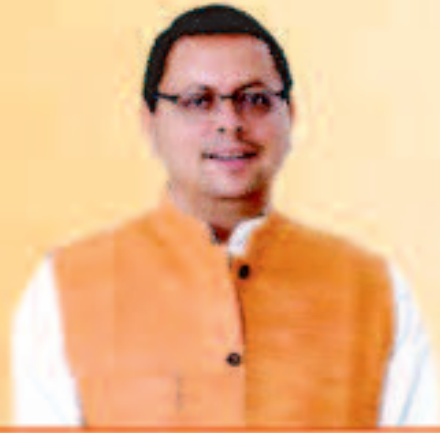
पुष्कर सिंह धामी मुख्यमंत्री, उत्तराखण्ड