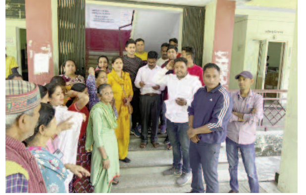
कोटद्वार तहसील में संप्रदाय विशेष के खिलाफ प्रदर्शन करते क्षेत्रवासी

जयन्त प्रतिनिधि। कोटद्वार : काशीरामपुर तल्ला में एक संप्रदाय विशेष के व्यक्ति को भूमि बेचे जाने पर क्षेत्रवासियों ने तहसील परिसर में प्रदर्शन किया। कहा कि क्षेत्र का एक भूमि विक्रेता उक्त भूमि को बेचने की योजना कर रहा है। ऐसे में प्रशासन को पूरे मामले की जांच कर भूमि बिक्री पर रोक लगानी चाहिए।