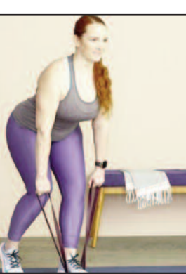
एक्सरसाइज है लेकिन यह हमारी टांगों के लिए बहुत फायदेमंद है। हालांकि इस एक्सरसाइज को हमें थोड़ा तेजी से करना होगा। यह फंक्शनल कार्डियो