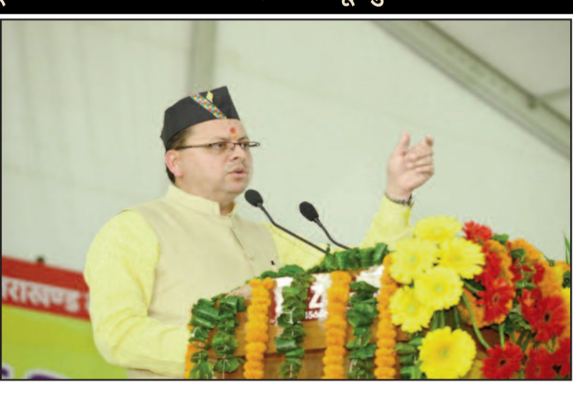
मुख्यमंत्री पुष्कर सिंह धामी कार्यक्रम को संबोधित करते हुए।

जयन्त प्रतिनिधि। देहरादून : राज्य सरकार के एक साल का कार्यकाल पूर्ण होने पर प्रदेशभर में सरकार की एक साल की उपलब्धियों पर आधारित विभिन्न कार्यक्रम आयोजित किये गये। मुख्यमंत्री पुष्कर सिंह धामी ने गुरुवार को रेंजर्स ग्राउंड में आयोजित मुख्य कार्यक्रम में सूचना एवं लोक सम्पर्क विभाग द्वारा प्रकाशित विकास पुस्तिका "एक साल नई मिसाल" का विमोचन किया। इस अवसर पर ग्राम तरला नागल सहस्रधारा मार्ग में 12.45 हेक्टेयर में बनने वाले लगभग 37 करोड़ रुपये की लागत के सिटी फोरस्ट का शिलान्यास भी मुख्यमंत्री ने किया। सरकार के एक साल पूर्ण होने पर मुख्यमंत्री ने प्रदेशहित में की 16 महत्वपूर्ण घोषणाएं। उत्तराखण्ड के लोकसर्वो