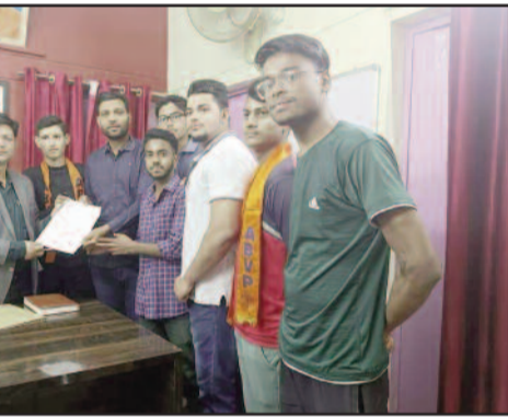
कोटद्वार तहसील में उपजिलाधिकारी को ज्ञापन देते अभावपि कार्यकर्ता ।

कोटद्वार : राजकीय महाविद्यालय में बीएड स्विचट पोषित पाठ्यक्रम में अध्ययनरत एससी, एसटी व आर्थिक रूप से कमजोर छात्रों की छात्रवृत्ति में बाधा पहुंचने पर अभावपि पदाधिकारियों ने रोष व्यक्त किया है।