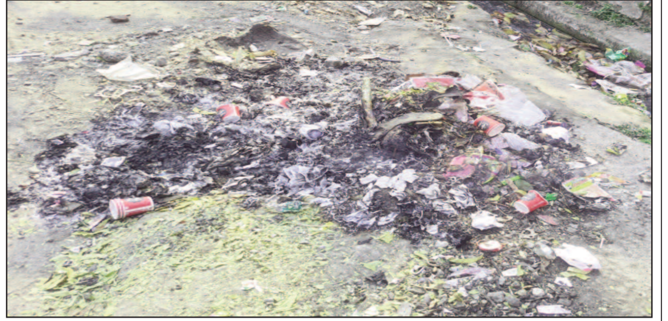
कोटद्वार में सड़क किनारे जलाया जा रहा कूड़ा