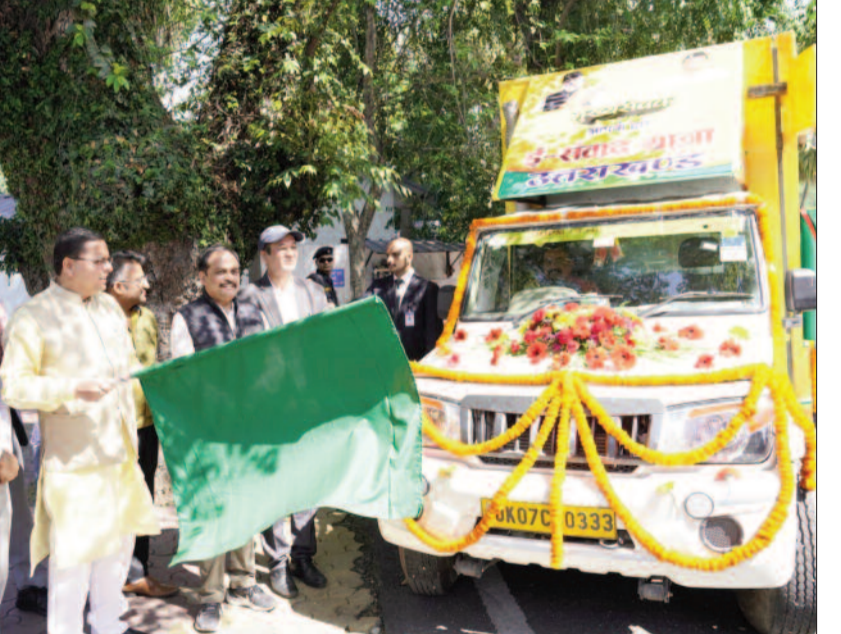
सीएम पुष्कर सिंह धामी 'ई-संवाद यात्रा उत्तराखण्ड' वाहन को रवाना करते हुए।

जयन्त प्रतिनिधि। देहरादून : मुख्यमंत्री पुष्कर सिंह धामी ने गुरुवार को मुख्यमंत्री कैम्प कार्यालय में 'मुख्य सेवक आपके द्वार' अन्तर्गत 'ई-संवाद यात्रा उत्तराखण्ड' वाहन का फ्लैग ऑफ किया। मुख्यमंत्री ने कहा कि प्रचार वाहन के माध्यम से सरकार द्वारा चलाई जा रही विडिओ जन कल्याणकारी योजनाओं की जानकारी दी जा रही है। इस वाहन को विशेष रूप से आउटडोर विडिओ कॉन्फ्रेंसिंग के लिए तैयार किया गया है और इसका उपयोग दूर-दराज के गांवों में डूी लोगों से बातचीत करने के लिए किया जाएगा। मुख्यमंत्री विडिओ कॉफ्रेंसिंग सुविधा के माध्यम से इस वाहन से दूर-दराज के लोगों से जुड़ सकेंगे। मुख्यमंत्री ने कहा कि इस सुविधा से राज्य के लोगों को मुख्यमंत्री कार्यालय के संपर्क करने में डूी मदद मिलेगी।