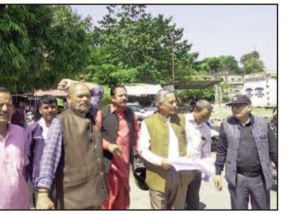
कोटद्वार तहसील में प्रदर्शन करते उक्रांद कार्यकर्ता

जयन्त प्रतिनिधि कोटद्वार : प्रदेश सरकार की नाकामियों के खिलाफ उत्तराखंड क्रांति दल ने कोटद्वार तहसील में प्रदर्शन किया। कहा कि भाजपा ने विकास के नाम पर केवल जनता को गुमराह करने का कार्य किया है। प्रदेश में बेरोजगारी लगातार बढ़ती जा रही है।