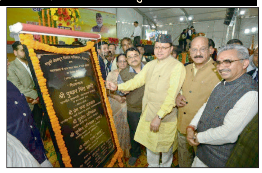
सहस्रधारा मार्ग स्थित तरला नागल में बनने वाले सिटी पार्क शिलान्यास करते हुए सीएम ।

एक साल में जनहित में लिए गये अनेक महत्वपूर्ण निर्णय मुख्यमंत्री ने कहा कि सरकार द्वारा मसूरे में 'सशक्त उत्तराखण्ड@25 थीम' पर आयोजित व्यापक चिंतन और विचार-विमर्श द्वारा क्षेत्रवार राज्य के विकास का न केवल खाका तैयार किया गया बल्कि इस पर तेजी से काम शुरू किया जा चुका है। अंत्योदय परिवारों को तीन गैस सिलेंडर देने हों, प्रदेश की महिलाओं के लिए शैक्षणिक आरक्षण की व्यवस्था को लागू करना हो, समान नागरिक संहिता का मसौदा तैयार करने की कार्यवाही हो, जबरन धर्मांतरण पर रोक के लिये कानून बनाना हो, नई शिक्षा नीति लागू करना हो, नई खेल नीति लागू करना हो, सख्त नकल विरोधी कानून हो, 'आंदोलनकारियों व उनके आश्रितों को सरकारी कार्यों को रूढ़ते हुए आगे बढ़ गई है। राज्य में सख्त नकल विरोधी कानून बनाया गया है। उत्तराखण्ड में पहली बार परीक्षाओं में धांधली करने वाले 80 से ज्यादा लोगों को जेल में डाला है।