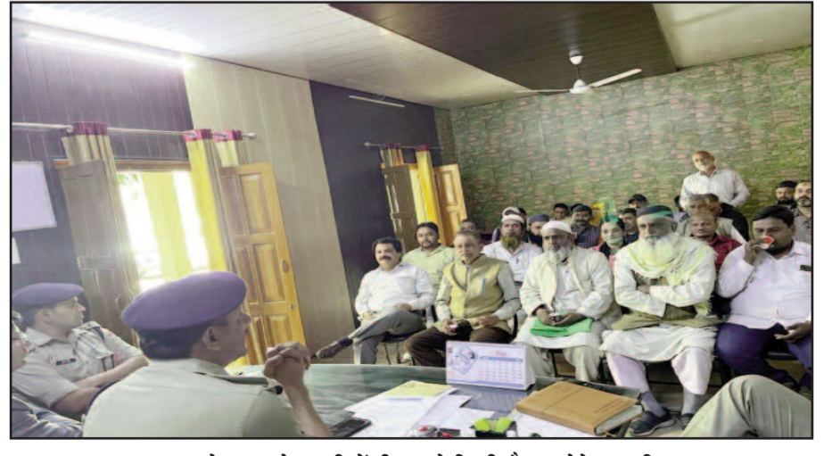
कोटद्वार कोतवाली में पीस कमेटी की बैठक लेते एएसपी

कोटद्वार : अपर पुलिस अधीक्षक शेखर चंद्र सुयाल ने कहा कि त्योहार के दौरान शांति व्यवस्था बिगाड़ने वालों पर पुलिस की विशेष नजर रहेगी। कहा कि शहर में कानून व्यवस्था बनी रहे। इसके लिए आमजन को पुलिस का सहयोग करना चाहिए। तवाली परिसर में आयोजित पीस कमेटी की बैठक में एएसपी ने यह बात कही। उन्होंने कहा कि त्योहार के दौरान शांति व्यवस्था बनी रहें, इसके लिए पुलिस ने पूरी तैयारियां कर ली हैं। शांति भंग करने वालों पर पुलिस को नजर रहेगी। उन्होंने पुलिस को भी ऐसे अपराधिक तत्वों पर कड़ी नजर रखने के निर्देश दिए। कहा कि शहर के