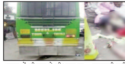
श्रद्धालुओं की जान ले ली। माना जा रहा है कि चालक ने बस स्टार्ट करने के बाद ब्रेक का प्रेशर नहीं लिया होगा, जिस कारण ब्रेक नहीं लगने से बस बेकाबू होकर श्रद्धालुओं के जख्मी को रौंदते हुए आगे बढ़ गई। हादसा होते ही घटना स्थल पर चीखपुकार और अफरातफरी मच गई। हादसे की वजह बस चालक की

टनकपुर (चांपावत)। पूर्णागिरी मेले में बेकाबू बस ने श्रद्धालुओं को रौंद दिया। हादसे में दो सभी बहनो समेत पांच श्रद्धालुओं की मौत हो गई, जबकि दो मासूमों समेत आठ श्रद्धालु घायल हो गए। मृतकों में तीन महिलाएं और दो पुरुष थे। तीन लोगों की घटना स्थल पर, जबकि चौथे की इलाज के दौरान अस्पताल में और पांचवें श्रद्धालु की हार सेंटर ले जाते वक्त रास्ते में मौत हुई। टुलसीगाड़ बस स्टैंड के इलाके से नीचे उतर रही बस ब्रेक नहीं लगाने की वजह से मौत बनकर काल बन गई और पलक झपकते ही पांच