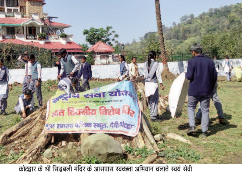
कोटद्वार के श्री सिद्धबली मंदिर के आसपास स्वच्छता अभियान चलाते स्वयं सेवी