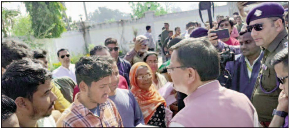
सितारगंज,। जायडस कंपनी के श्रमिकों ने रविवार को खटीमा में सीएम आवास पहुंचकर मुख्यमंत्री

पुष्कर सिंह धामी से मुलाकात की। उन्होंने कार्मिकों की कार्य बहाली की मांग की।