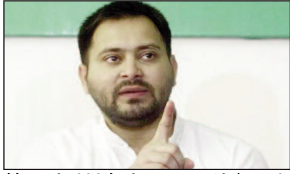
उप मुख्यमंत्री तेजस्वी यादव

पटना, एजेंसी। तमिलनाडु में बिहारी कामगारों पर कथित तौर पर हमले की खबर के संदर्भ में उप मुख्यमंत्री तेजस्वी यादव ने रविवार को कहा कि बिहार के प्रवासी मजदूरों पर हमले कतई बर्दाश्त नहीं किए जाएंगे।