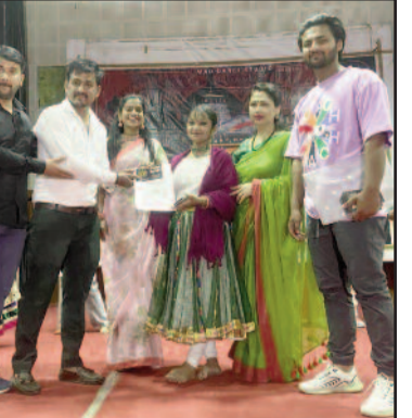
कोटद्वार में बेहतर डांस की प्रस्तुति देने वाली छात्रा को सम्मानित करते आयोजक व अन्य।

वक्ताओं ने बच्चों को पढ़ाई के साथ अन्य प्रतियोगिताओं में भी प्रतिभाग करने के लिए प्रेरित किया। कहा कि प्रत्येक व्यक्ति के अंदर एक खूबी होती है। हमें अपने अंदर की खूबी को पहचान कर जीवन में आगे बढ़ना चाहिए। डांस प्रतियोगिता में पचास से अधिक प्रतिभागियों ने प्रतिभाग किया। कलाकारों ने