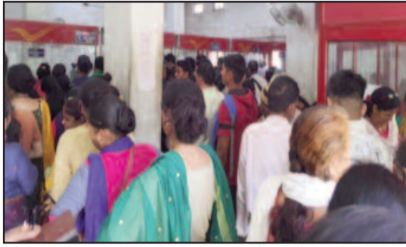
कोटद्वार के मुख्य डाकघर में उमड़ी उपभोक्ताओं की भीड़

कोटद्वार व आसपास के क्षेत्र में करीब एक दर्जन से अधिक बैंक हैं। इन सभी बैंकों से सैकड़ों उपभोक्ता जुड़े हुए हैं। लेकिन, शुरुवार, शनिवार व रविवार की छुट्टी होने के कारण उपभोक्ताओं के बैंक से संबंधित कार्य अघर में लटके हुए थे। ऐसे