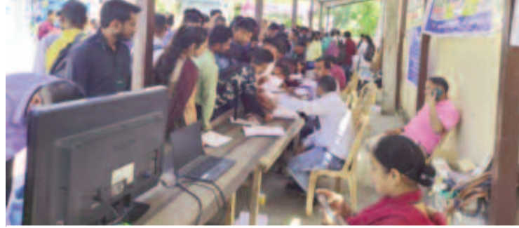
कोटद्वार में आयोजित रोजगार मेले में भाग लेते युवा