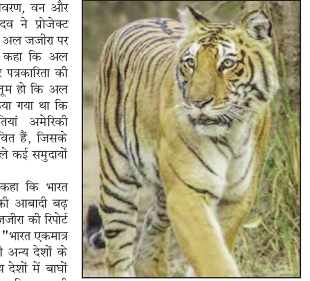
रिजर्व स्थानीय लोगों के लिए सालाना 50 लाख से अधिक रोजगार सृजित करता है।

केंद्रीय मंत्री ने कहा, "अगर अल जजीरा प्रोगेमेंड डाइरेक्टर पत्रकारिता करे, तो इस बात की सरहना करने में सक्षम होगा कि भारत का टाइगर एजेंड समावेशी और सफल है क्योंकि इसमें स्थानीय समुदायों की भागीदारी है। हमारा टाइगर