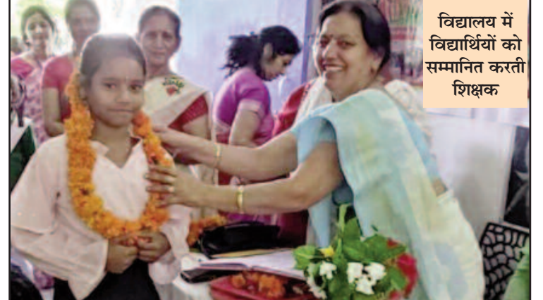
विद्यालय में विद्यार्थियों को सम्मानित करती शिक्षक

साथ ही विगत वर्ष हाईस्कूल एवं इण्टर बोर्ड परीक्षा में 75 प्रतिशत से अधिक अंक प्राप्त करने वाली 13 छात्राओं की माताओं को एक-एक हजार रुपये भी पुरस्कार स्वरूप दिए।