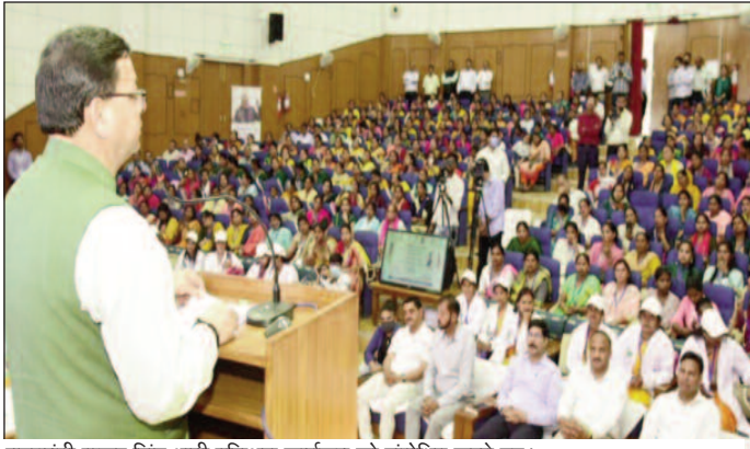
मुख्यमंत्री पुष्कर सिंह धामी प्रशिक्षण कार्यक्रम को संबोधित करते हुए।

जयन्त प्रतिनिधि। देहरादून : मुख्यमंत्री पुष्कर सिंह धामी ने बुधवार को सर्वे ऑफ इण्डिया सभागार, देहरादून में भारत सरकार द्वारा वित्त पोषित ए हेल्प योजना के प्रशिक्षण कार्यक्रम का शुभारम्भ किया। इस अवसर पर मुख्यमंत्री द्वारा 23 ए हेल्प कार्यक्रमियों को ए हेल्प किट वितरित किए गए। मुख्यमंत्री ने कहा कि किसी भी समाज की रीढ़ उसकी सशक्त महिलाएं ही हैं, यदि किसी राज्य की नारी शक्ति प्रगति कर रही है तो उस राज्य का विकास सुनिश्चित है, उसे कोई रोक नहीं सकता। हमारे प्रदेश के निर्माण में महिलाओं ने अपना विशेष योगदान दिया है। एक ओर जहां प्रदेश की मातृशक्ति ने पूरे समाज