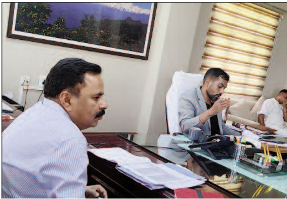
डीएम डॉ. आशीष चौहान बैठक में निर्देश देते हुए।

जयन्त प्रतिनिधि। पौड़ी : जिलाधिकारी डॉ. आशीष चौहान ने कलेक्ट्रेट कार्यालय में जिला जल एवं स्वच्छता मिशन की समीक्षा बैठक ली। जिलाधिकारी ने पेयजल निगम, जल संस्थान व संबंधित अधिकारियों को माहवार पेयजल के कार्यों को पूर्ण होने के प्लान बनाकर उसकी रिपोर्ट प्रस्तुत करने के निर्देश दिये। कहा कि जो कार्य प्रगति पर हैं वह कार्य तेजी से पूर्ण करें। उन्होंने अधीक्षण अभियंता पेयजल को समय-समय पर खंडवार समीक्षा करने के निर्देश भी दिये।