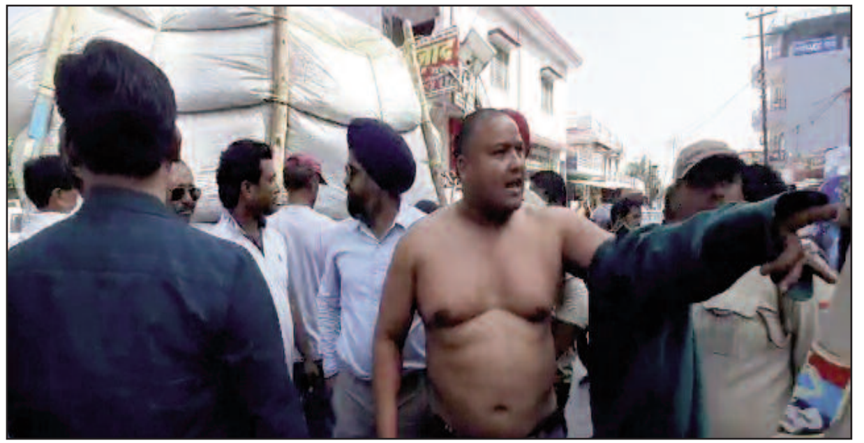
दुर्गापुरी में शराब की दुकान खोले जाने का विरोध करते हुए पार्षद

है। कहा कि यदि दुर्गापुरी क्षेत्र में शराब की दुकान खोली गई तो वह उसी दुकान के बाहर आत्मदाह कर लेंगे। विरोध के दौरान पार्षद ने अपने कपड़े तक उतार लिए