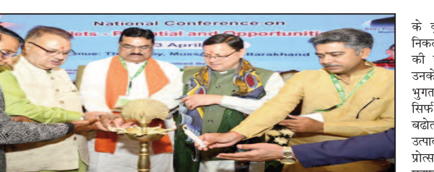
मुख्यमंत्री पुष्कर सिंह धामी दीप प्रज्वलित कर कार्यक्रम का शुभारंभ करते हुए।

जयन्त प्रतिनिधि। देहरादून : मुख्यमंत्री पुष्कर सिंह धामी ने बुधवार को मसूरी के एक होटल में मिलेट्स-2023 के अन्तर्गत आयोजित 'क्षमता और अवसर' राष्ट्रीय सम्मेलन का शुभारंभ किया। मुख्यमंत्री ने विभिन्न राज्यों से आये अतिथियों का स्वागत किया। उन्होंने कहा कि इस कार्यक्रम में विशेषज्ञों द्वारा जो मंथन किया जायेगा अंतरराष्ट्रीय मिलेट वर्ष को सफल बनाने में यह कारगर सिद्ध होगा। मुख्यमंत्री ने कहा कि एक ओर मिलेट्स किसानों के लिए अपनी कम लागत क्षमता के कारण उपयोगी हैं वहीं ये पोषक तत्वों से भरपूर होने के कारण आज के बदलते परिवेश में हम सबके लिए भी अति आवश्यक हैं। मुख्यमंत्री ने प्रदेशवासियों से आह्वान किया कि लोक पूर्वा और त्योहारों में मिलेट उत्पादों का उपयोग अवश्य करें। मुख्यमंत्री ने कहा कि हमारे लिए बड़े गर्व का विषय है कि