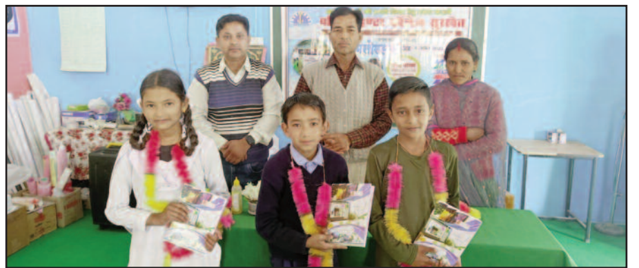
पब्लिक इंटर कालेज सुरखेत में विद्यार्थियों को सम्मानित करते प्रधानाचार्य

पब्लिक इंटर कालेज सुरखेत में मनाया गया प्रवेशोत्सव