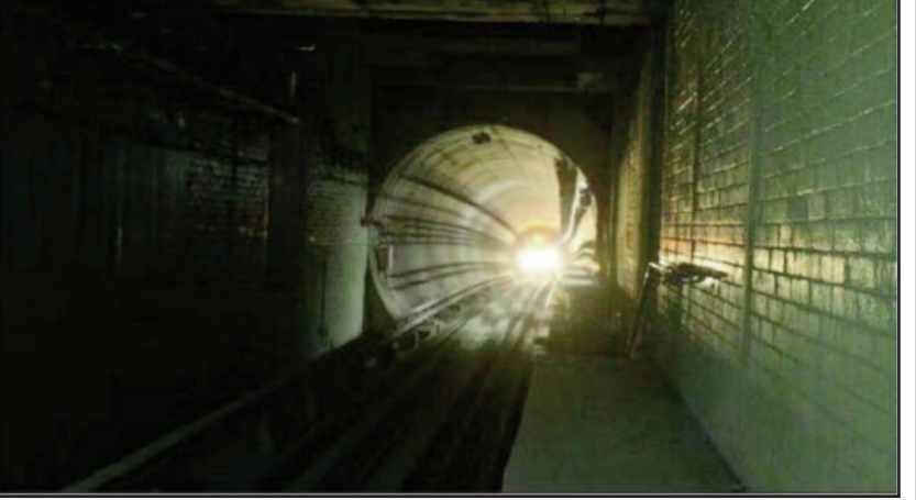
एक बार यह खंड खुल गया तो हावड़ा देश का सबसे गहरा मेट्रो स्टेशन (सतह से 33 मीटर नीचे) हो जाएगा। मेट्रो के 45 सेकंड में हुगली नदी के नीचे 520 मीटर के हिस्से को कवर करने की उम्मीद है। नदी के नीचे बनी यह सुरंग जलस्तर से 32 मीटर नीचे है।

कोलकाता और उपनगणों के लोगों को एक आधुनिक परिवहन प्रणाली प्रदान करने की दिशा में यह एक अतिरिक्त कदम है। यह वास्तव में बंगाल के लोगों के लिए भारतीय रेलवे की ओर से बांग्ला नववर्ष पर एक विशेष तोहफा है। दो मेट्रो रैक को आज कोलकाता के एस्पलेनेड स्टेशन से हावड़ा मैदान स्टेशन ले जाया गया। जल्द ही हावड़ा मैदान से एस्पलेनेड तक 4.8 किलोमीटर के भूमिगत खंड पर ट्रायल रन शुरू होगा। उम्मीद है कि इस खंड पर वाणिज्यिक सेवाएं इसी साल शुरू हो जाएंगी।