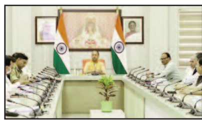
बल्कि जो कोविड पॉजिटिव मरीज मिल रहे हैं, उनकी स्थिति भी सामान्य है। स्वास्थ्य विशेषज्ञों के अनुसार यह स्थिति घबरावने की नहीं सतर्क है। यहां न केवल पॉजिटिविटी दर कम है,

लखनऊ, एजेंसी। देश में बढ़ते कोरोना के नए मामलों के बीच मुख्यमंत्री योगी आदित्यनाथ ने बुधवार को राज्य स्तरीय कोविड सलाहकार समिति और उच्चस्तरीय टीम-9 के साथ प्रदेश की स्थिति की समीक्षा की और व्यापक जनहित में आवश्यक दिशा-निर्देश दिए। उन्होंने कहा कि बीते कुछ समय से देश के विभिन्न राज्यों में कोविड के मामलों में बढ़ोतरी देखी जा रही है। वर्तमान में देश में 38 हजार से अधिक एक्टिव केस हैं, हालांकि उत्तर प्रदेश में स्थिति नियंत्रण में है। यहां न केवल पॉजिटिविटी दर कम है,