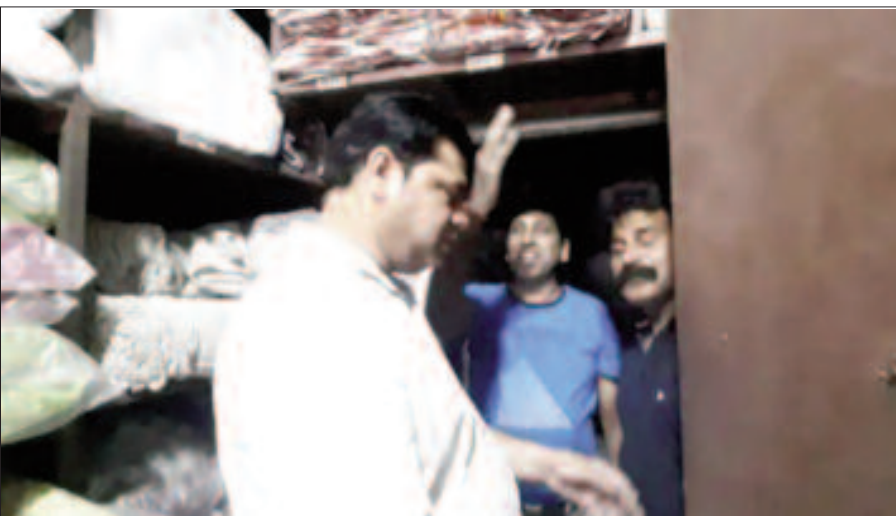
कोटद्वार में पॉलीथिन के खिलाफ अभियान चलाती निगम की टीम

नगर निगम ने सिंगल यूज प्लास्टिक व पॉलीथिन के खिलाफ चलाया अभियान