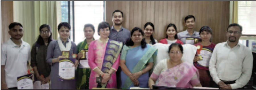
महाविद्यालय में आयोजित सम्मान कार्यक्रम में मौजूद विद्यार्थी

जयन्त प्रतिनिधि। कोटद्वार : डॉ. पीताम्बर दत्त बड़थवाल हिमालयन राजकीय स्नातकोत्तर महाविद्यालय कोटद्वार के गणित परिषद के तत्वाधान में आयोजित प्रतियोगिताएं एवं राष्ट्रीय गणित दिवस पर आयोजित मैथमेटिक्स विजय प्रतियोगिता के विजयी प्रतिभागियों को सम्मानित किया गया।