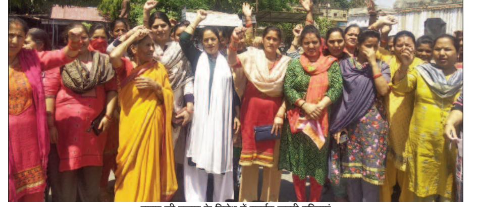
शराब की दुकान के विरोध में प्रदर्शन करती महिलाएं