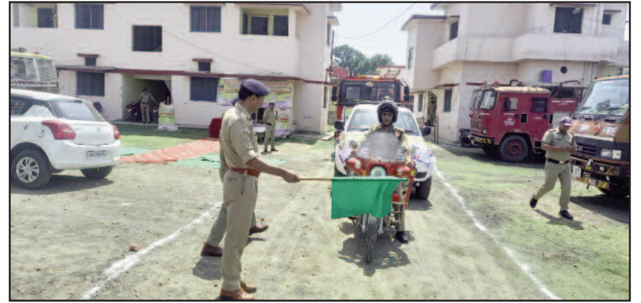
कोटद्वार के दमकल विभाग से निकाली जा रही रैली को हरी झंडी दिखाते एएसपी

करने के लिए प्रत्येक वर्ष अग्निशमन विभाग की ओर से सेवा सप्ताह मनाया जाता है, इसके तहत क्षेत्रों में आग से बचाव के लिए व्यापक प्रचार-प्रसार किया जाता है। साथ ही स्कूलों व अन्य सार्वजनिक स्थानों पर जागरूकता संबंधी कार्यक्रम भी आयोजित किए जाएंगे। प्रथम दिन बीईएल रोड कौडिया रोड, नजीबाबाद रोड, झंडाचौक सहित अन्य स्थानों पर जागरूकता रैली निकाली गई।