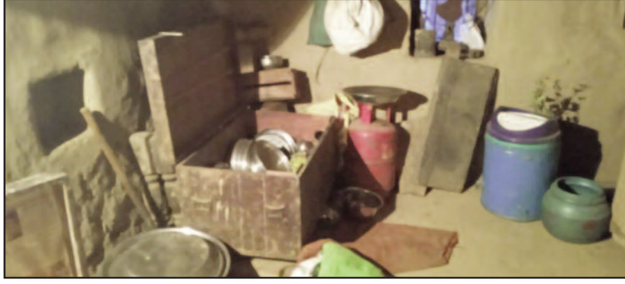
एकेश्वर प्रखंड के अंतर्गत नौगांव में चोरो द्वारा घर के भीतर फैलाया गया सामान