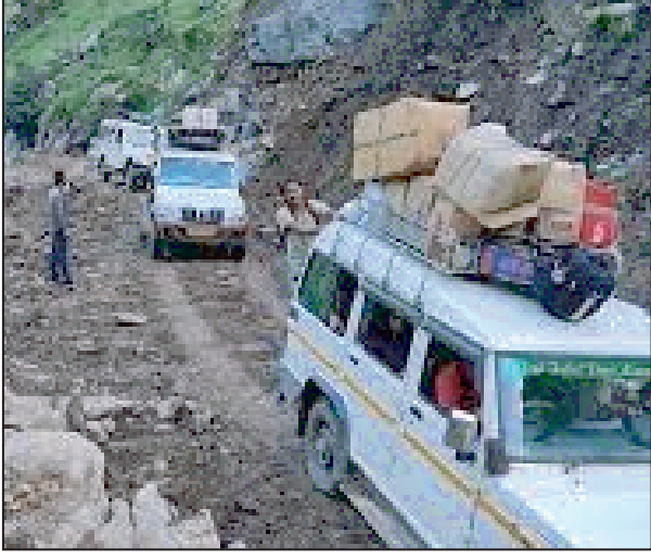
शामिल होकर बड़ी संख्या में लोग धारचूला की तरफ लौट रहे थे। शाम

16 घंटे बाद अगले दिन सड़क खुली तब यात्री कहीं जाकर अपने-अपने गंतव्य को रवाना हुए। धारचूला-लिपुलेख राष्ट्रीय राजमार्ग के दोबाट में दिन दिनों सड़क चौड़ीकरण का कार्य चल रहा है। बीते रविवार को गुंजी कार्यक्रम में