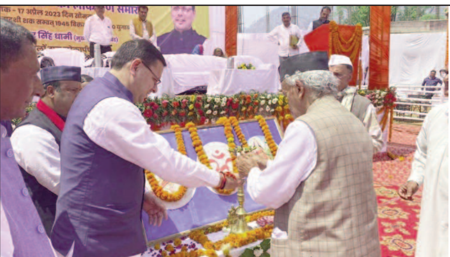
सीएम पुष्कर सिंह धामी एवं पूर्व राज्यपाल भगत सिंह कोशयारी कार्यक्रम का दीप प्रज्वलित कर शुभारंभ करते हुए।

देहरादून : मुख्यमंत्री पुष्कर सिंह धामी ने कहा कि आने वाले 10 वर्ष उत्तराखण्ड की उन्नति के होंगे। उन्होंने इसके लिये सभी विभाग को विकास के लक्ष्य निर्धारित कर उस दिशा में कार्य करने को कहा। कहा कि विकास की दृष्टि से उत्तराखण्ड को देश के अग्रणी राज्यों में शामिल करना हमारा लक्ष्य है। मुख्यमंत्री ने छात्र-छात्राओं से अपेक्षा की कि वे अपने जीवन में जो भी लक्ष्य चुनें उसमें पूर्ण मनोयोग से कार्य करें। यदि हम किसी कार्य को पूरी ईमानदारी एवं कर्तव्यनिष्ठा से करते हैं, तो उसमें सफलता अवश्य मिलती है। उन्होंने कहा कि जो भी अपना कार्यक्षेत्र चुनें, उसमें लीडर की भूमिका में रहें।