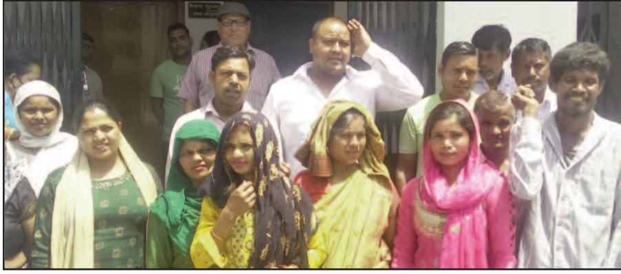
कोटद्वार नगर निगम परिसर में प्रदर्शन करते लोग

खूनीबड़, शिवराजपुर, मोटाढांक के लोगों ने नगर निगम परिसर में किया प्रदर्शन