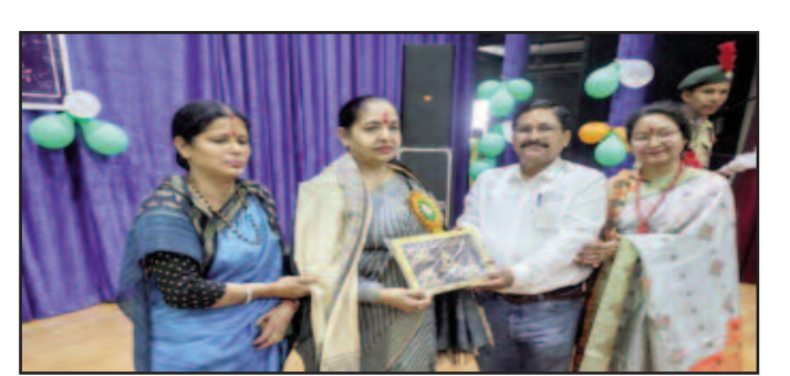
राज्यसभा सांसद डॉ. कल्पना सैनी को स्मृति चिह्न भेंट करते हुए।

जयन्त प्रतिनिधि। पौड़ी : राजमती देवी सरस्वती विद्या मंदिर इंटर कॉलेज तिमली के वार्षिकोत्सव समारोह में राज्यसभा सांसद डॉ. कल्पना सैनी ने मुख्य अतिथि के रूप में प्रतिभाग क्षेत्र में बच्चों को कड़ी मेहनत करने की आवश्यकता है। कहा कि विद्या भारती की स्कूलों में अच्छी शिक्षा ही नहीं बल्कि उच्च संस्कार भी दिए जाते हैं। सोमवार को प्रेक्षागृह में आयोजित कार्यक्रम का शुभारंभ मां सरस्वती के समक्ष दीप प्रज्वलित कर राज्यसभा सांसद डॉ. कल्पना सैनी ने किया गया। इसके बाद बच्चों ने स्वागत गीत, गणेश वंदना के साथ ही सांस्कृतिक नृत्य प्रस्तुत किए। कार्यक्रम में मुख्य अतिथि को स्मृति चिह्न देकर सम्मानित किया गया। इस दौरान उन्होंने अपने विचार व्यक्त करते हुए कहा कि सकारात्मक विचारों से ही जीवन में खुशी प्राप्त होती है। बच्चे सकारात्मक सोच