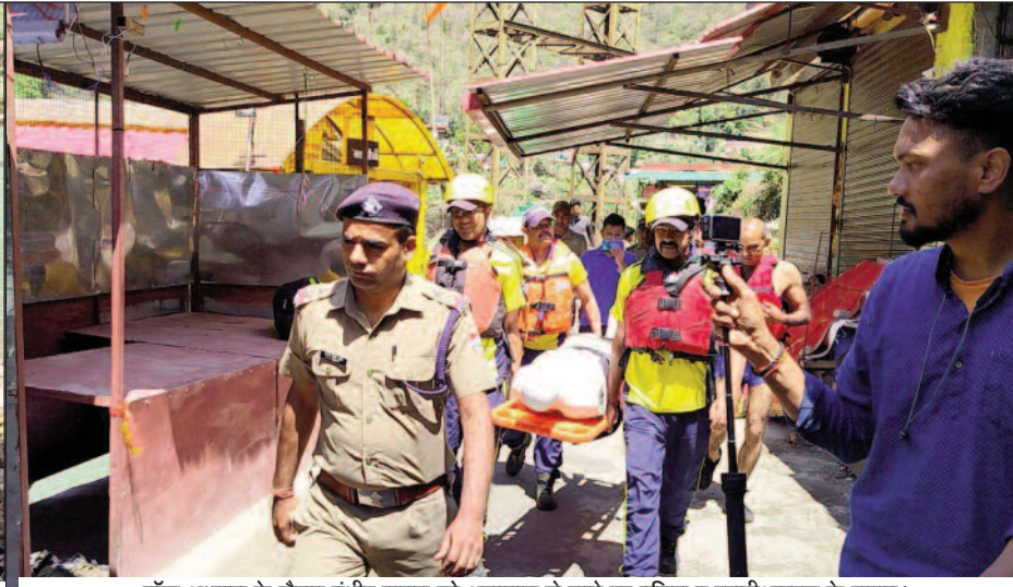
मॉक अभ्यास के दौरान गंभीर घायल को अस्पताल ले जाते हुए पुलिस व एएसडीआरएफ के जवान।