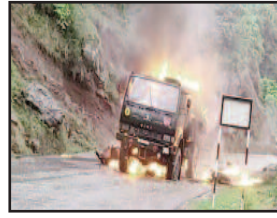
हुआ। इस घटना का एक वीडियो भी सामने आया है। उन्होंने बताया कि पुंछ-जम्मू नेशनल हाईवे पर सैन्य वाहन कुछ सामान लेकर जा रहा था।

जम्मू, एजेंसी। जम्मू-कश्मीर के पुंछ जिले में सैन्य वाहन में आग लगने से पांच जवानों की जान चली गई। अचानक हुए इस हादसे के बाद मौके पर सैन्य और पुलिस अधिकारी मौके पर पहुंचे। उन्होंने आसपास के लोगों के साथ मिलकर वाहन में लगी आग बुझाकर राहत और बचाव अभियान चलाया।