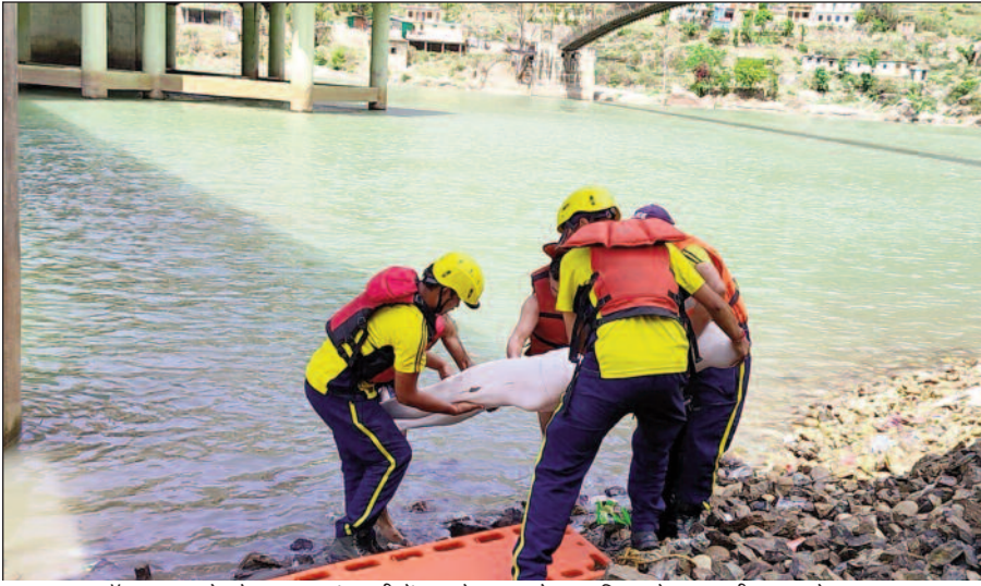
मॉक अभ्यास के दौरान अलकनंदा नदी में बह रहे युवक को बाहर निकालते हुए एएसडीआरएफ के जवान।