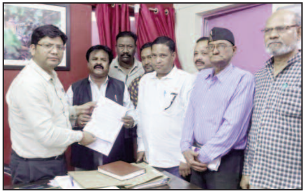
उपजिलाधिकारी के माध्यम से राज्यपाल को ज्ञापन भेजते सदस्य

इस संदर्भ में उप जिलाधिकारी के माध्यम से राज्यपाल को प्रेषित ज्ञापन में उन्होंने कहा है कि कोटद्वार अस्पताल से पहाड़ तथा भाबर सहित क्षेत्रीय जनता को चिकित्सा सेवा मिलती है। चिकित्सालय में 6 से 8 सौ मरीज प्रतिदिन उपचार हेतु आते हैं, लेकिन चिकित्सालय में अधिकांश पदों के रिक्त होने के कारण मरीजों को उचित स्वास्थ्य सुविधाएं प्राप्त नहीं हो पा रही हैं। चिकित्सालय