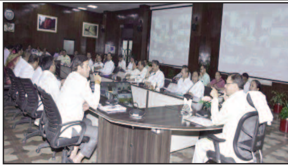
मुख्यमंत्री पुष्कर सिंह धामी सचिवालय में बैठक को संबोधित करते हुए।

देहरादून : विभागीय अधिकारी विधानसभा क्षेत्रों की प्रमुख समस्याओं को गंभीरता से लेते हुए, उनका समाधान करें। राज्य के समग्र विकास के लिए सबको एकजुट होकर कार्य करना होगा। जिलाधिकारी भी जनपदों में समय-समय पर विधायकों के साथ बैठक कर उनके क्षेत्रों की समस्याओं का समाधान करें। यह निर्देश मुख्यमंत्री पुष्कर सिंह धामी ने सचिवालय में विधानसभा क्षेत्र यमुनोत्री, बद्रीनाथ, प्रतापनगर, चक्रगता, ज्वालापुर, भगवानपुर, झबरेड़ा, पिरान कलियार, मंगलौर, लक्सर, खानपुर एवं हरिद्वार ग्रामीण की समीक्षा के दौरान अधिकारियों को दिये।