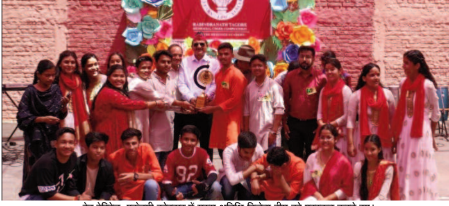
हेड हेरिटेज एकेडमी कोटद्वार में मुख्य अतिथि विजेता टीम को पुरस्कृत करते हुए।

प्रतियोगिता में डीपी पब्लिक स्कूल कोटद्वार, सेंट जोसेप कान्वेंट कोटद्वार, हैप्पी होम स्कूल कोटद्वार, जीआईसी कुंभीचौड़, डीपीएस बिजनौर, क्रिस्ट जयंती स्कूल नजीबाबाद के प्रतिभागियों ने भाग लिया।