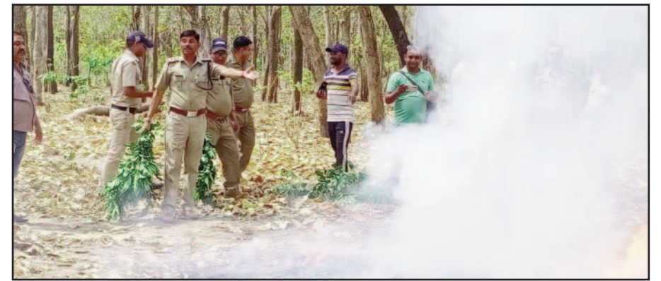
कोटद्वार में वन कर्मियों को आग पर काबू पाने के तरीके सिखाते दमकल कर्मी

सबसे अधिक नुकसान पहुंचता है। पर्यावरण संरक्षण के लिए समाज के प्रत्येक व्यक्ति को कार्य करना होगा। इसके उपरांत दमकल विभाग ने विभिन्न स्कूलों में जाकर विद्यार्थियों को आग व आपदाओं के प्रति जागरूक किया। कहा कि हमें जानकारी को अधिक से अधिक लोगों तक पहुंचाने का प्रयास करना चाहिए। जागरूकता ही आपदा से बचाव का तरीका है।