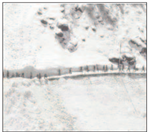
कॉलोनी क्षतिग्रस्त हो गई है। यहाँ 150 से अधिक टेंट लगाए थे जिसमें दो हजार यात्रियों के ठहरने की व्यवस्था थी लेकिन यहाँ दो फीट से अधिक बर्फ गिरने से ज्यादातर टेंट क्षतिग्रस्त हो गए हैं।

धाम में बर्फबारी से गढ़वाल मंडल विकास निगम की टेंट