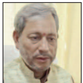
कोटद्वार में पत्रकारों से वार्ता करते गढ़वाल सांसद तीरथ सिंह रावत ।

शुक्रवार को लोनिवि गेस्ट हाउस में पत्रकारों से रूबरू होते हुए सांसद तीरथ सिंह रावत ने कहा कि वे बाघ प्रभावित क्षेत्र का दौरा करके आये हैं। बताया कि ग्रामीणों को इसकी भी तरह की दिक्कत न हो इसके निर्देश डीएम पौड़ी को दिए गए हैं। सांसद रावत ने कहा कि कोटद्वार गढ़वाल का प्रवेश द्वार है और इसका विकास होना बेहद जरूरी है।