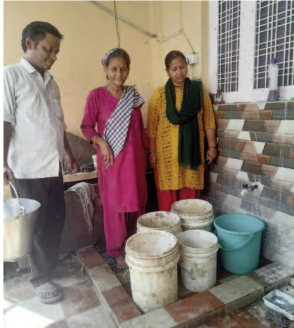
कोटद्वार के पदमपुर क्षेत्र में पानी के इंटरजार में नल के समीप खड़े हुए बर्तन