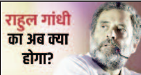
राहुल गांधी का अब क्या होगा?