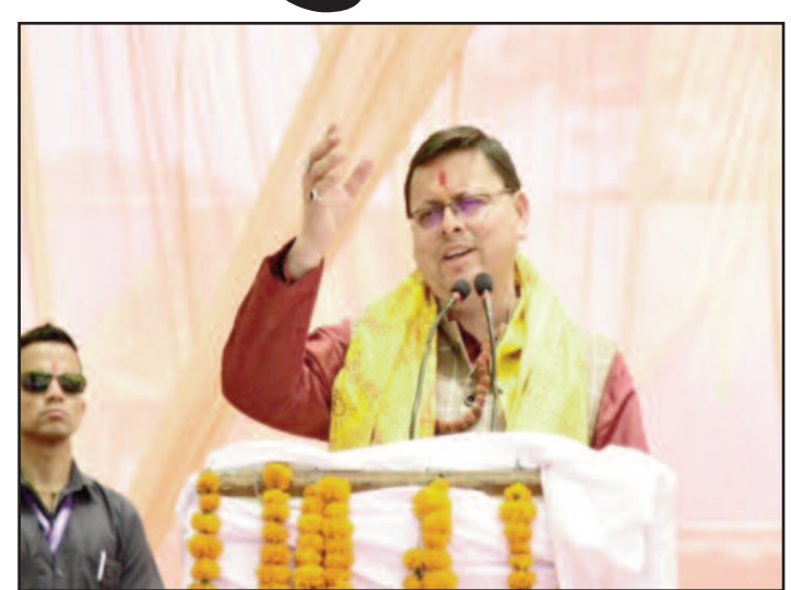
सीएम पुष्कर सिंह धामी ऋषिकेश में कार्यक्रम को संबोधित करते हुए।

सुविधा उपलब्ध कराई जाए, ताकि वे भविष्य में बार-बार उत्तराखंड आने का मन बनाएं, जिससे हमारे पर्यटन उद्योग को बढ़ावा मिल सके। इस बार सरकार की तरफ से चारधाम यात्रा पर आने वाले श्रद्धालुओं के स्वागत में "हेलीकॉप्टर से पुष्पवर्षा" करने का भी निर्णय लिया गया है। हंस फाउंडेशन की संरक्षक माता मंगला ने कहा कि इस वर्ष राज्य सरकार से समन्वय बनाकर हंस फाउंडेशन द्वारा चार धाम के प्रत्येक पड़ाव में विभिन्न प्रकार के सेवा कैंप लगाए गए हैं। चार धामों में स्वास्थ्य सेवाओं का विस्तार