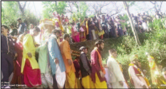
बाबा केदारनाथ की उत्सव डोली को गद्दी स्थल ऊखीमठ से ले जाते हुए भक्त।