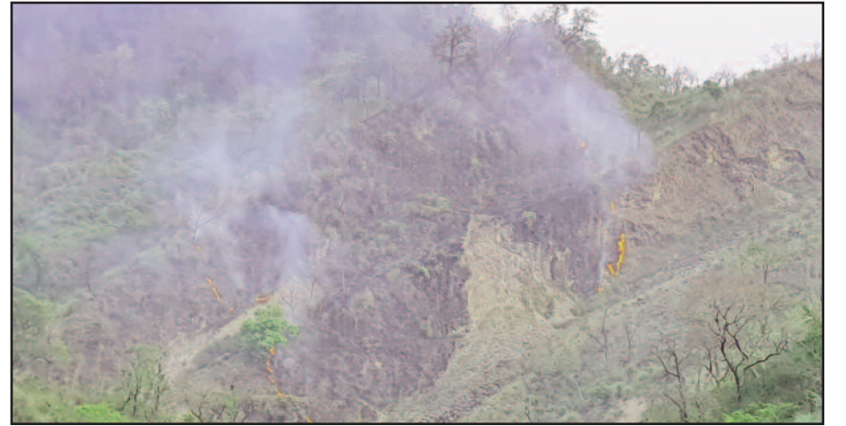
कोटद्वार के सिद्धबली मंदिर के समीप धधकते जंगल

आग जलती रही। जंगल में विकराल हो रही आग से सैकड़ों किलोमीटर में फैली वन संपदा जलकर खाक हो गई। वहीं, जंगल की आग से चारों ओर धुएँ का गुब्बारा उठा हुआ था। ऐसे में सिद्धबली मंदिर के आसपास रहने वाले लोगों को भी काफी परेशानियों का सामना करना पड़ा।