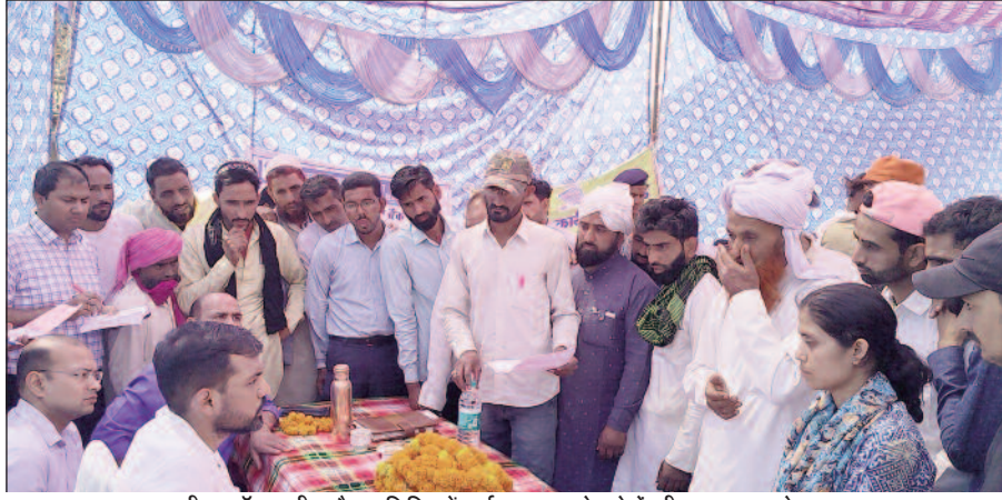
डीएम डॉ. आशीष चौहान शिविर में गुर्जर समुदाय के लोगों की समस्या सुनते हुए।

जयन्त प्रतिनिधि। पौड़ी : जिलाधिकारी डॉ. आशीष चौहान की अध्यक्षता में तहसील यमकेश्वर के अंतर्गत कुनाड चौड़ क्षेत्र में बहुउद्देशीय शिविर का आयोजन किया गया। शिविर में जिलाधिकारी के समक्ष ही पशुपालन विभाग द्वारा 150 से अधिक पशुधन का टीकाकरण किया गया। शिविर में स्थानीय लोगों के 108 जन्म प्रमाण पत्र, 23 राशन कार्ड तथा 34 आधार कार्ड बनाये गये।