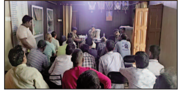
कोटद्वार कोतवाली में ई-रिक्शा संचालकों की बैठक लेते अपर पुलिस अधीक्षक