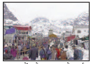
श्रद्धालुओं को सुगमता से दर्शन कराए जा रहे हैं।

नई दिल्ली, एप्रैल। प्रधानमंत्री नरेंद्र मोदी ने वीडियो कॉन्फ्रेंसिंग के जरिए भारत में रेडियो कनेक्टिविटी बढ़ाने के लिए 91 एफएम ट्रॉसमीटरों का उद्घाटन किया। प्रधानमंत्री ने वीडियो कॉन्फ्रेंस के माध्यम से 100 बॉट के इन ट्रॉसमीटरों की शुरुआत की। इन ट्रॉसमीटरों को 18 राज्यों और 2 केंद्रशासित प्रदेशों के 84 जिलों में स्थापित किया गया है। इन्होंने कहा कि आज ऑल इंडिया रेडियो की रफ्तार से वा के विस्तार ऑल इंडिया रफ्तार बनने की दिशा में एक महत्वपूर्ण कदम है। ऑल इंडिया रेडियो के 91 एफएम ट्रॉसमिशन की ये शुरुआत देश के 85 जिलों के 2 करोड़ लोगों के लिए उपहार की तरह है। पीएम मोदी ने कहा कि अभी कुछ दिन बाद ही मैं रेडियो पर 'मन की बात' का 100वां एपिसोड करने जा रहा हूँ। 'मन की बात' का ये अनुभव, देशवासियों से इस तरह का भावनात्मक जुड़ाव केवल रेडियो से ही संभव था। मैं इसके जरिए देशवासियों के सामर्थ्य से और सामूहिक कर्तव्यशक्ति से जुड़ा रहा इस अवसर पर प्रधानमंत्री ने कहा कि आकाशवाणी की एफएम सेवा का विस्तार अखिल भारतीय एफएमइ बनने की दिशा में एक बड़ा और महत्वपूर्ण कदम है।