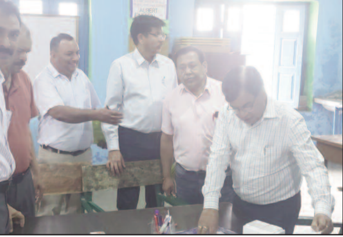
राजकीय इंटर कालेज कोटद्वार में सेंटर का निरीक्षण करते अधिकारी

जयन्त प्रतिनिधि कोटद्वार : राजकीय इंटर कालेज कोटद्वार में उत्तराखंड बोर्ड की हाईस्कूल व इंटर परीक्षाओं का मूल्यांकन कार्य शुकुवार को 14वें दिन भी जारी रहा। अब तक नब्बे प्रतिशत से अधिक उतर पुस्तिकाओं का मूल्यांकन कार्य पूर्ण हो चुका है। राईका कोटद्वार स्थित केंद्र पर 15 अप्रैल से मूल्यांकन कार्य चल रहा है। करीब 250 से भी अधिक परीक्षक व अंकेक्षक मूल्यांकन कार्य में जुटे हैं। मूल्यांकन केंद्र पर हाई स्कूल व इंटर की कुल 75611 उतर पुस्तिकाओं में से अब तक 72221 (90 प्रतिशत) उतर पुस्तिकाओं का मूल्यांकन कार्य पूर्ण हो चुका है। शुकुवार को नियंत्रक व मुख्य शिक्षा