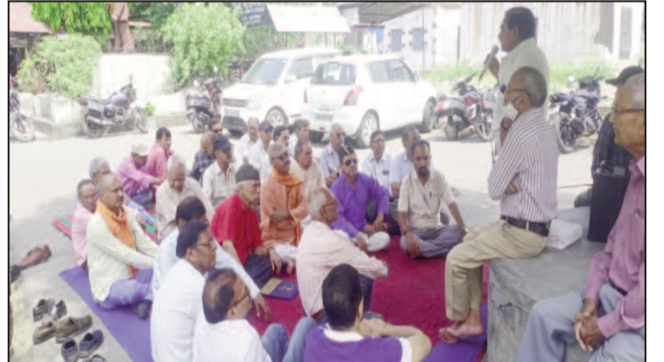
कोटद्वार तहसील में धरना देते नागरिक मंच के सदस्य

जयन्त प्रतिनिधि कोटद्वार : गढ़वाल के प्रवेश द्वार कोटद्वार में व्याप्त विभिन्न समस्याओं को लेकर शुकुवार से नागरिक मंच ने तीन दिवसीय धरना शुरू कर दिया है। समस्याओं का निराकरण नहीं होने पर मंच ने दो मई को रेल रोका आंदोलन भी चलाने की चेतावनी दी है। इस दौरान विभिन्न संगठनों ने मंच को अपना समर्थन दिया।