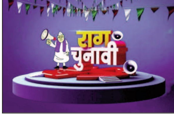
स्मृति में आ रहे हैं। इसके लिए अबकी बार वे नये वादों के साथ-साथ भावनात्मक मायाजाल का भी सहारा लेने से नहीं चूक रहे हैं। जहां जाते हैं, वहीं के मूल निवासी बनने का पूरा प्रयास करते हैं। कई बार तो वे अपनी आधी उम्र के मतदाताओं के चरणों में नतमस्तक हो जाते हैं, अनजान लोगों के बीच बैटकर लम्बी चर्चा करने लगते हैं। जो हमेशा आरओ का बोलचाल बंद पानी की ही हाथ लगाते हैं, वे आजकल वोट की गुहार करते-करते रास्ते में सड़क किनारे की प्याऊसे प्यास बुझाते देखे जा सकते हैं। हतना ही नहीं, उनको वोट के लिए राह चलती बारात में थिरकते हुए भी देखा जा सकता है। कड़ी धूप में जलसां का प्रतिनिधित्व भी बिना किसी शिकन के करते हुए पाये जाते हैं। शोकसभा हो या शवयात्रा, अपनी उपस्थिति सोशल मीडिया पर अवश्य साझा कर कृत्रिम संवेदना व्यक्त करने में पीछे नहीं रहते हैं। अब चूंकि चुनाव का शंखनाद हो चुका है, वोटों की फसल काटने का मौसम जागो पर है, इसलिए वे भी आम जनता के बीच लौटने का आतुर हैं, ताकि फिर से जनता के रद्दुमा बनकर अपनी राजनीतिक जमीन को बचा सकें। यही कारण है कि वे अब जनता के बीच जाने का पूर्ण मन बना चुके हैं, ताकि लोकतंत्र के साथ-साथ अपनी जड़ें भी मजबूत कर सकें।

वे पांच साल तक सत्ता का उपभोग कर राजधानी के सरकारी आवास में मुफ्त की सुविधाओं का लुपट लेते रहे, अब जबकि चुनाव सन्निकट है, वे जनता की ओर लौटने का मन बना रहे हैं। हालांकि, कमरतोड़ महंगाई से आम जनता की कंडीशन बिगड़ती रही, मगर उन्होंने अपने एयर कंडीशन आशियाने से बाहर आने की जहमत नहीं उठाई। पड़े-लिखे नैजवान स्कूल-कॉलेजों में लाखों की फीस भरने के बाद नौकरी की गुहार लगाते रहे। भूखे-प्यासे धरने पर बैठे रहे, लेकिन बेरोजगारों को अपने हाल पर छोड़ दिया गया। देश का किसान कभी प्रकृति की मार से तो कभी फसलों के औने-पौने दाम से परेशान होता रहा, पर उन्होंने संवेदनशीलता नहीं दिखाई। लोकतंत्र में चुनाव एक आवश्यक प्रक्रिया है, अगर हरे पांच साल में जनता अपने मताधिकार का उपयोग करती है, इसलिए तमाम दूरियों और असमानता के बावजूद जनता के बीच जाना उनकी मजबूरी है। इसलिए न चाहते हुए भी तंग बस्तियों, धूल भरी सड़कों और गांव की गलियों की ओर लौटना ही पड़ता है। पांच बरस पहले जिन वादों को लेकर वे क्षेत्र के लोगों के बीच गए थे, वे रह-रह कर उनकी