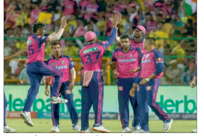
को आईपीएल मैच की मेजबानी करने का मौका मिला है।

इस बार टूर्नामेंट को 12 शहरों में आयोजित किया जा रहा है। अहमदाबाद, मोहाली, लखनऊ हैदराबाद, बंगलुरु, चेन्नई, दिल्ली, कोलकाता, जयपुर, मुंबई, गुवाहाटी और धर्मशाला