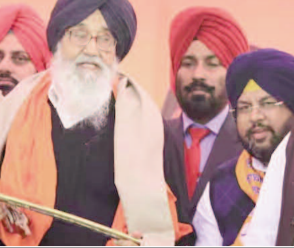
बादल साहब की गौशाला में विशेष रुचि थी और वे तरह-तरह की गायें रखते थे। हमारी एक मुलाकात के दौरान, उन्होंने मुझे बताया कि गिर की गायाँ को पालने की उनकी इच्छा है। मैंने उनके लिए 5 गायाँ की व्यवस्था की और उसके बाद जब भी हम मिलते तो वे मुझसे गायाँ के बारे में बात करते, और मजाक में कहा करते थे कि वे गायाँ हर तरह से गुजरती हैं— क्योंकि वे कभी गुस्सा नहीं करती, उतेजित नहीं होती, या किसी पर हमला नहीं करती, यहां तक कि जब बच्चे खेल रहे होते हैं, तब भी नहीं। वे कहते थे कि गुजरती भी इन गायाँ का दूध पी-पीकर विनम्र होते हैं। 12001 के बाद, मुझे बादल साहब के साथ एक अलग रूप में बातचीत करने का मौका मिला— अब हम अपने-अपने राज्यों के मुख्यमंत्री थे मुझे विशेष रूप से जल संरक्षण, पशुपालन और डेयरी सहित कृषि से संबंधित कई मुद्दों पर बादल साहब का मार्गदर्शन प्राप्त करने का सौभाग्य प्राप्त हुआ। एक बार उन्होंने मुझसे कहा था कि वे समझना चाहते हैं कि अलग शिपयार्ड में कैसे काम होता है। फिर वे वहां आए और पूरा दिन अलग शिपयार्ड में बिताया और अच्छी तरह समझा कि रिसाईविंग कैसे होती है। पंजाब में 1970 और 1980 के दशक के मुश्किल भरें दौर में

एक जीवंत व्यक्तित्व थे। वे ऐसे गुण थे, जो आखिरी सांस तक उनके साथ रहे। हर कोई, जिसने भी बादल साहब के साथ निकटता से बातचीत की, उनकी बुद्धिमत्ता और हंसमुख स्वभाव का कायल हो गया। 1990 के मध्य और उत्तरार्ध में पंजाब में राजनीतिक माहौल बहुत अलग था। राज्य ने बहुत उथल-पुथल देखी थी और 1997 में चुनाव होने थे। हमारी पार्टियां एक साथ मिलकर लोगों के पास गईं और बादल साहब हमारे नेता थे। उनकी लोकप्रियता और जनता का विश्वास एक प्रमुख कारण था कि लोगों ने हमें शानदार जीत का आशीर्वाद दिया। इतना ही नहीं, हमारे गठबंधन ने चंडीगढ़ में नगरपालिका चुनाव और शहर में लोकसभा सीट भी सफलतापूर्वक जीती। वे उनके नेतृत्व का ही प्रभाव था कि हमारा गठबंधन 1997 से 2017 के बीच 15 साल तक राज्य की सेवा करता रहा। एक किस्सा है, जिसे मैं कभी नहीं भूल सकता। मुख्यमंत्री के पद की शपथ लेने के बाद एक दिन बादल साहब ने मुझसे कहा कि हम अमृतसर जाएंगे, मत्था टेकेंगे और साथ में लंगर चलावेंगे। मैं अमृतसर पहुंच गया और गेस्ट हाउस में अपने कमरे में था, लेकिन जब उन्हें इस बात का पता चला तो वे मेरे कमरे में आए और मेरा सामान उड़ाने लगे। मैंने उनसे पूछा कि वे ऐसा क्यों कर रहे हैं, तो उन्होंने कहा कि आओ मेरे साथ। वे मुझे वहां ले गए, जो कमरा मुख्यमंत्री के लिए अर्वांठित होता है, और फिर उन्होंने कि जिनमें हमेशा रहती थी 12001 के भूकंप के दौरान क्षतिग्रस्त हुए कच्छ के पवित्र लखपत गुरुद्वारे की मरम्मत और जीपीड्वार के प्रयासों के लिए उन्होंने जिस प्रकार से गुजरत सरकार के प्रयासों की सहायता की, वो हमारे लिए बहुत प्रेरणादायी