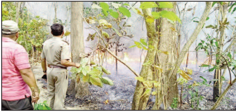
कोटद्वार क्षेत्र के अंतर्गत लालढांग-चिल्लरखाल वन मोटर मार्ग पर जंगल में लगी आग को बुझाने में जुटे दमकल व वन विभाग के कर्मी

जयन्त प्रतिनिधि कोटद्वार : लगातार बढ़ रही गमी का अरार जंगलों पर भी देखने को मिल रहा है। चढ़ रहे पारे के कारण जंगलों में आग लगने की घटनाएं बढ़ने लगी हैं। लालढांग-चिल्लरखाल मोटर मार्ग पर जंगल में लगी आग से सैकड़ों हेक्टर में फैली वन संपदा जल कर खाक हो गई। दमकल व वन विभाग की टीम ने कड़ी मशकत के बाद आग पर काबू पाया।