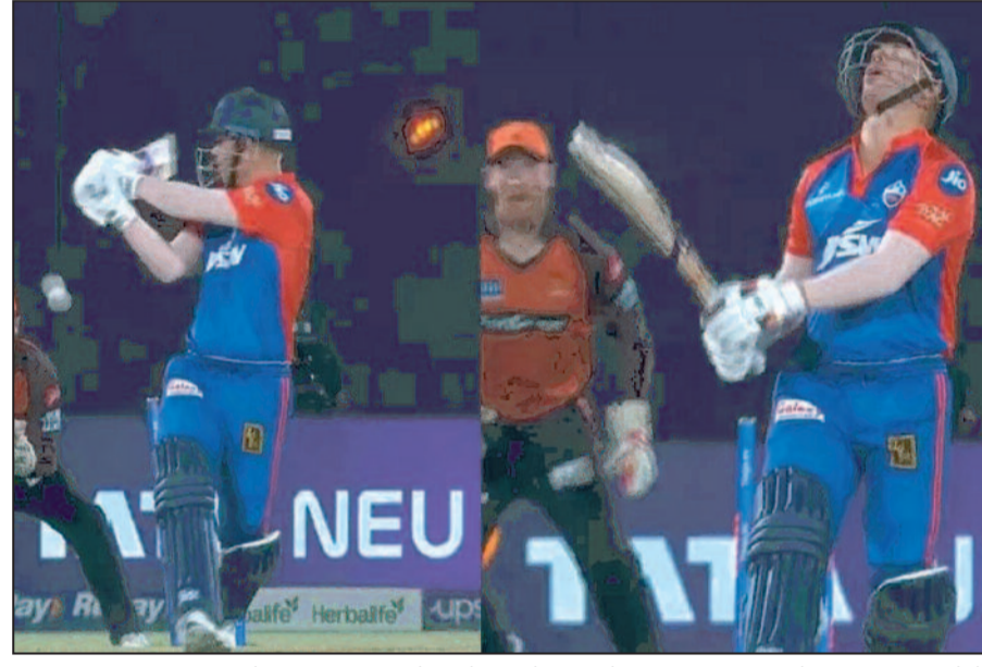
दिल्ली की शुरुआती बल्लेबाजी पहले ओवर में भुवनेश्वर कुमार ने डेविड वॉर्नर को बोलड कर दिया। वो बिना खाता खोले आउट गए।

नई दिल्ली, दिल्ली कैपिटल्स आईपीएल 2023 के 40वें मैच में शनिवार (29 अप्रैल) को दिल्ली के अरुण जेटली स्टेडियम में सनराइजर्स हैदराबाद से भिड़ रही है। हैदराबाद ने टॉस जीतकर पहले बल्लेबाजी करने का फैसला किया है। पहले बल्लेबाजी करते हुए हैदराबाद ने 197 रन बनाए। इस पारी में सलामी बल्लेबाज अभिषेक शर्मा ने 36 गेंदों पर 67 रन की शानदार पारी खेली। वही, हेनरिक क्लासेन ने 27 गेंदों पर शानदार 53 रन की पारी खेली। दोनों बल्लेबाजों की शानदार बल्लेबाजी के बदौलत हैदराबाद ने 20 ओवर में 6 विकेट गंवाकर 197 रन बनाए। भुवी ने वॉर्नर को किया बोलड इस लक्ष्य का पीछा करते हुए