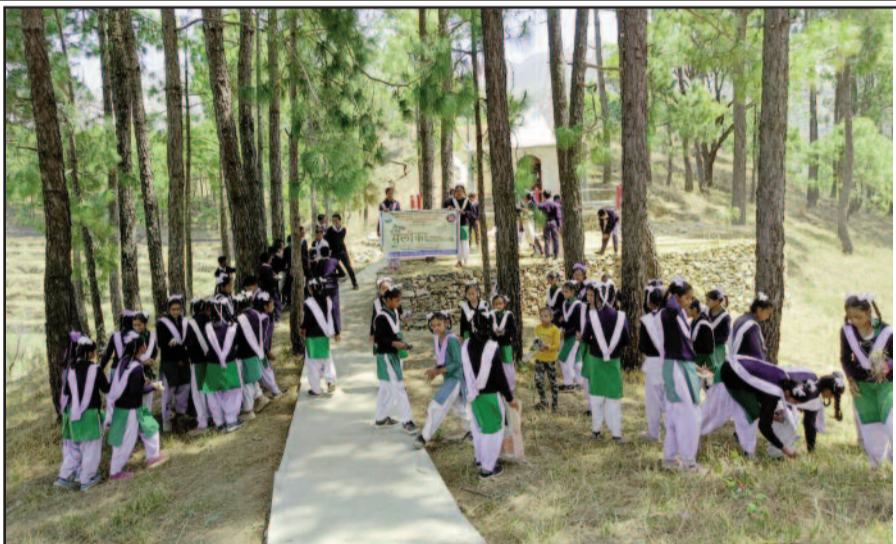
स्वच्छता अभियान चलाने पब्लिक इंटर कॉलेज सुरखेत के विद्यार्थी

सार्वजनिक स्थानों पर कूड़ा डालने के बजाय कूड़ेदान का इस्तेमाल करें। उन्होंने विद्यार्थियों से जानकारी को अधिक से अधिक व्यक्तियों तक पहुंचाने की अपील की। कहा कि देश को