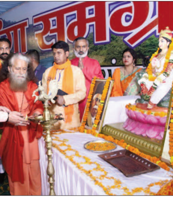
मुख्य अतिथि के रूप में प्रतिभाग कर कार्यक्रम का शुभारंभ किया। उन्होंने कहा कि अविरल गंगा निर्मल गंगा अभियान के तहत गंगा