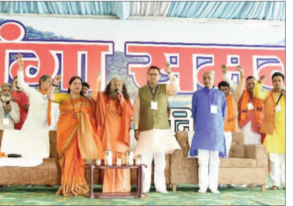
गंदे नालों के पानी को एसटीपी के माध्यम से स्वच्छ किया गया है। जबकि दूसरे चरण के लिए प्रस्ताव प्राप्त हो चुका है। उन्होंने