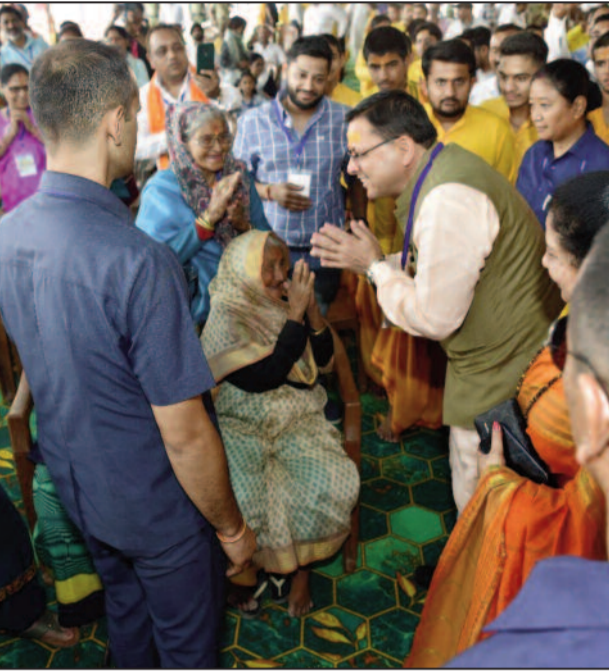
भी शामिल है। मुख्यमंत्री ने कहा कि जीवनदायिनी मां गंगा के मूल स्वरूप को बचाए रखना हम