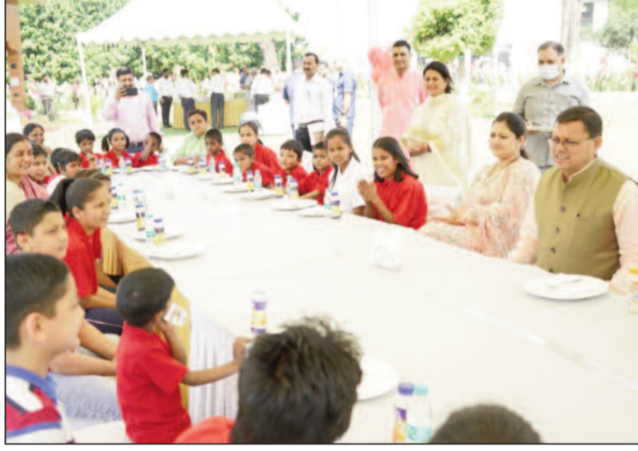
कर, उस पर निरंतर आगे बढ़ते

देहरादून। मुख्यमंत्री पुष्कर सिंह धामी से रविवार को मुख्यमंत्री आवास में शिशु सदन केदारपुरम के बच्चों ने भेंट की। मुख्यमंत्री पुष्कर सिंह धामी ने सभी बच्चों का परिचय प्राप्त किया और उन्हें भोजन कराया। इस अवसर पर शिशु सदन के बच्चों के लिए खेल एवं मनोरंजन की गतिविधियां भी आयोजित की गईं। मुख्यमंत्री पुष्कर सिंह धामी को अपने बीच देखकर बच्चे काफी उत्साहित दिखे। मुख्यमंत्री ने सभी बच्चों को जीवन में हमेशा परिश्रम करने के लिए प्रेरित किया। उन्होंने कहा कि जिस समय जो कार्य करें, उसे पूरे मनोयोग से करें। भविष्य के लिए अपना लक्ष्य निर्धारित कर, उस पर निरंतर आगे बढ़ते