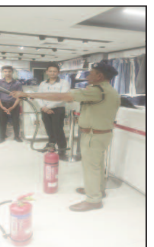
कोटद्वार के एक प्रतिष्ठान में अग्निउपकरण की जानकारी देते दमकल कर्मी।