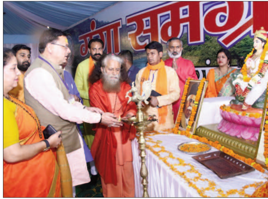
देहरादून। मुख्यमंत्री पुष्कर सिंह धामी ने परमार्थ निकेतन में आयोजित गंगा समग्र अविरल गंगा निर्मल गंगा कार्यक्रम में बतौर