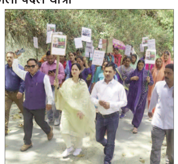
वन विभाग के खिलाफ आक्रोश रैली निकालते ग्रामीण

जानकारी होनी चाहिए। उन्होंने कर्मचारियों को डेमो के माध्यम से आग लगने की घटनाओं व उपकरण काबू पाने के तरीके भी बताए।