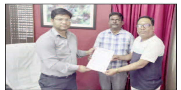
कोटद्वार में उपजिलाधिकारी के माध्यम से मुख्यमंत्री को ज्ञापन भेजते संगठन के सदस्य