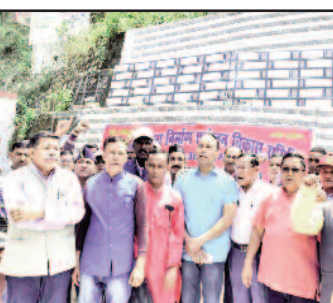
बीरोंखाल को जिला बनाने की मांग उठाते सदस्य व ग्रामीण