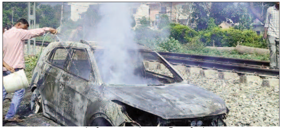
कार में लगी आग पर काबू पाते दमकल कर्मी व स्थानीय लोग

जयन्त प्रतिनिधि। कोटद्वार : काशीगमपुर मल्ला अनूप बिहार के समीप खाली मैदान में खड़ी एक कार में अचानक आग लग गई। कार चालक ऋषिकेश से अपने दोस्त से मिलने कोटद्वार पहुंचा हुआ था। अग्निशमन