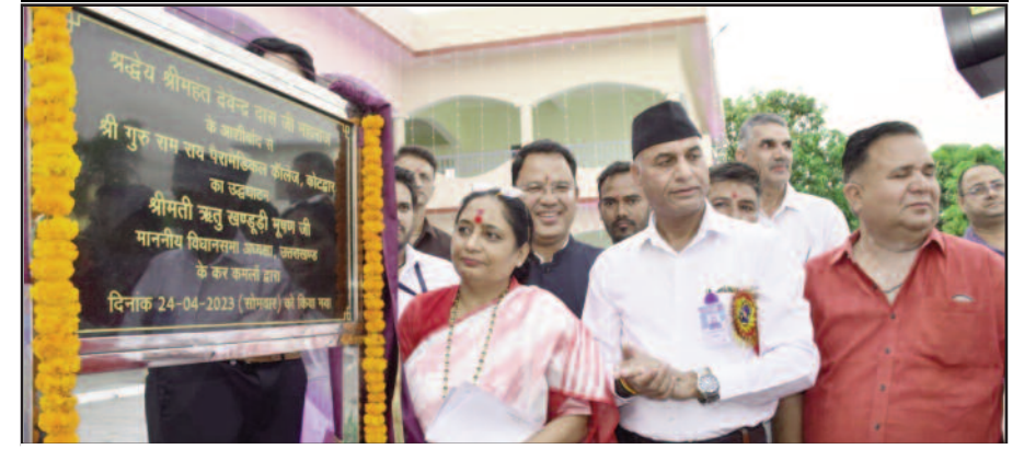
कोटद्वार में पैरामेडिकल कालेज के शिलापट का अनावरण करती विधानसभा अध्यक्ष ऋतु खंडूडी भूषण

कोटद्वार के पदमपुर में पैरा मेडिकल कालेज का हुआ शुभारंभ