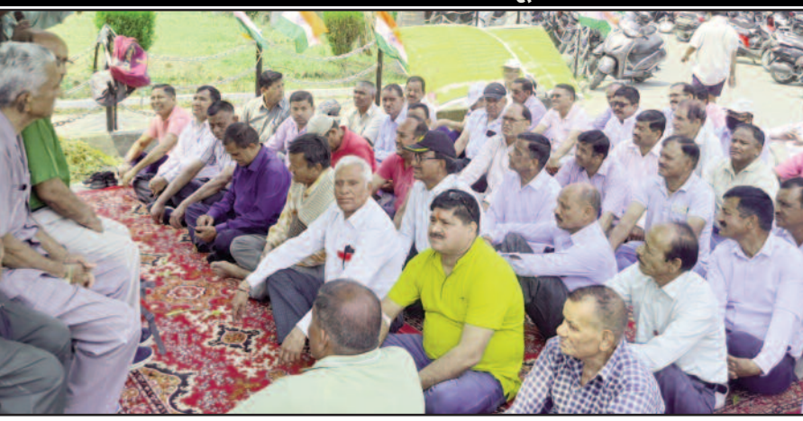
कोटद्वार तहसील में धरना देते पूर्व सैनिक

वन रैंक, वन पेंशन में आई विसंगतियों को दूर करने की उठाई मांग