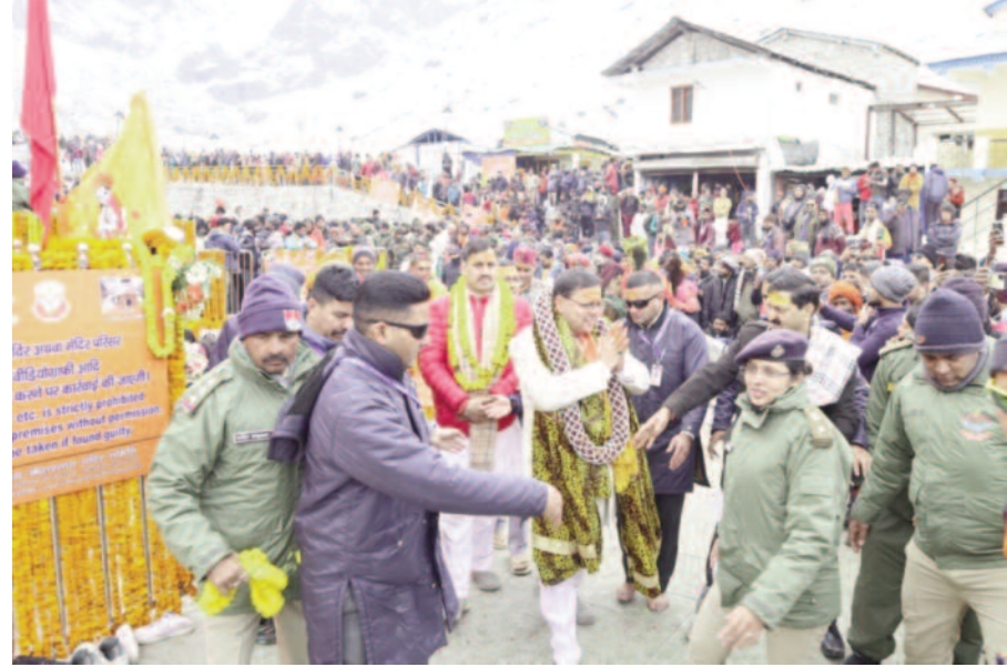
मुख्यमंत्री पुष्कर सिंह धामी केदारनाथ धाम में श्रद्धालुओं का स्वागत करते हुए।

मुख्यमंत्री ने श्री केदारनाथ में की पूजा अर्चना, देश एवं प्रदेश की सुख-समृद्धि की प्रार्थना की