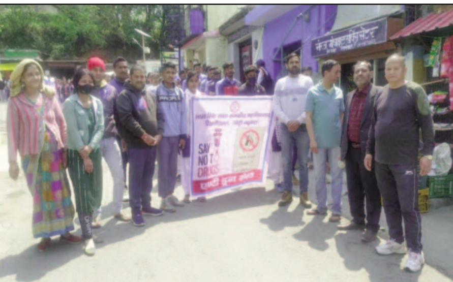
रिखणीखाल में नशे को खिलाफ जागरूकता रैली निकालते विद्यार्थी