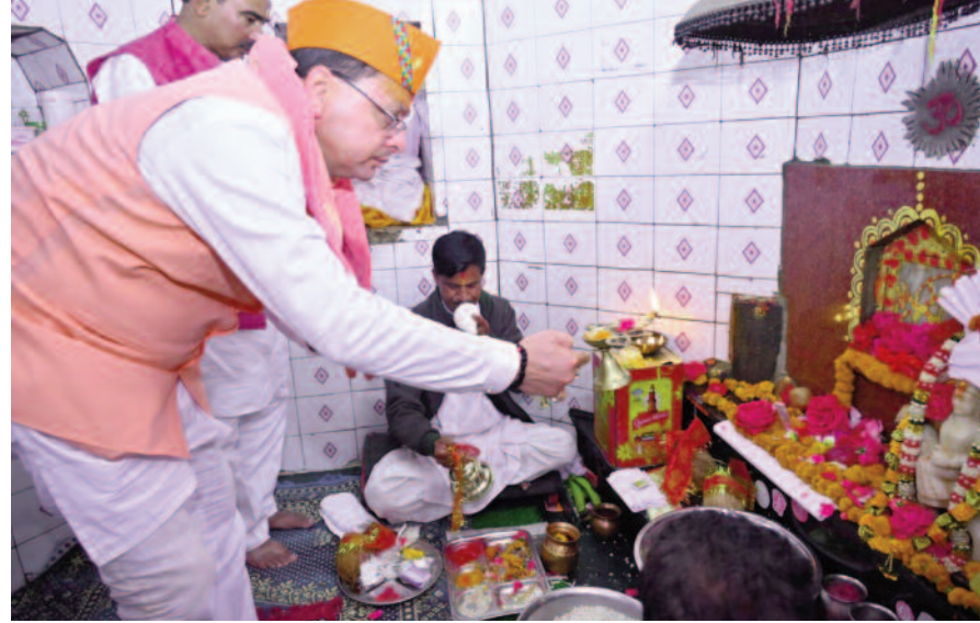
सीएम पुष्कर सिंह धामी गोलजू देवता मंदिर में पूजा करते हुए।