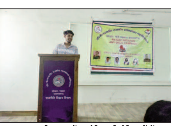
महाविद्यालय में आयोजित प्रतियोगिताओं में प्रतिभाग करते विद्यार्थी