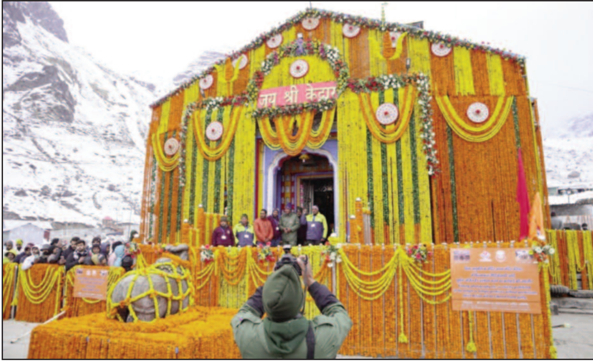
फूलों से सजा हुआ केदारनाथ धाम मंदिर।

बाबा केदार में पहली पूजा प्रधानमंत्री नरेन्द्र मोदी के नाम से की गई