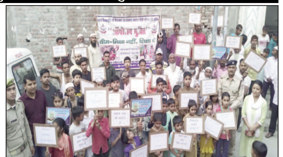
लकड़ीपड़ाव के मोमिन नगर में अभिभावकों व बच्चों को शिक्षा के महत्व को बताती पुलिस

कहा कि बच्चों को शिक्षा से जोड़ने के लिए पुलिस 'भिक्षा नहीं शिक्षा दें' अभियान चला रही है। इसके तहत अब तक सैकड़ों बच्चों का सरकारी विद्यालयों में