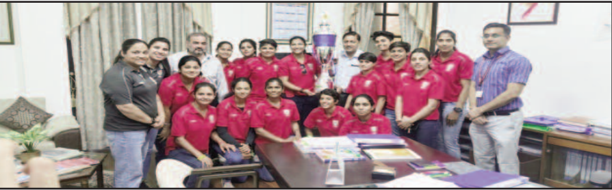
उत्तर रेलवे के महाप्रबंधक 33वीं अखिल भारतीय रेलवे क्रिकेट महिला चैम्पियनशिप की विजेता टीम के साथ।