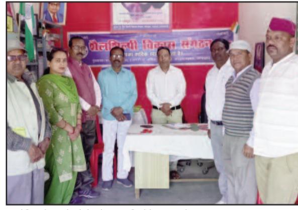
आयोजित बैठक में लोगों को श्रद्धांजलि देते संगठन के सदस्य