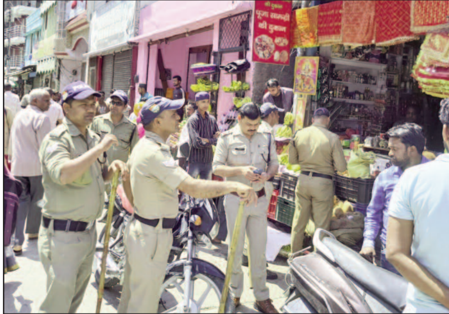
कोटद्वार के गोखले मार्ग में अतिक्रमणकारियों के खिलाफ कार्रवाई करती पुलिस