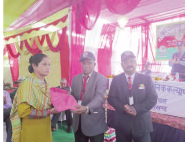
आयोजित कार्यक्रम में वीर नारियों को सम्मानित करते सदस्य