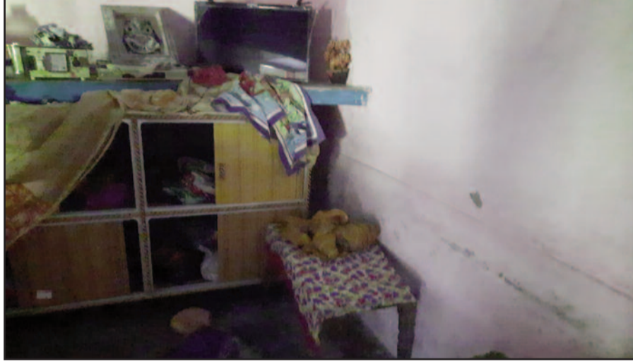
पौखाल के मटगल (बगड़ीगाड़) गांव में चोरों द्वारा खंगाला गया सामान