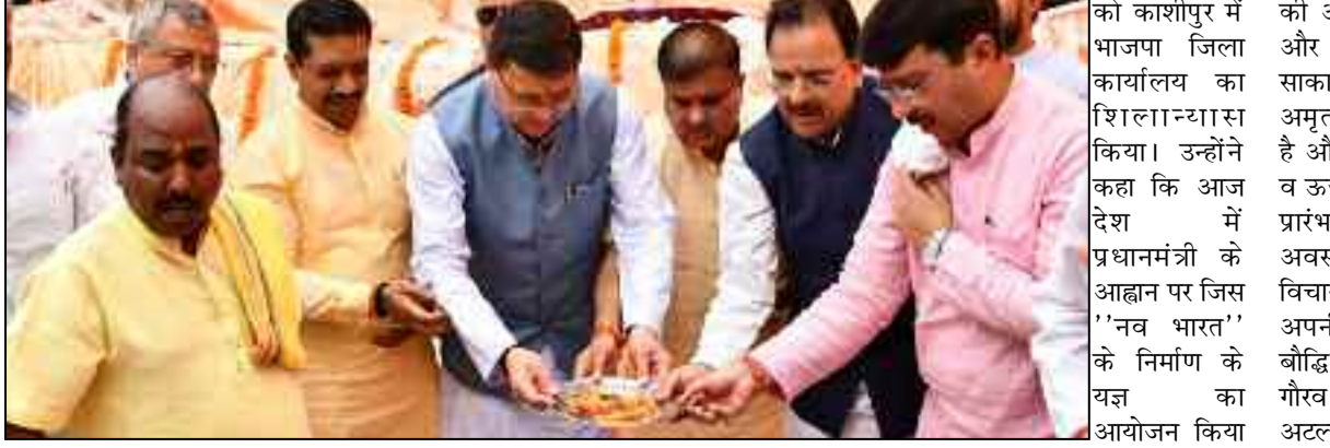
जयन्त प्रतिनिधि। देहरादून : मुख्यमंत्री पुष्कर सिंह धामी ने सोमवार जा रहा है। उसमें हम सभी ने अपने श्रम

की आहुति देनी है तथा 'एक भारत' और 'श्रेष्ठ भारत' के महा संकल्प को साकार करना है। हमारा देश आजादी के अमृत महोत्सव वर्ष में प्रवेश कर चुका है और प्रधानमंत्री नरेन्द्र मोदी के कुशल व ऊर्जावान नेतृत्व में देश में अमृत युग प्रारंभ हो चुका है। मुख्यमंत्री ने इस अवसर पर एकात्म मानववाद के विचारक स्व. दीनदयाल उपाध्याय तथा अपनी आदर्श छवि एवं विशिष्ट बौद्धिकता से सम्पूर्ण विश्व में भारत के गौरव को बढ़ाने वाले भारत रत्न स्व. अटल बिहारी वाजपेयी का भी स्मरण किया।