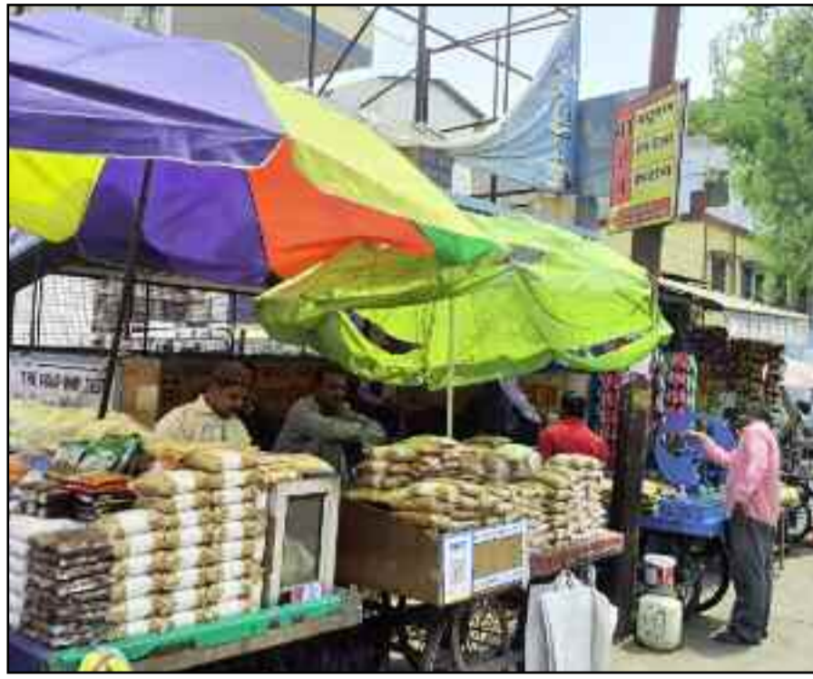
कोटद्वार के स्टेशन रोड में यात्री शेड पर लगी रेहड़ी-ढेली

यह है कि शहर को अतिक्रमण मुक्त बनाने के दावे करने वाली पुलिस को यात्री शेड पर हुआ अतिक्रमण नहीं दिखाई देता।