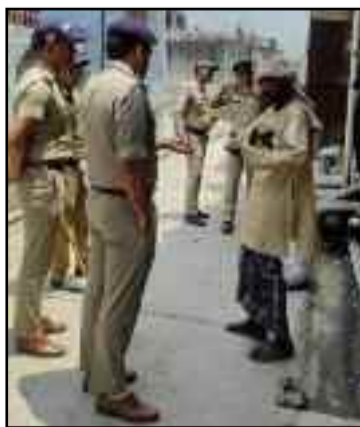
कोटद्वार में सत्यापन अभियान चलाती पुलिस