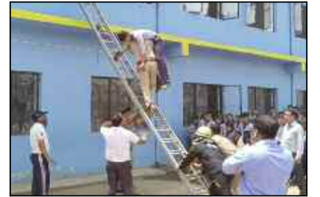
कोटद्वार में माँक ड्रिल के दौरान विद्यालय की छत में फंसे विद्यार्थियों को निकालती दमकल टीम

बचाव के लिए जागरूकता जरूरी है। आग जैसी घटनाओं को समय पर रोका जा सके इसके लिए हमें अग्निशमन उपकरणों के प्रयोग की जानकारी होनी चाहिए। कार्यशाला के दौरान माँक ड्रिल के माध्यम से रसोई सिलेंडर में आग लगने पर उसे बुझाना व छत या पहाड़ में फंसे लोगों का रेस्क्यू किसी तरह किया जाए इस बारे में विस्तार से जानकारी दी गई। अधिकारियों ने