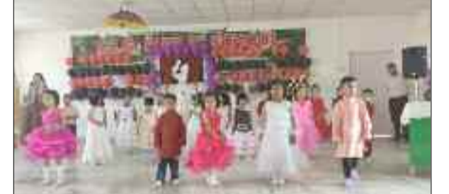
टीसीजी पब्लिक स्कूल में नृत्य प्रस्तुत करते नन्हें बच्चों