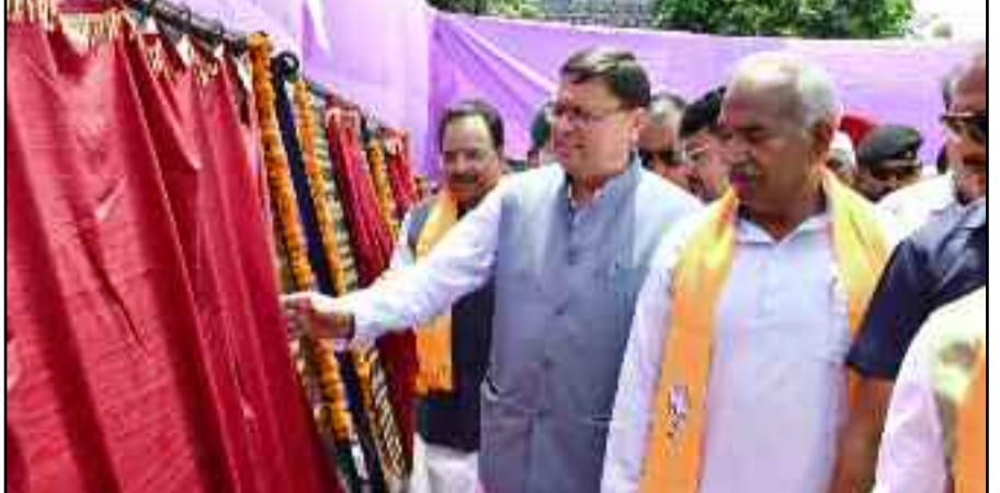
मुख्यमंत्री पुष्कर सिंह धामी काशीपुर में विकास योजनाओं का शिलान्यास एवं लोकार्पण करते हुए।

सिलेंडर निःशुल्क देने का काम किया। आज एक लाख 81 हजार परिवारों को साल में तीन गैस सिलेंडर मुफ्त देने का काम कर रहे हैं। उन्होंने कहा कि उत्तराखण्ड में 15 लाख के सापेक्ष 11 लाख 30 हजार घरों को पेयजल उपलब्ध करा दिया गया है। उन्होंने कहा कि प्रधानमंत्री नरेंद्र मोदी ने देश के गौरवमय मार्ग को प्रशस्त करने के लिए 'सबका साथ, सबका विकास, सबका विश्वास, सबका प्रयास' का जो मंत्र दिया है उसने देश की दिशा और दशा को बदलने का कार्य किया है। प्रधानमंत्री द्वारा प्रारंभ की गई गरीब कल्याण योजनाओं ने अंतिम पायदान पर खड़े हुए प्रत्येक व्यक्ति के चेहरे पर मुस्कान लाने का काम किया है। उन्होंने कहा कि पहले केवल योजनाएं बनाई जाती थीं, परन्तु अब योजनाएं भी बनाई जाती हैं और उनको लागू भी किया जाता है। कहा कि आज केन्द्र और