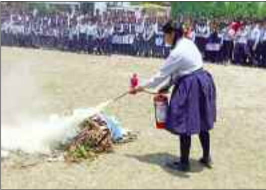
कोटद्वार के बाल भारतीय सीनियर सेकेंड्री स्कूल में छात्रों को अग्निशमन उपकरणों की जानकारी देते अधिकारी

जयन्त प्रतिनिधि। कोटद्वार : अग्निशमन विभाग की ओर से विद्यार्थियों को आग पर काबू पाने के तरीके बताए गए। इस दौरान अधिकारियों ने जानकारी को अधिक से अधिक लोगों तक पहुंचाने की अपील की।