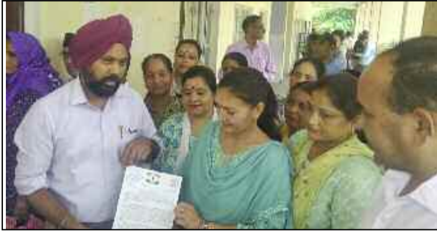
: तहसीलदार के माध्यम से राष्ट्रपति को ज्ञापन भेजती महिला कांग्रेस सदस्य।