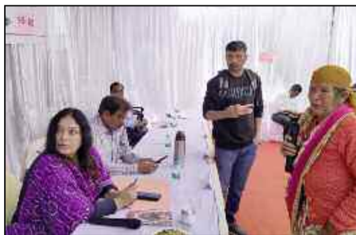
पौड़ी तहसील दिवस में महिला शिकायत दर्ज कराते हुए।