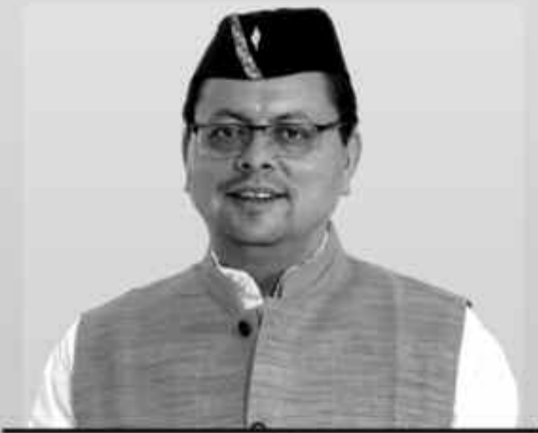
पुष्कर सिंह धामी मुख्यमंत्री, उत्तराखण्ड

देवभूमि उत्तराखण्ड में जी-20 प्रतिनिधियों का हार्दिक स्वागत एवं अभिनन्दन