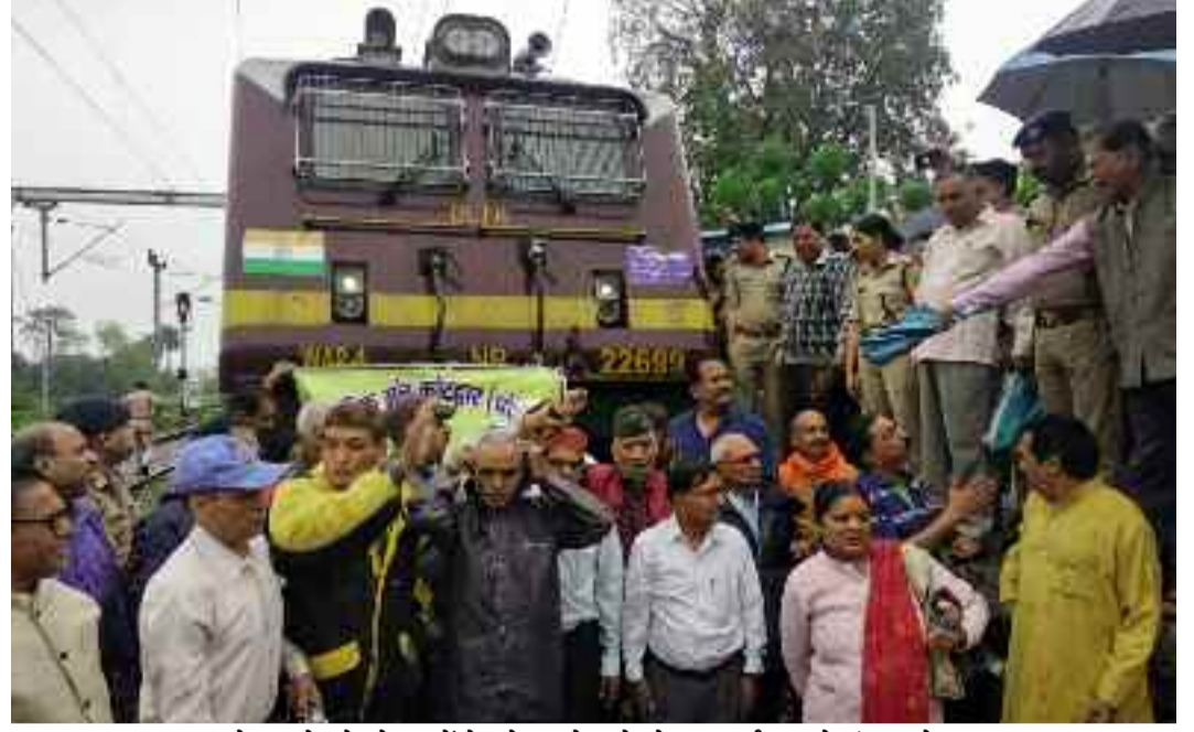
कोटद्वार रेलवे स्टेशन में ट्रेन के आगे खड़े होकर प्रदर्शन करते संगठन के सदस्य